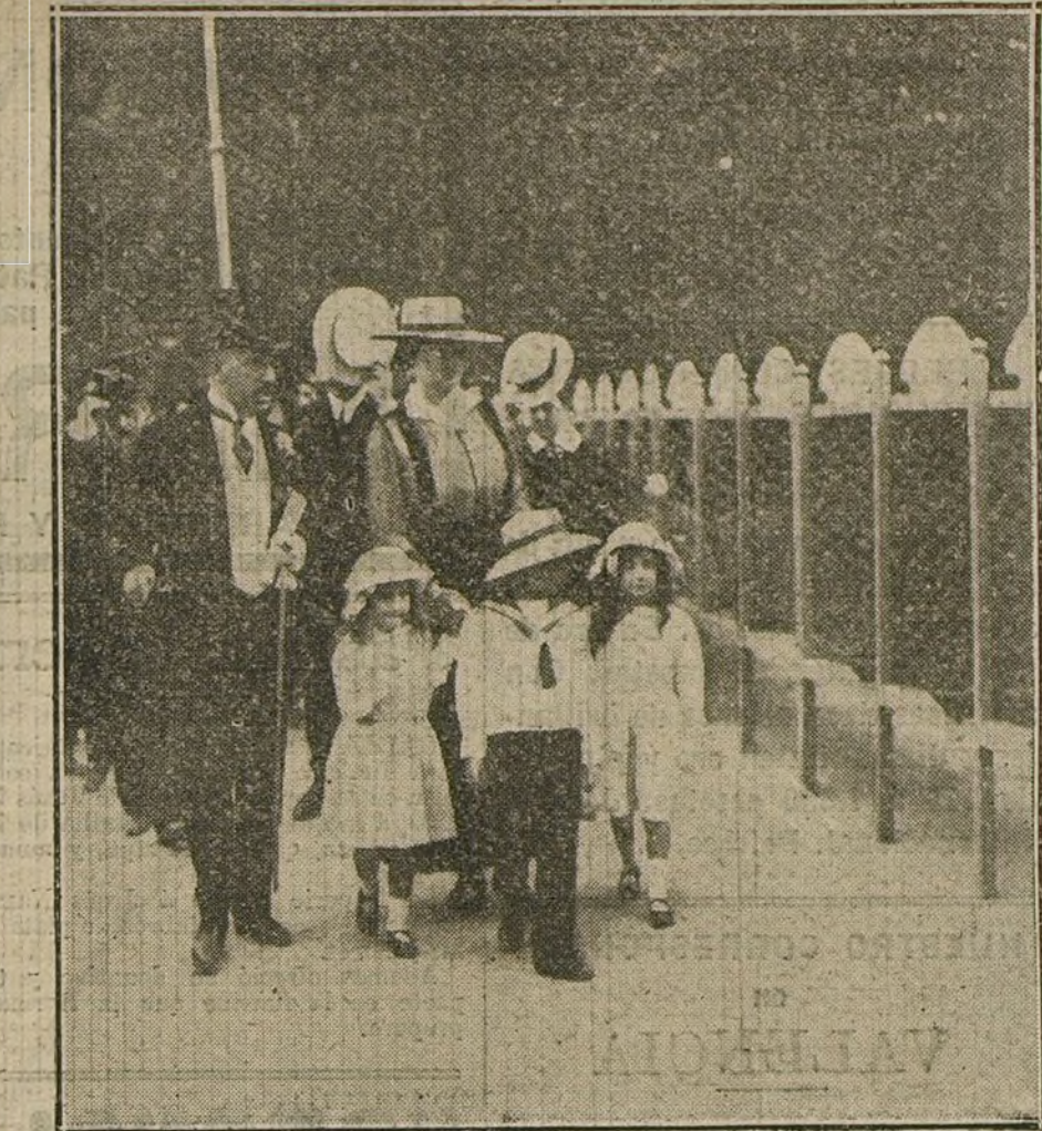
EXPOSICION CANINA.—La Infanta Luisa, con sus hijos, ante la sección de galgos.

Esta enérgica ofensiva era temida y esperada, ya que llevan más de un mes los italianos anunciándonos la concentración de refuerzos de importancia en el campo rival; pero no estamos conformes, ni tal es el camino, con los optimismos placidos del ex asedado «Le Temps», que asegura muy en serio que el alto mando italiano había tomado todas las disposiciones convenientes para evitar la manio-