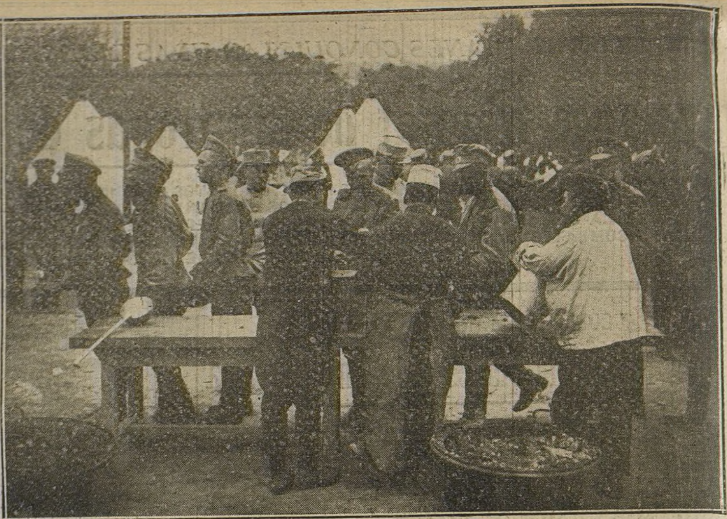
LOS RUSOS EN FRANCIA. —Distribución de rancho a los contingentes rusos desembarcados en Marsella.

El buque petrolero alemán «Herabab», de 4.700 toneladas, fué torpedeado por un submarino ruso cerca de la isla de