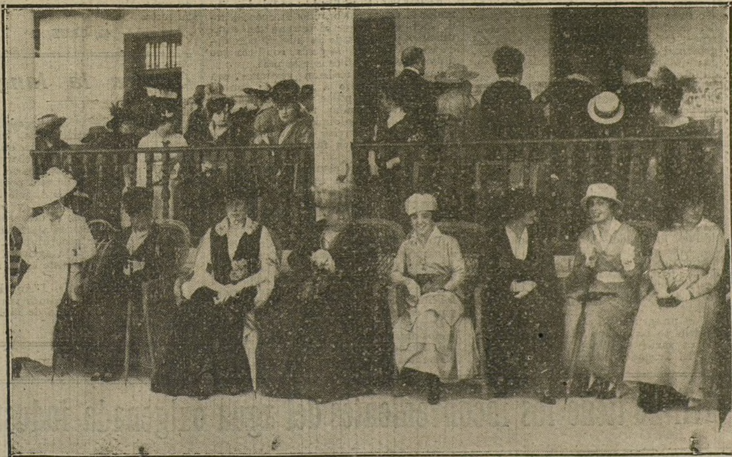
TIRO DE PICHON.—Campeonato de España.—S. M. la Reina con la Infanta Doña Isabel presenciando las tiradas.

LA TAREA DE DEVOLVER TODOS LOS TRABAJOS QUE NO PUBLICAMOS SERIA ABRUMADORA, Y PARA EVITARLA, COMO PARA PREVENIR RECLAMACIONES, QUE RESULTARIA IMPOSIBLE ATENDER, RECORDAMOS QUE NO SE DEVUELVEN LOS ORIGINALES.