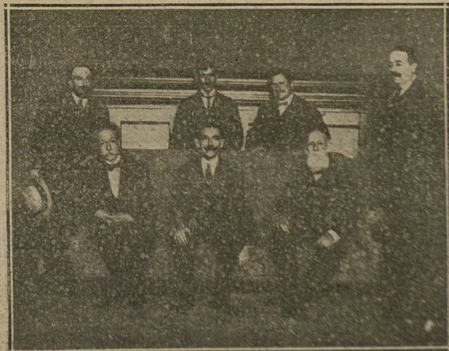
EN EL ATENEO.—Conferencia de D. José de Diego.—El ilustre presidente de la Cámara portorriqueña, acompañado de los Sres. Labra y Carrasco.

Poderoso desinfectante perfumado para habitaciones. De fama mundial. Pedirlo en bazares médicos, buenas perfumerías y GAYOSO, ARENAL, 2.