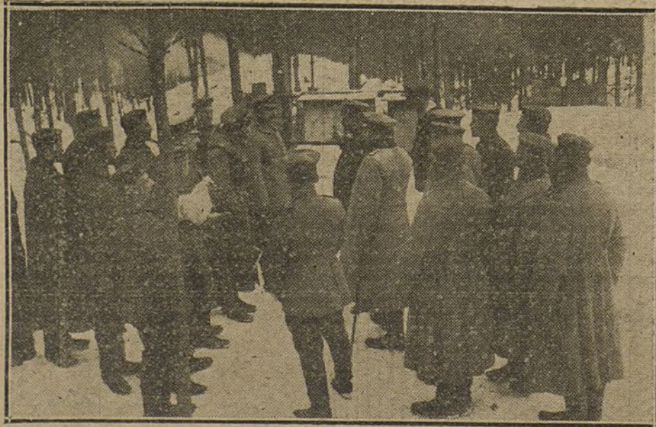
EN EL FRENTE RUSO.—Un comandante de un puesto alemán explicando á sus soldados, en un mapa, la marcha de la guerra, según las noticias que recibe por la radiotelegrafía.

El «Freundenblatt» escribe: «Tanto el Ejército como el pueblo, confían plenamente en el Príncipe Imperial, que ganó durante estos gloriosos combates los primeros laureles.»