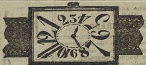
Núm. 4.—Forma rectangular, áncora de precisión, 15 rubies, con pulsera de cuero. En oro de ley 18 quilates, ptas... 140. En plata de ley, ptas... 60.