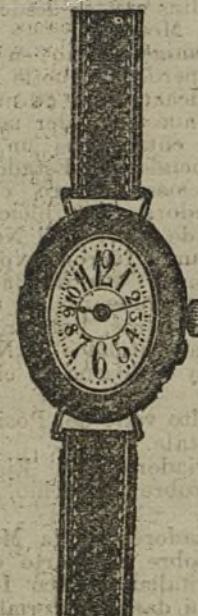
Núm. 14.—Forma ovalada, máquina especial, con pulsera de moiré. En oro de ley 18 quilates, ptas... 125. En plata de ley, pesetas... 50.