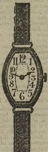
Núm. 15.—Forma tonneau, máquina especial, con pulsera de moiré. En oro de ley 18 quilates, ptas... 140. En plata de ley, pesetas... 60.

Joyería Internacional Casa importadora de Joyas, Relojes y Piedras Preciosas