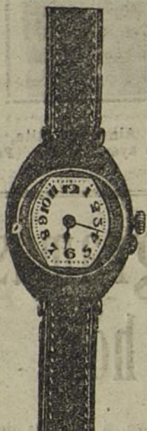
Núm. 1.—Simil tonneau, máquina fina, sobre rubies, con pulsera de moiré. En oro de ley 18 quilates, ptas... 75. En plata de ley, pesetas... 40.

Garantía efectiva de buena marcha por cinco años