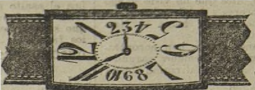
Núm. 8.—Tonneau áncora, con cuero fino. En oro de ley 18 quilates, ptas... 100. En plata de ley, pesetas... 45.