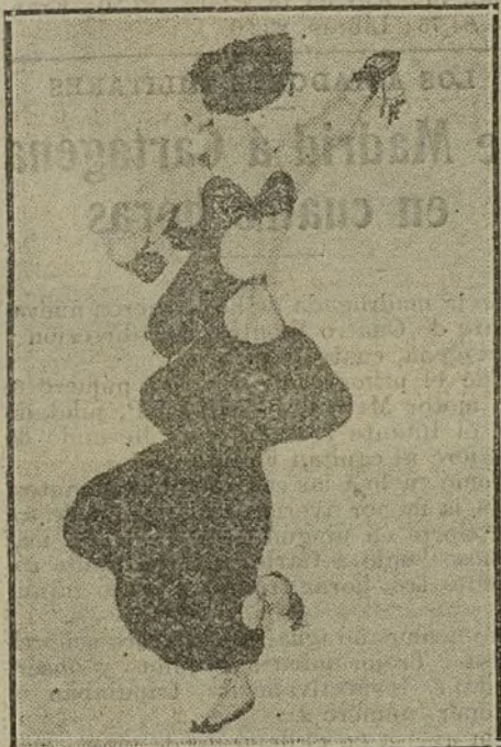
Figurín de León Bakst para «Scheherazada».

La actitud del público frente a los Bailes rusos fué de sorpresa y de asombro. En decorado, en trajes, en interpretación, no se ha hecho nunca aquí nada parecido. El exotismo de los Bailes rusos tiene dos partes: lo no habitual de ellos en nuestras costumbres teatrales, y