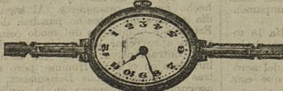
Núm. 12.—Forma ovalada, áncora de precisión, 15 rubies, con pulsera extensible. En oro de ley 18 quilates, ptas... 225. En plata de ley, ptas... 95.