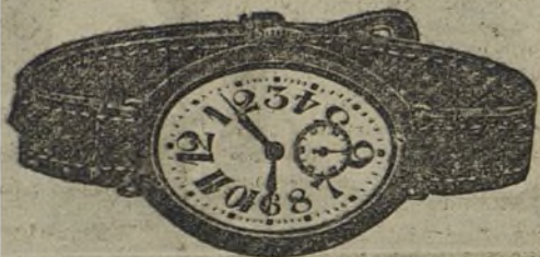
Núm. 3.—Forma ovalada, áncora de precisión, 15 rubies, con pulsera de cuero. En oro de ley 18 quilates, ptas... 125. En plata de ley, ptas... 55.