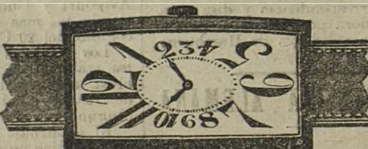
Núm. 6.—Forma ovalada, alargada, áncora de precisión, 15 rubies con pulsera de cuero. En oro de ley 18 quilates, ptas... 165. En plata de ley, ptas... 70.