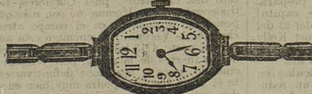
Núm. 13.—Forma tonneau, áncora de precisión, 15 rubies, nueve líneas, con pulsera extensible. En oro de ley 18 quilates, ptas... 250. En plata de ley, ptas... 110.