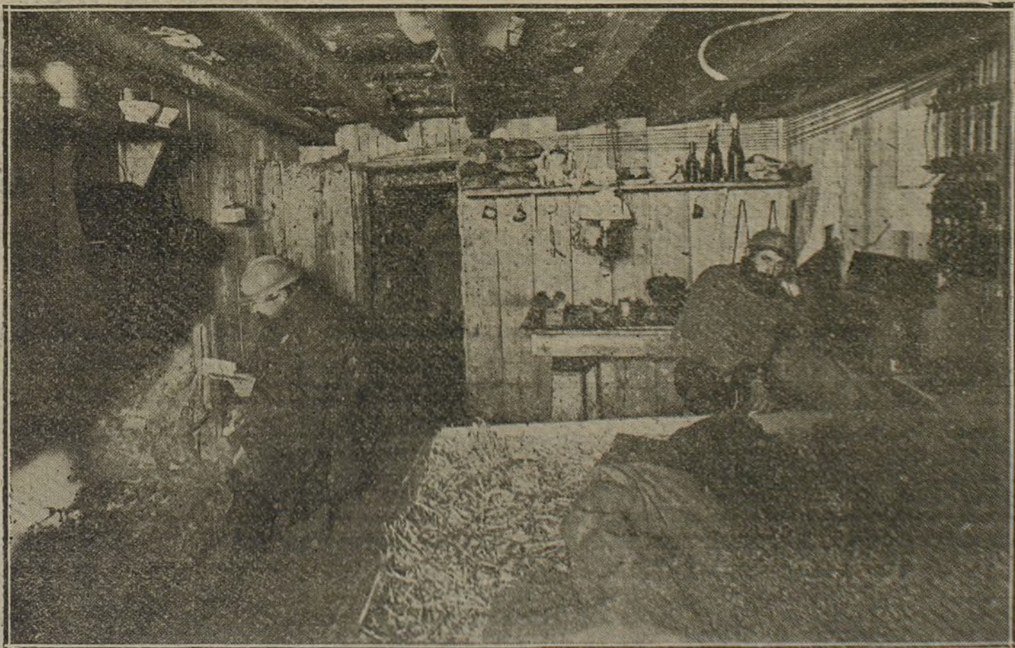
EL CONFORT EN LAS TRINCHERAS.—Interior de un puesto telefónico francés, subterráneo.

Representarán: «Le Cid», de Corneille; «Les précieuses ridicules», de Molière; «Il ne faut jurer de rien», de Alfred de Musset; «Les jeux de l'amour et du hasard», de Marivaux; «Andromaque» de Racine; «Les nuits», de Musset; «Le médecin malgré lui», y puede que alguna otra.