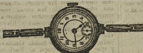
Núm. 11.—Forma Paris, con segundo, áncora de precisión, 15 rubies, ocho y media líneas, con pulsera extensible. En oro de ley 18 quilates, ptas... 200. En plata de ley, ptas... 75.