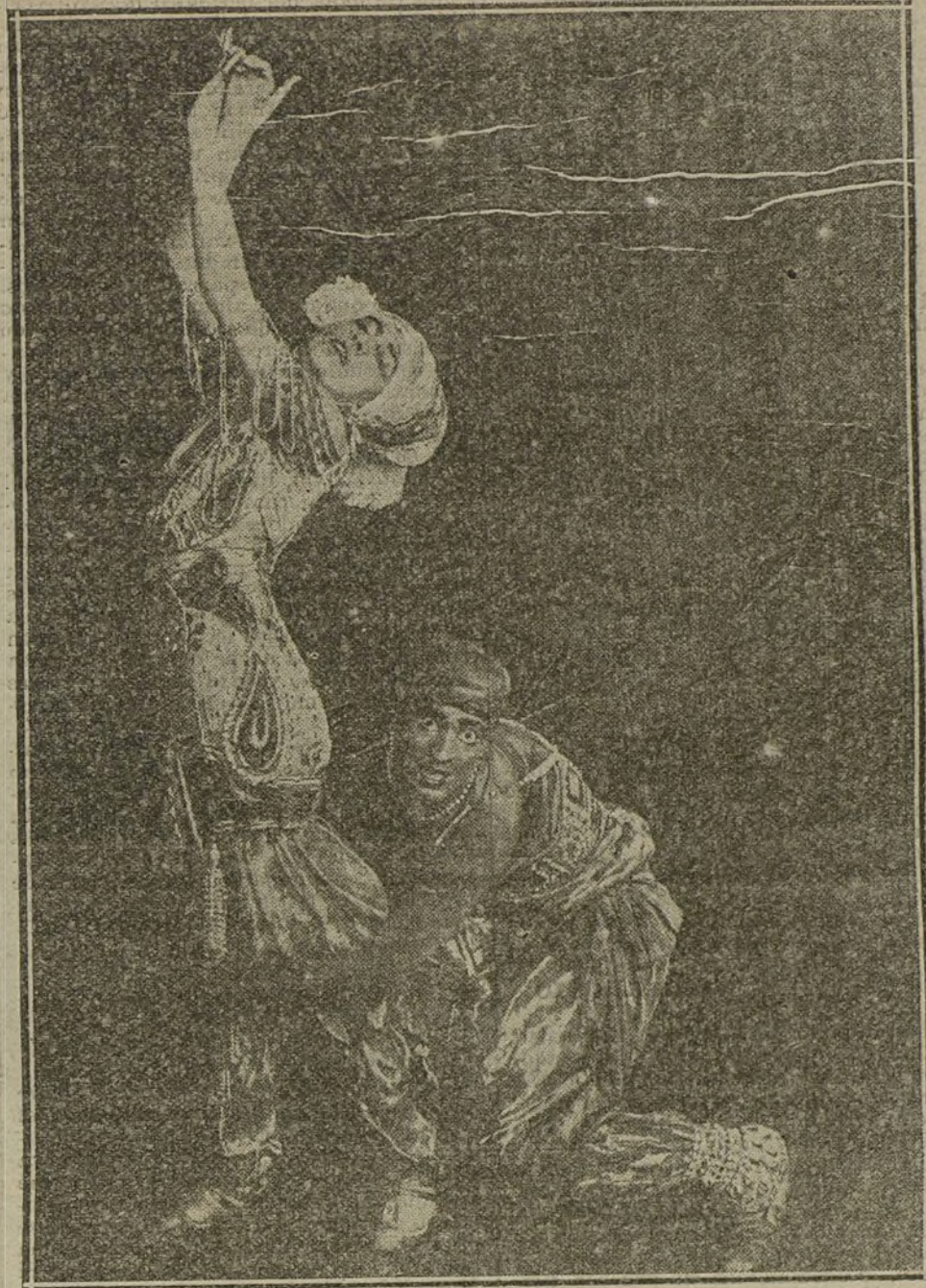
Un momento de «Scheherazada».

sesudo asegurando que el público pateó y siseó la inmoralidad de unas escenas. ¡Ca! Así como hay una galantería meramente modular—la que nos hace ceder el tranvía a las mujeres guapas—, también existe un espíritu de protesta ante la pareja de enamorados, que prescinde de que el bano en que se sienta esté situado en la Castellana ó en el Retiro.