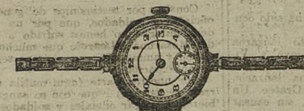
Núm. 10.—Forma Paris, con segundo, áncora de precisión, 15 rubies, con pulsera extensible. En oro de ley 18 quilates, ptas... 150. En plata de ley, ptas... 60.