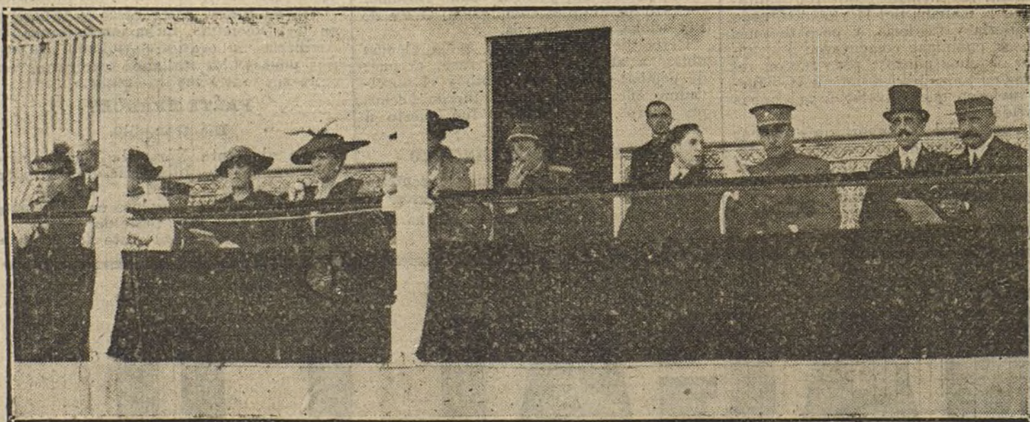
LA FAMILIA REAL en el Concurso hipico de ayer.

Las elecciones han sido hechas con orden.