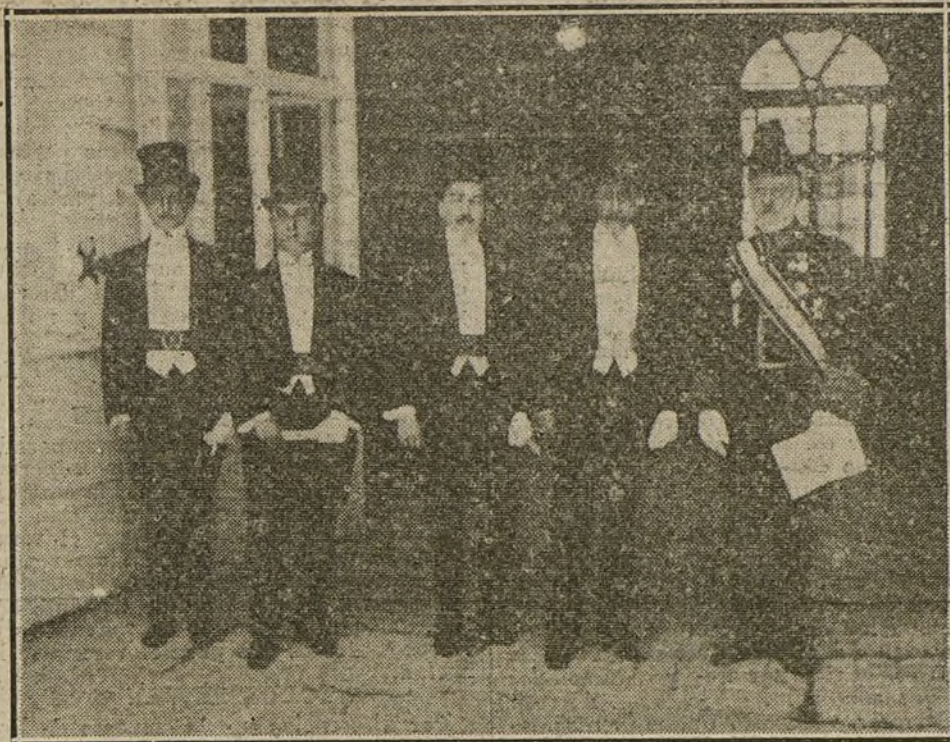
El nuevo ministro de Méjico en España, con los demás miembros de la Legación, al salir de presentar sus credenciales a S. M. el Rey. Les acompaña el introductor de embajadores Sr. Heredia.

El ministro de Instrucción pública recordó que en una institución creada