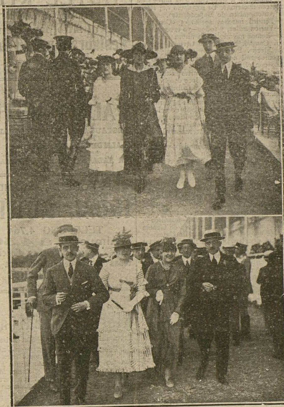
LOS ELEGANTES MADRILEÑOS.—Instantáneas tomadas en el Concurso hípico de ayer.

Este es un muchacho de veinte años, que se pasa el día detrás del mostrador de la tienda. A las ocho en punto—es una de sus conquistas sociales—sale a la calle para bromear y reír y echar un pipero, discreto y correcto, a la modistilla que pasa. No entra en el bar, ni toma asiento en el café. Se detiene en el kiosco de bebidas de la Rambla de Canalejas. Invierte un perro chico en una horchata y se suma unos minutos al grupo de deportistas, que comenta acaloradamente la