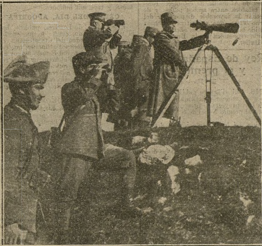
EN EL FRENTE ITALIANO.—El Rey Victor Manuel, con algunos miembros de su Estado Mayor, observando un momento de la lucha.

«En Galitzia, región comprendida entre los pueblos de Gliaki y Vorobienka, al Norte de Tarnopol, el enemigo atacó