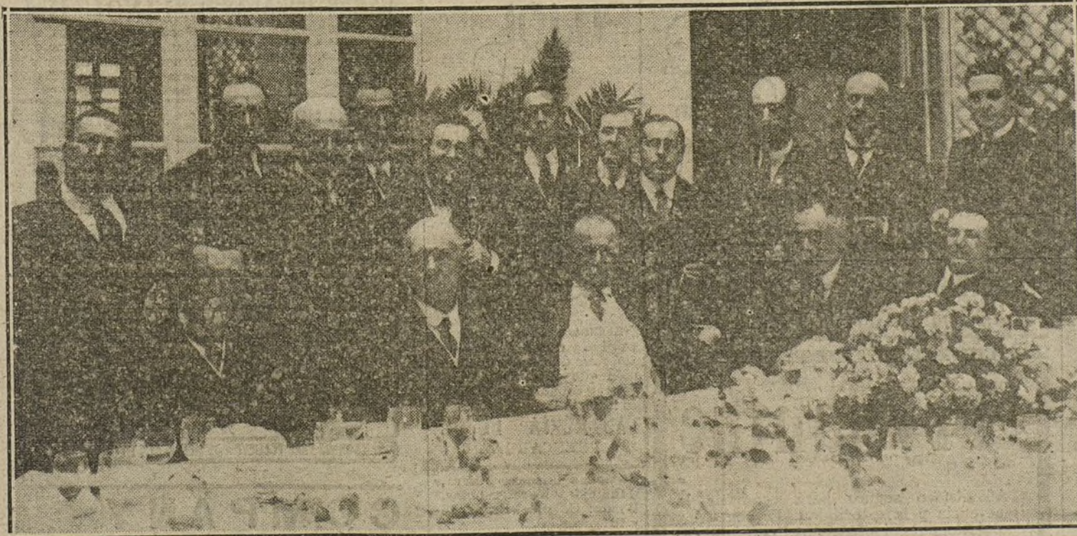
Los diputados y senadores liberales de Cataluña en el banquete con que hoy obsequiaron al conde de Romanones.

OBSEQUIARA PROXIMAMENTE A SUS LECTORES CON UNA INTERESANTE REVISTA DE MODAS