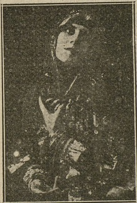
TORTOLA VALENCIA, la genial artista de la danza, que ha impresionado varias cintas.