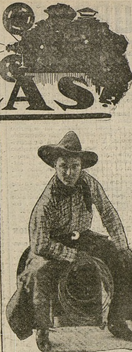
TOM MIX, artista de cine y diestro «cowboy».

Ante numeroso público, proyectóse ayer tarde en el Trianon dos películas de la reciente producción de la «Studio-Films»,