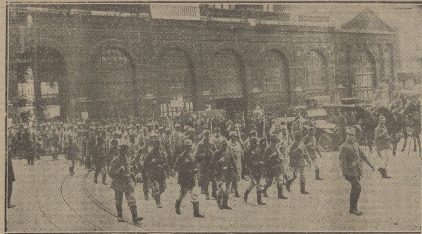
Una columna de prisioneros franceses al ser conducidos a Alemania después de la fracasada ofensiva de la Champaña.

LOS QUE SUSCRIBEN, AMANTES Y CULTIVADORES DE LAS CIENCIAS Y LAS ARTES, AFIRMANDO LA NEUTRALIDAD DEL ESTADO ESPAÑOL, SE COMPLACEN EN MANIFESTAR LA MAS RENDIDA ADMIRACION Y SIMPATIA POR LA GRANDEZA DEL PUEBLO GERMANICO, CUYOS INTERESES SON PERFECTAMENTE ARMONICOS CON LOS DE ESPAÑA, ASI COMO TAMBIEN SU PROFUNDO RECONOCIMIENTO A LA MAGNIFICENCIA DE LA CULTURA ALEMANA Y SU PODEROSA CONTRIBUCION PARA EL PROGRESO DEL MUNDO