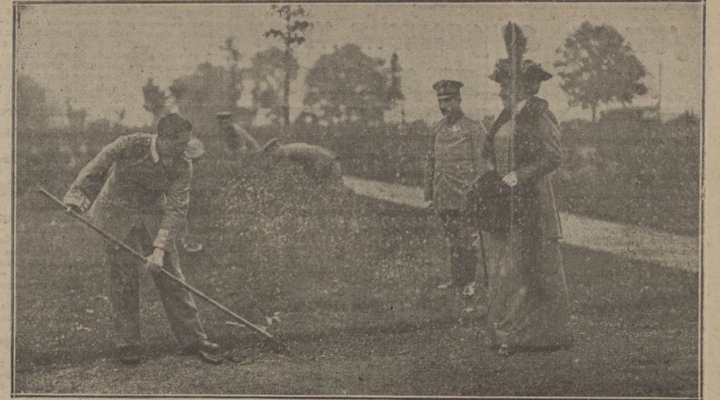
La Emperatriz de Alemania visitando una Casa de inválidos de la guerra, situada en las cercanías de Berlín.