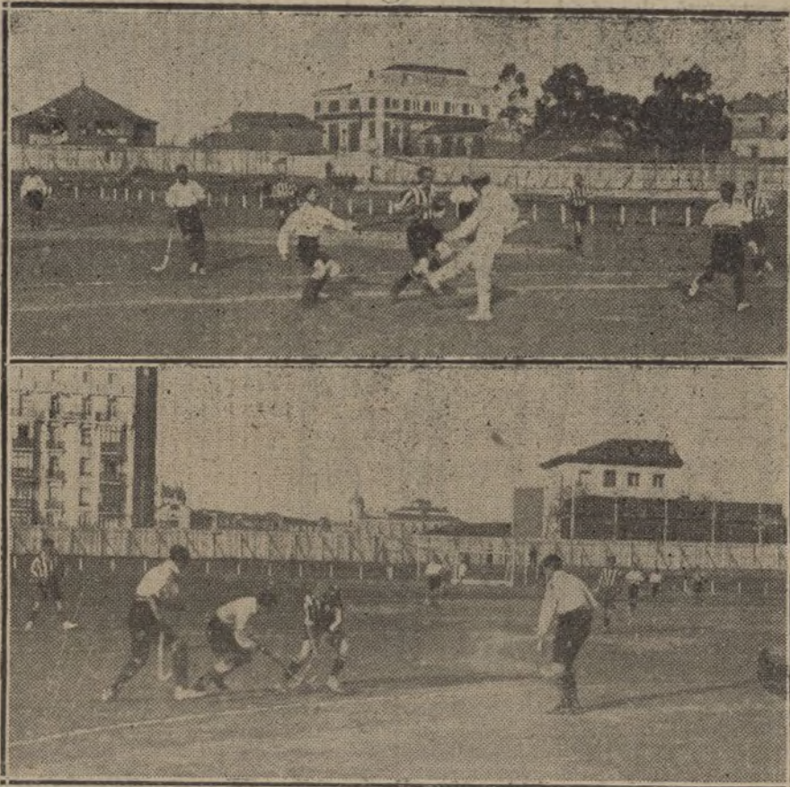
PARTIDOS DE HOCKEY. —Dos momentos interesantes del partido jugado por el equipo del Real Polo Jockey Club, de Barcelona, y el Athletic de Madrid, quedando vencedor este último.

Hay vivísimo interés por presenciar el partido que se celebrará mañana día 6 en el campo de la Gimnástica (calle de la Princesa, cerca de Alberto Aguilera) entre los equipos seleccionados Cataluña-