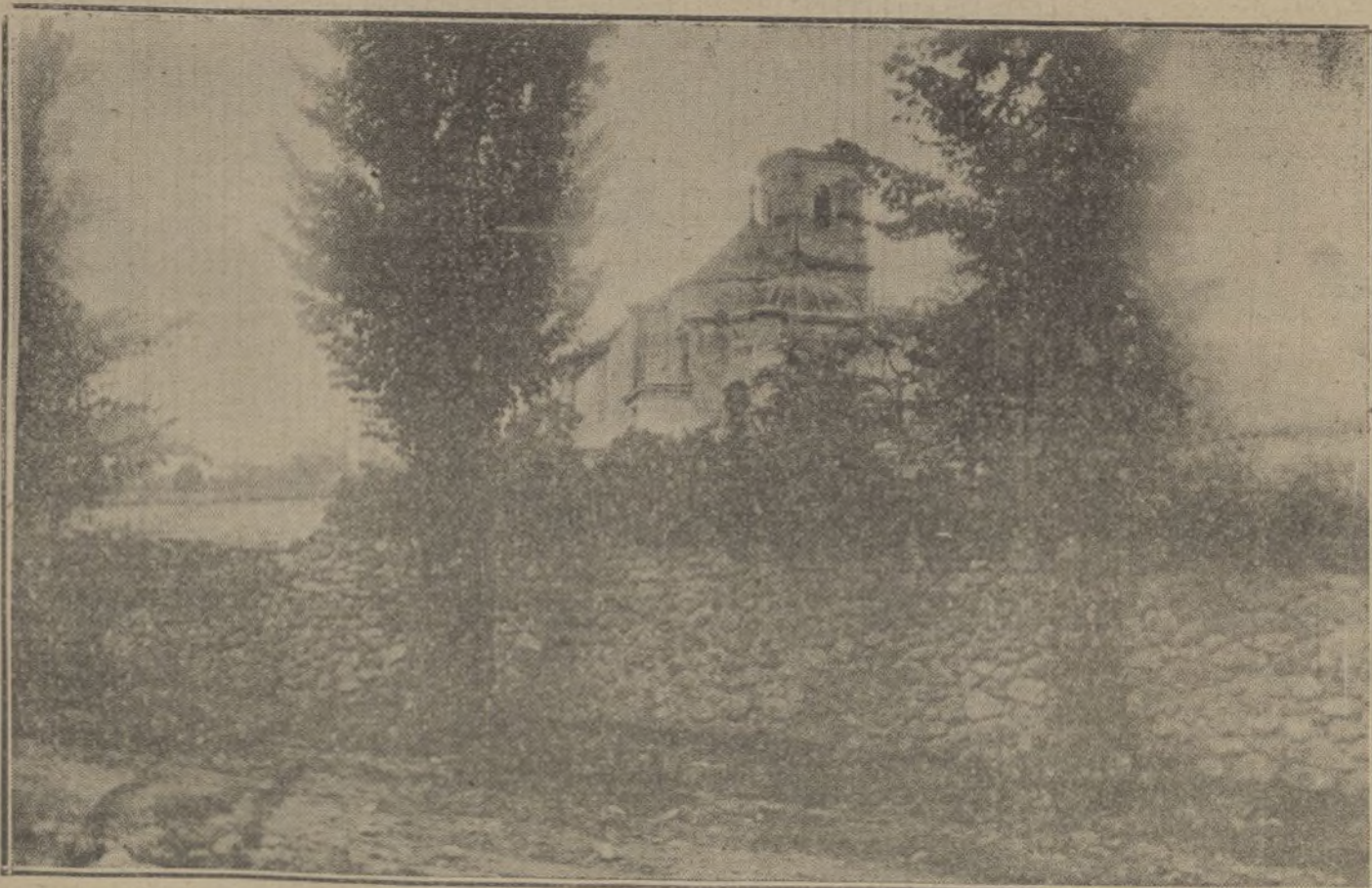
PAISAJES ESPAÑOLES.—Vista general del Monasterio del Paular.

MOTO-GARAGE.—Motocicletas «Jamos», accesorios y reparaciones.—Hermosilla, 55.