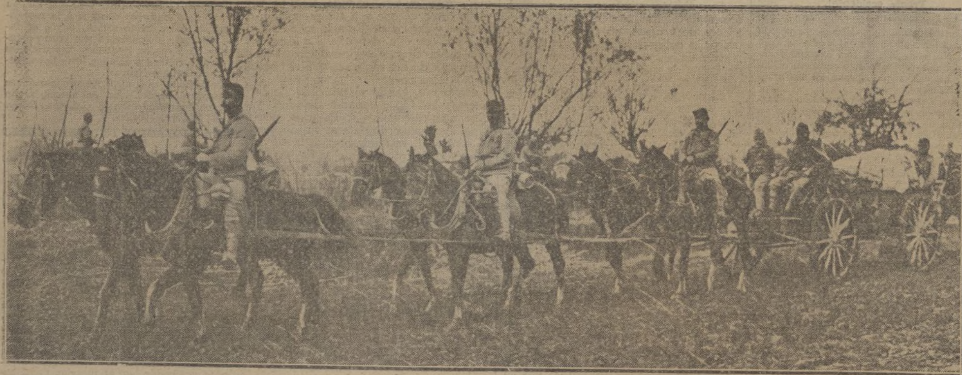
Avance de un convóy austriaco por una región servia desprovista de carreteras.