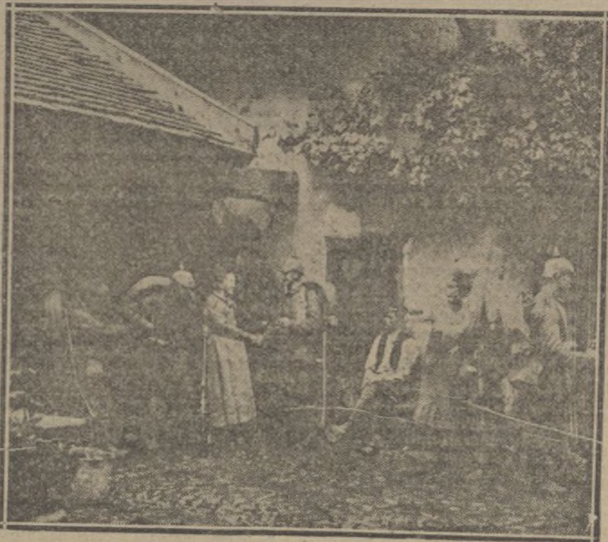
Soldados alemanes despidiéndose de una familia francesa con la que convivieron una temporada.