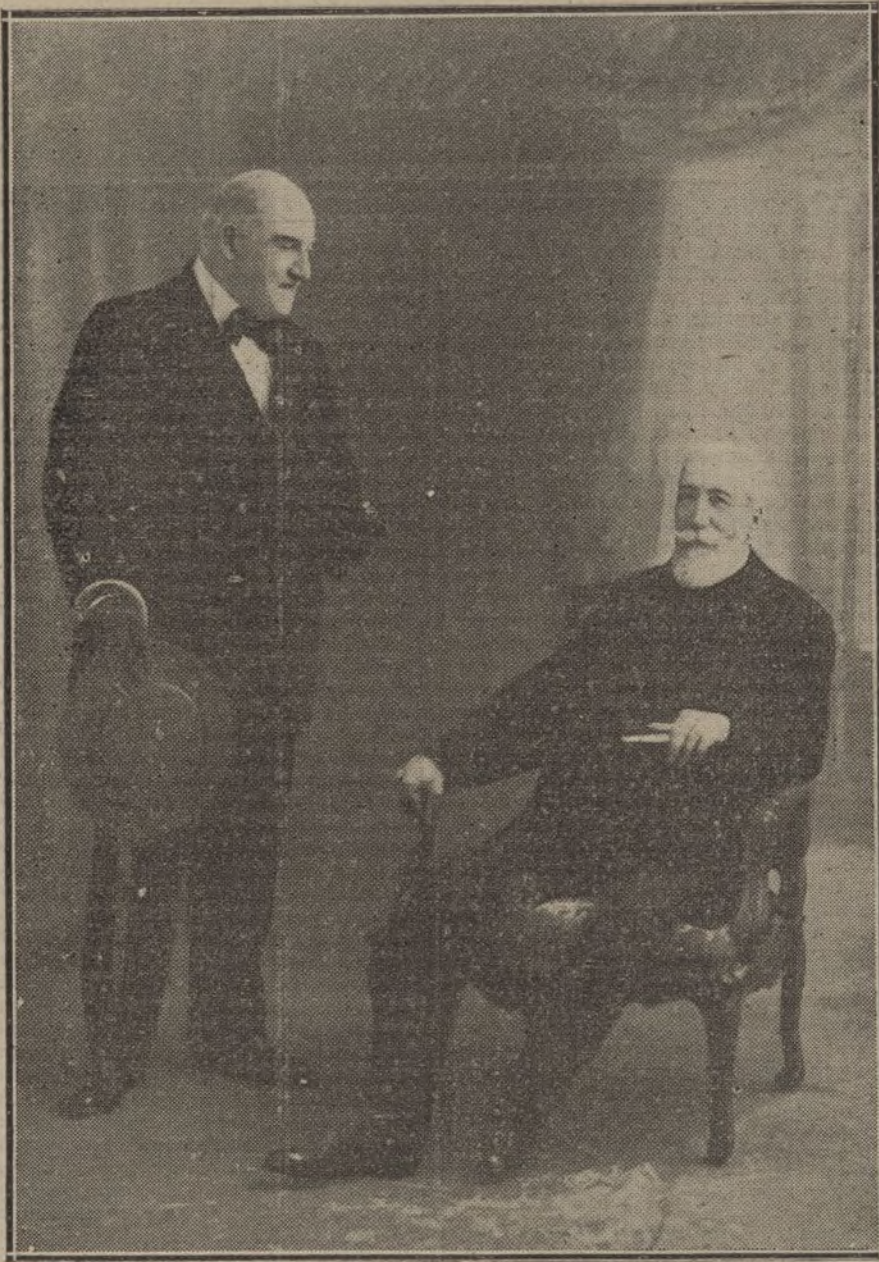
El gran actor francés GUITRY, que debutará el lunes en el teatro de la Princesa. En la fotografía le acompaña el ilustre dramaturgo Anatole France.

Las obras del teatro de Oriente recibieron entonces un poderoso impulso; pero de nuevo, y siempre por cuestión de dinero, se paralizaron ¡otra vez! en 1837, permaneciendo así trece años más, durante los cuales, la parte de edificio ya construida, fué salón de baile, polvorín, cuartel de la Guardia civil y Congreso de los diputados. Esto último, lo garantiza la afirmación de nuestro particular amigo Pepito La Morena, incapaz de decir una cosa por otra.