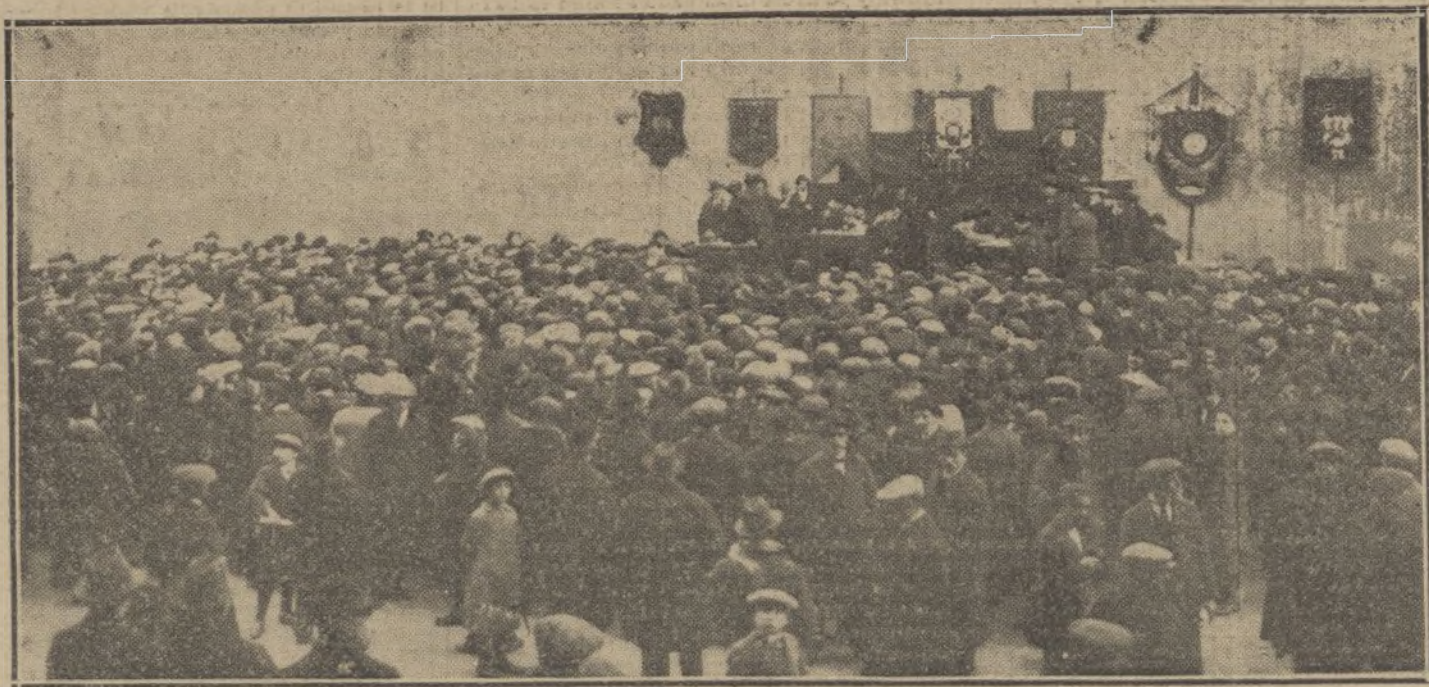
Aspecto del Beti-Jai durante el mitin de protesta contra la carestía de las subsistencias, celebrado ayer tarde.

LA TAREA DE DEVOLVER TODOS LOS TRABAJOS QUE NO PUBLICAMOS SERIA ABISMADORA, Y PARA EVITARLA, COMO PARA PREVENIR RECLAMACIONES, QUE RESULTARIA IMPOSIBLE ATENDER, RECORDAMOS QUE NO SE DEVUELVEN LOS ORIGINALES.