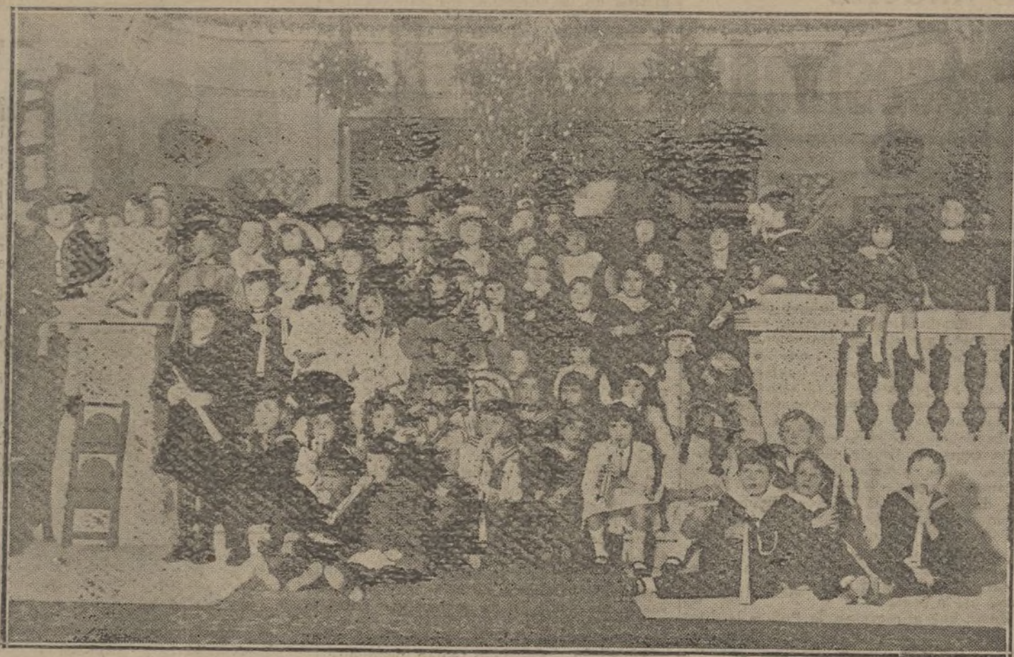
Grupo de niños que tomaron parte en la fiesta infantil celebrada en el hotel Ritz, con motivo de la Adoración de los Reyes.