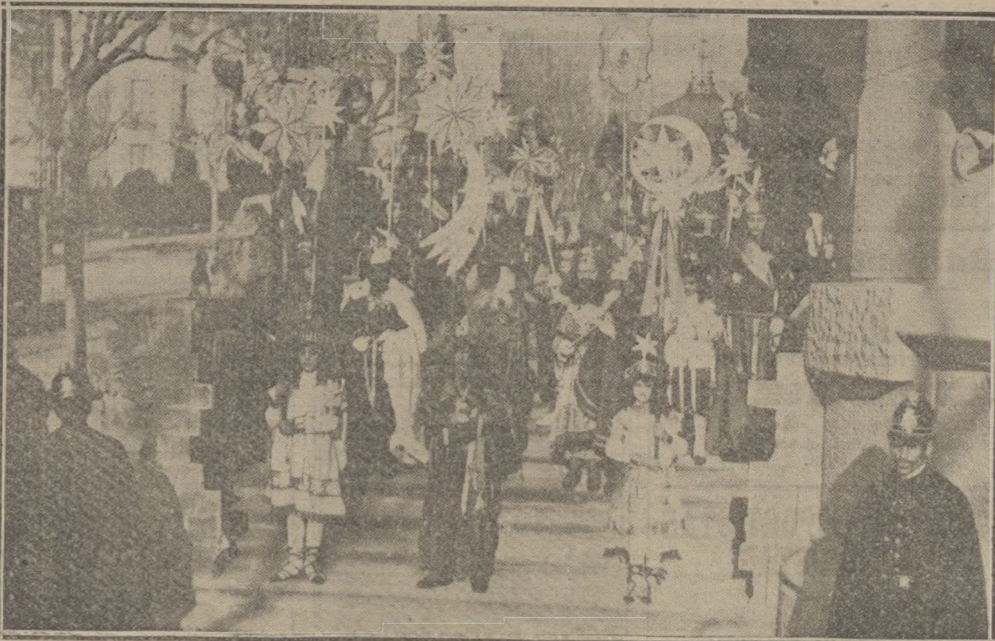
LAS FIESTAS DE REYES EN BARCELONA.—Cabalga organizada por la Asociación del Arbol, con motivo de las fiestas que comenzaron el día de Reyes.