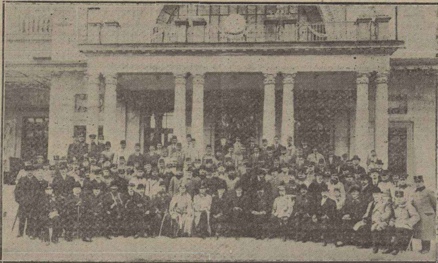
LAS VICTIMAS DE LA GUERRA. —Personalidades políticas y representaciones diplomáticas y militares de Alemania, Austria-Hungría, Turquía y Bulgaria, que asistieron a la inauguración de la Casa Alemana de convalecencia, para los heridos de la campaña, instalada en la ciudad de Wiesbaden.

La gente empieza a preguntarse si realmente nosotros somos tan listos como nos imaginamos. ¿Es que ha sido una buena idea el celebrar Exposiciones y enseñar al mundo cómo fabricábamos nuestros productos, y luego facilitar la misma maquinaria y los mismos capatoces de instrucción a nuestros competidores extranjeros? ¿Es que ha sido prudente obtener fletes baratos empleando vapores alemanes para el transporte de nuestras mercancías? ¿Es que ha sido sabio permitir que Alemania se convirtiera en el único país que puede facilitarnos los mejores tintos, en el único país donde se utilizan