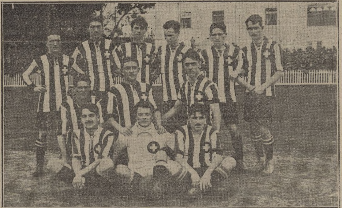
Equipo del Montriön de Suiza, que ha jugado dos interesantes partidos con el Madrid F. C., venciendo en ambos.

En cuanto á lo que usted dice del público, no he de comentarlo. Tiene usted razón en lo que dice de algunos elementos, que creo sean contadísimos; pero pagan, y el que paga puede exigir; claro que de acuerdo con los límites que le marca su educación. Este será un mal, pero que puede existir y existirá en todo espectáculo público y de pago.