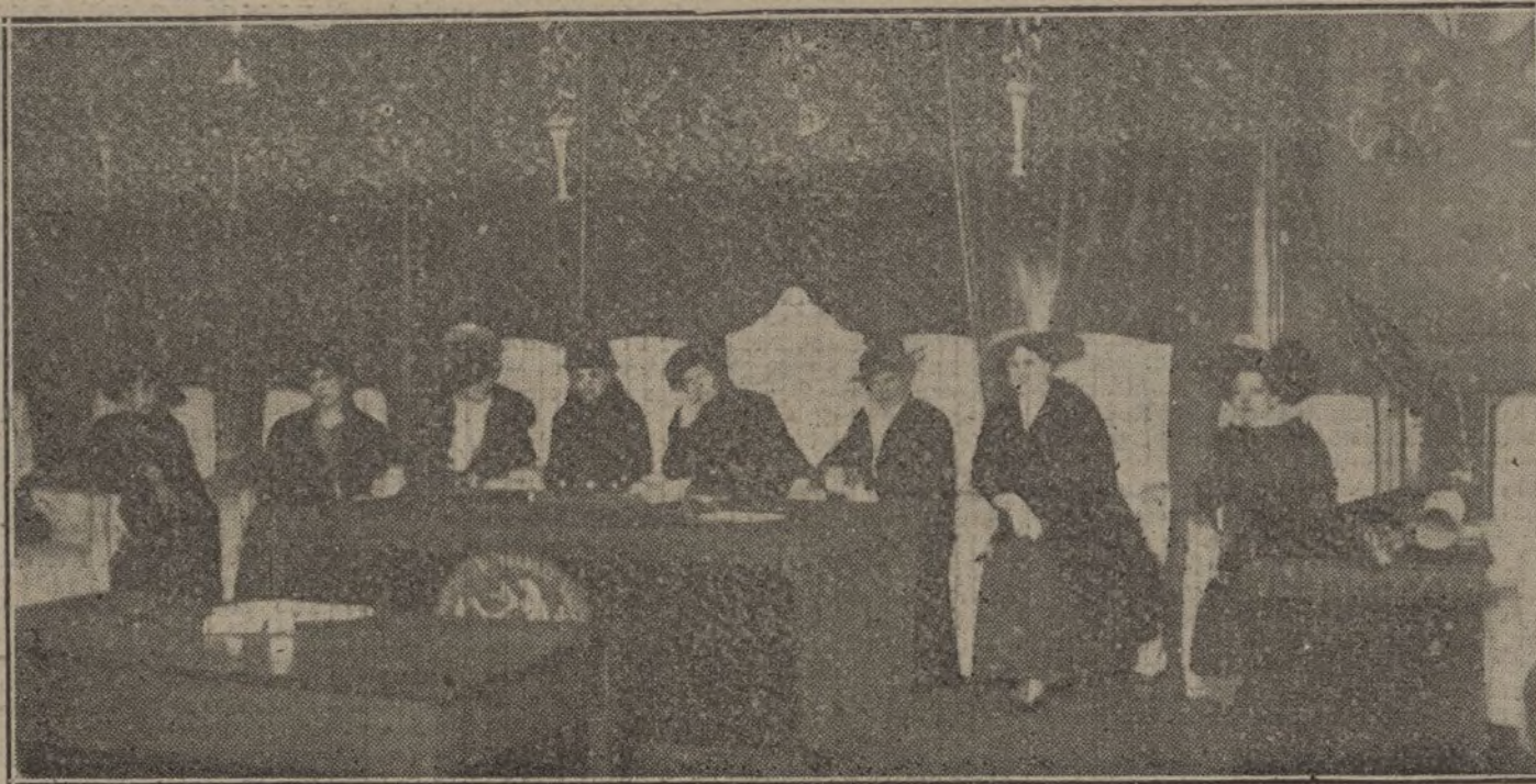
El Comité femenino de Barcelona, que ha inaugurado recientemente una Exposición de dibujos para editar postales de propaganda pacifista.

NUMERO DEL TELEFONO DE LA ADMINISTRACION DE «LA TRIBUNA» (PLAZA DE CANALEJAS, 6): 5.551