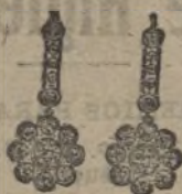
Núm. 200/175.—Pendientes veintiocho brillantes. Ptas. 500.

El aderezo completo en elegante estuche, Ptas. 975.