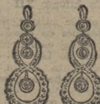
Núm. 200/168.—Pendientes ocho brillantes y diamantes. Ptas. 425.

El aderezo completo en elegante estuche, Ptas. 1.500.