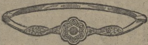
Núm. 203/121.—Pulsera tres brillantes y diamantes. Ptas. 375.