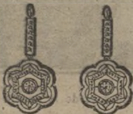
Núm. 200/170.—Pendientes dos brillantes y diamantes. Ptas. 275.

El aderezo completo en elegante estuche, Ptas. 975.