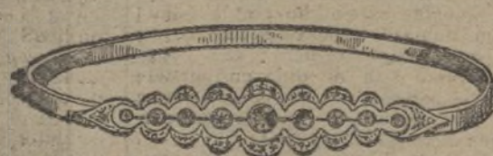
Núm. 203/119.—Pulsera nueve brillantes y diamantes. Ptas. 550.