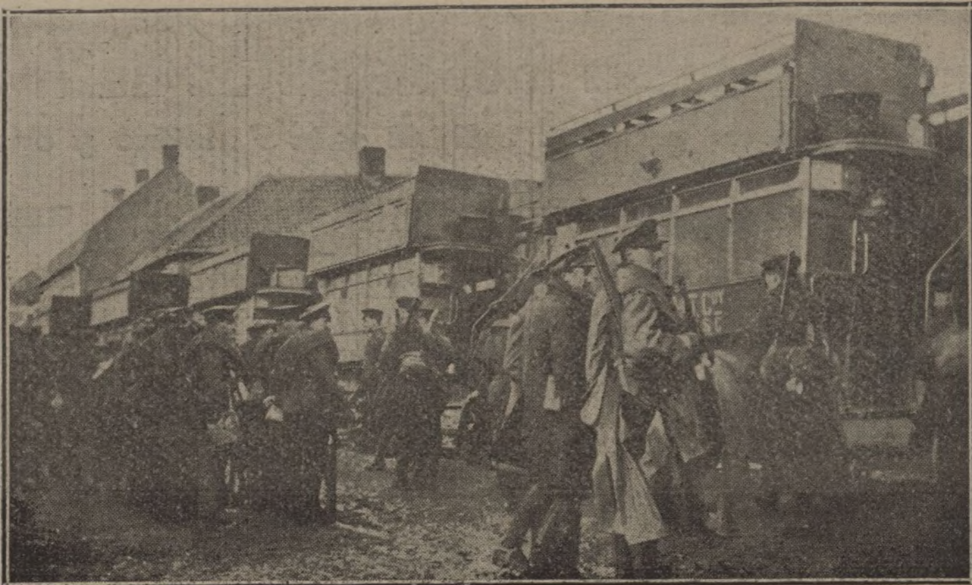
Un destacamento de soldados ingleses disponiéndose á marchar al frente occidental de la guerra para cubrir las bajas de campaña.

Se han practicado algunas detenciones por ejercer coacciones cerca de los obreros que no han querido secundar el movimiento.