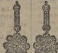
Núm. 200/177.—Pendientes veintiocho brillantes. Ptas. 750.

El aderezo completo en elegante estuche, Ptas. 1.500.