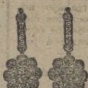
Núm. 200/176.—Pendientes veintiocho brillantes. Ptas. 600.