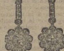
Núm. 200/178.—Pendientes treinta brillantes. Ptas. 1.500.

principal objeto es la divulgación de estos conocimientos entre las clases populares.