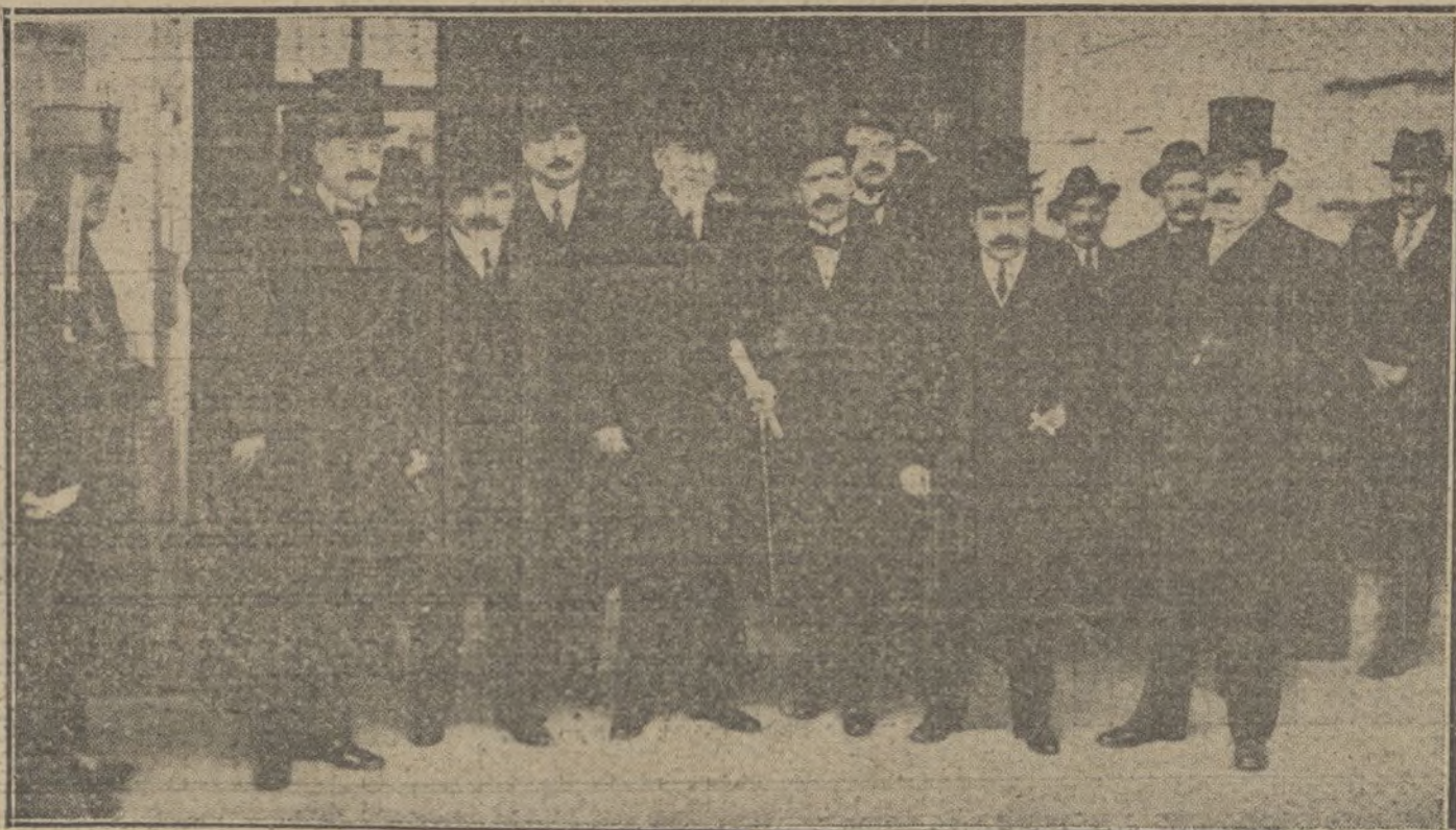
Los tenientes de alcalde del Ayuntamiento de Madrid al salir de Palacio después de ofrecer sus respetos á S. M. el Rey.

Por estar húmedas todavía las obras de la Escuela-Albergue de Alcalá, los golfos que se recojan serán albergados, temporalmente, en el campamento de Desinfección.