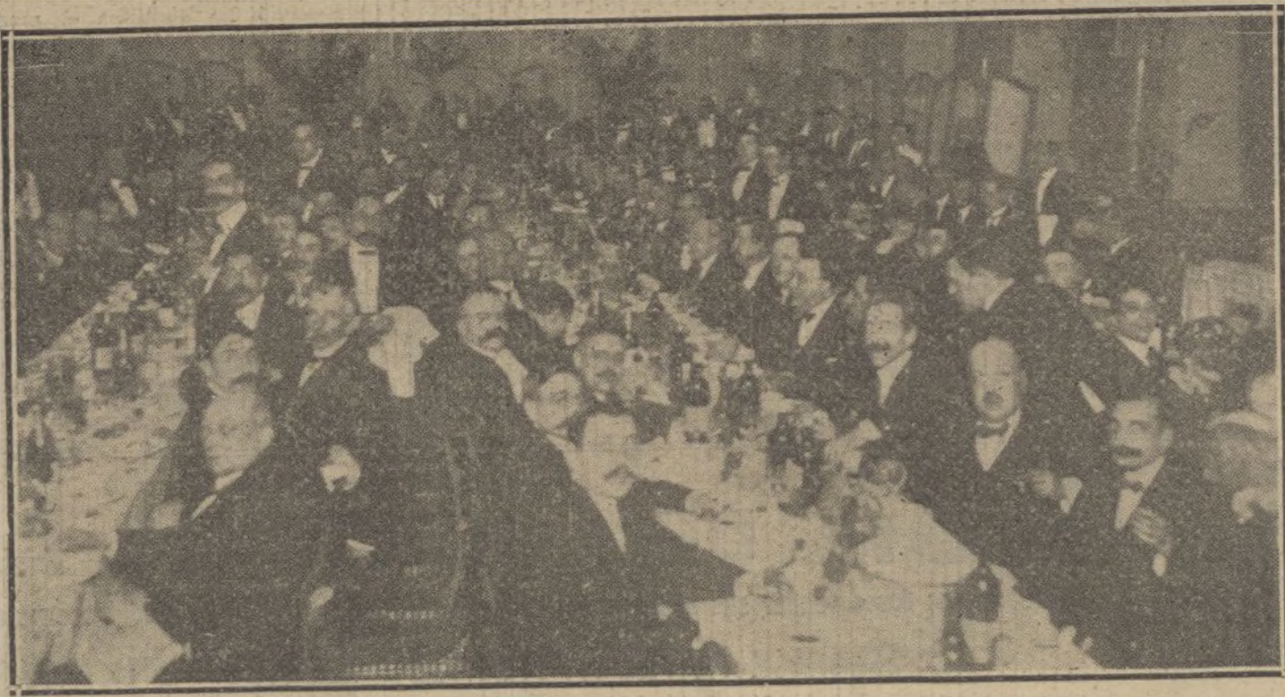
Banquete ofrecido en Barcelona al ilustre maestro Bretón, con motivo de la representación de su ópera «La Dolores» en el teatro Liceo.

La inmoralidad del teatro de Bernstein no reside en su fondo, cuya tendencia a la disciplina ética es innegable, sino que está violentamente manifiesta en la forma, reunión de todas las lacerias espirituales, expuestas con una crudeza rayana en el cinismo; no en la lección nietzscheana sobre