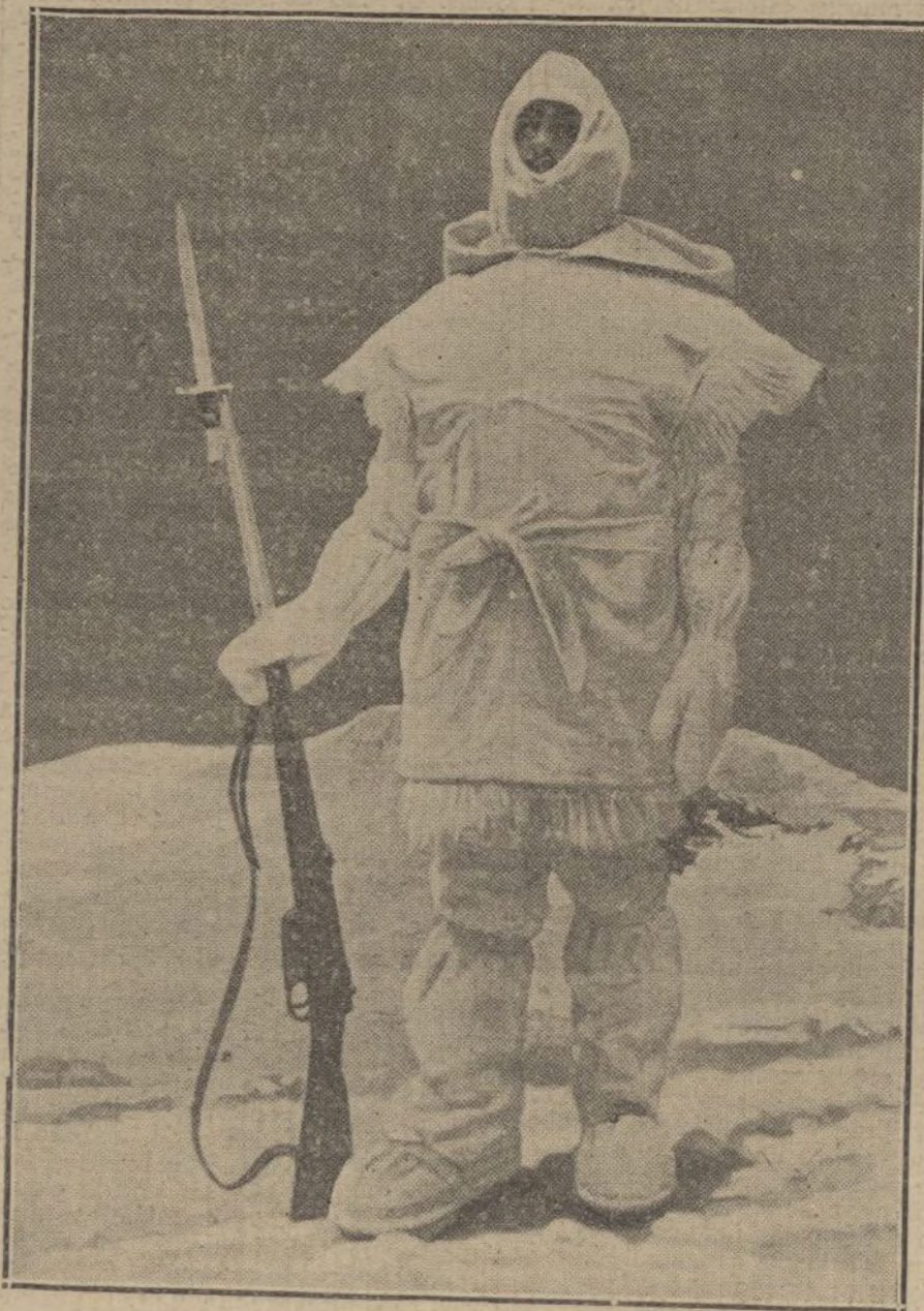
Indumentaria de un guerrero moderno en los Alpes.

Todos los años en Mayo y luego en otoño he pasado semanas en Goritzia al lado de mi madre y he admirado el patriotismo y la lealtad de aquella gente, y sólo deseo que la desgracia de esos valientes y buenos goricianos sea el principio de la derrota definitiva del ejército italiano.»