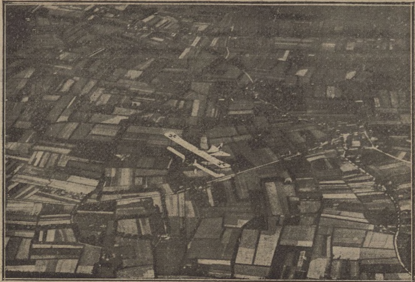
Vuelo de un biplano alemán sobre una ciudad francesa. Fotografía tomada desde otro aeroplano alemán en el momento de cruzar sobre el biplano.