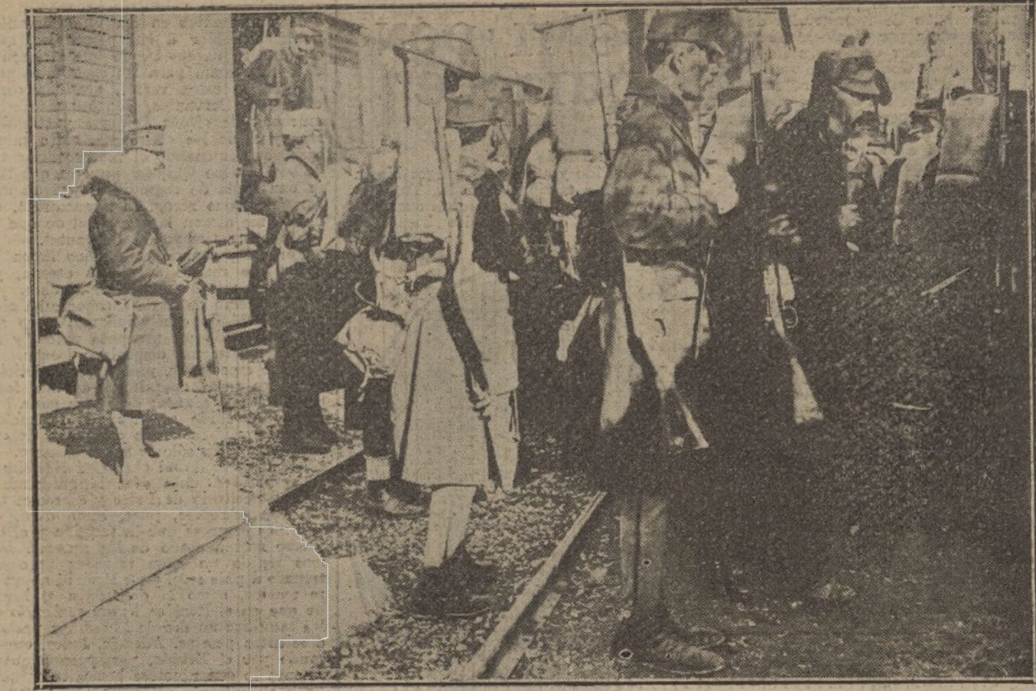
Reservistas croatas dirigiéndose al frente para tomar parte en la persecución de los rusos. (Fot. HOFFER.)

Octava lista..... 600 firmas. Listas anteriores..... 8.100 Total..... 8.700