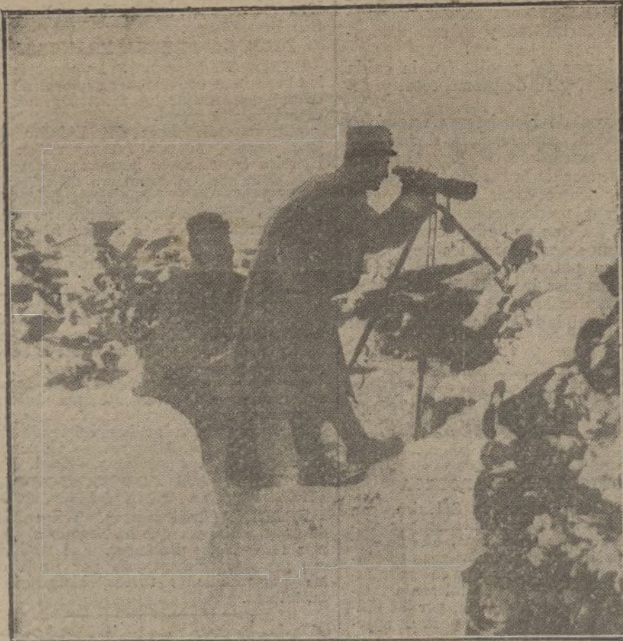
Puesto de observación austriaco, en el frente italiano de los Dolomitas.

«Todos los prisioneros parecían gozar de buena salud, mostrándose contentos, y sus relaciones con los vigilantes alemanes parecían ser amistosas. El comandante del campamento demuestra interés en su trabajo; él conoce a la mayoría de los prisioneros por sus nombres, y pare-