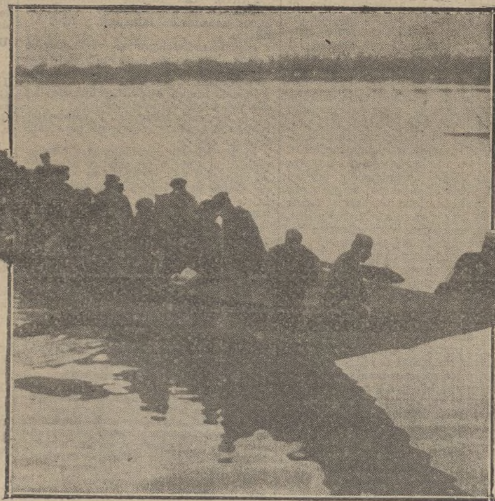
Tropas serbias fugitivas atravesando el lago de Scutari.

«Vemos en la Prensa cálculos muy ambiciosos respecto al número de hombres que Rusia podrá poner en filas en la primavera. No conviene exagerar ni esperar que los rusos ganarán la campaña para nosotros, de ningún modo por lo menos en 1916. Rusia ha sido atacada constantemente, ha sufrido pérdidas in-