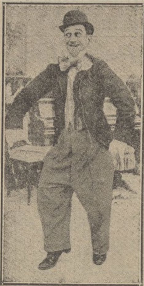
El popular TORIBIO, una de las figuras cinematográficas más celebradas.

Es preciso é imprescindible el que nuestros fabricantes se percaten de una vez para siempre de que para que su producción alcance el crédito industrial necesario para el abastecimiento de los mercados extranjeros, es condición precisa é ineludible el que su producción sea una sucesiva continuidad de metraje impresionado; limitar su fabricación a 1.000 ó