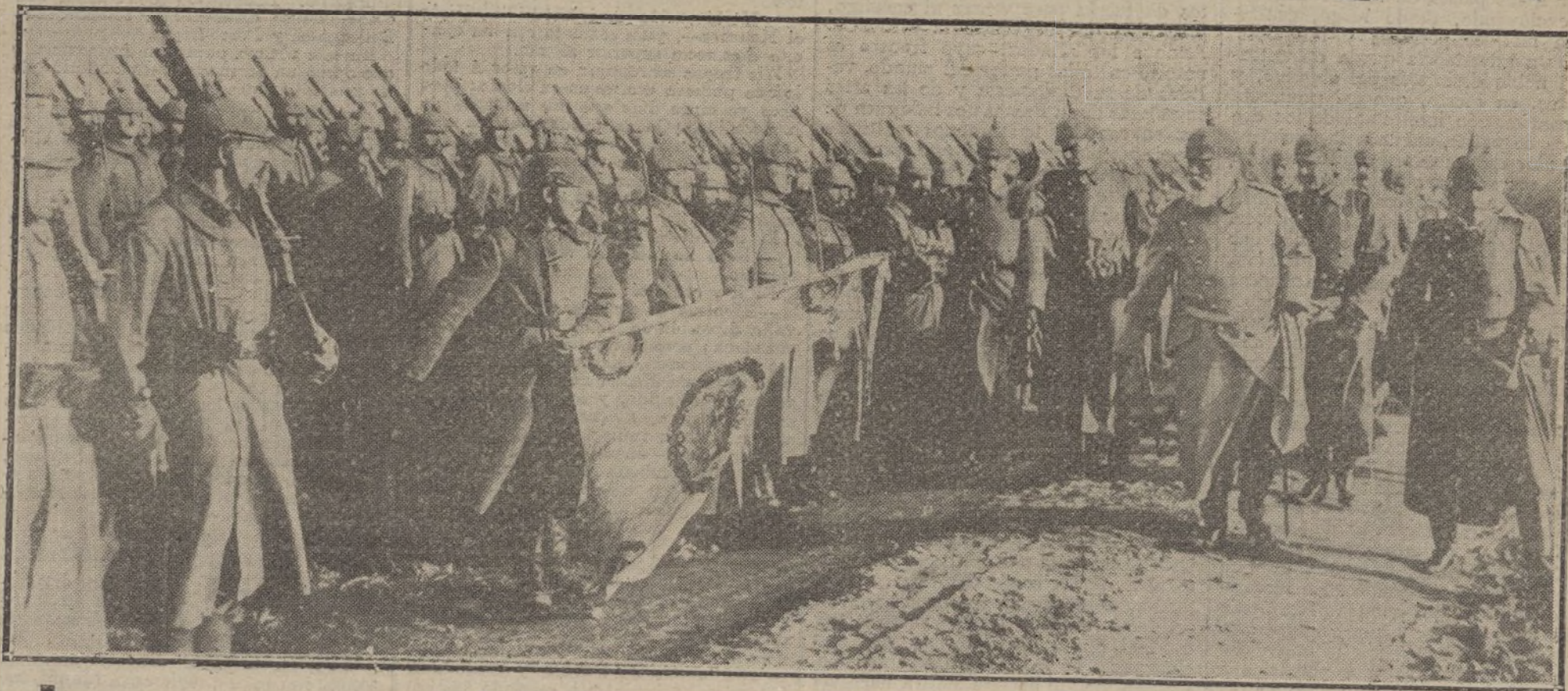
El Rey Luis de Baviera pasando revista á sus tropas.