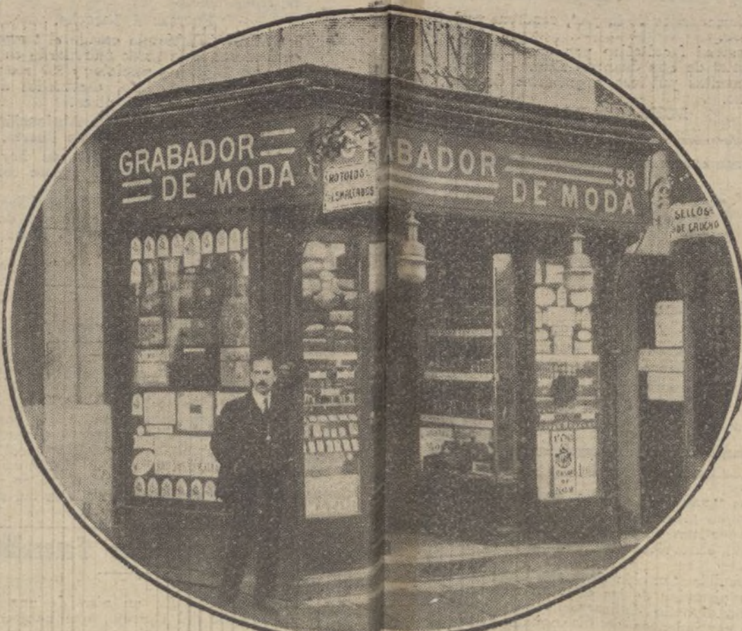
Vista del establecimiento, Montera, 38.