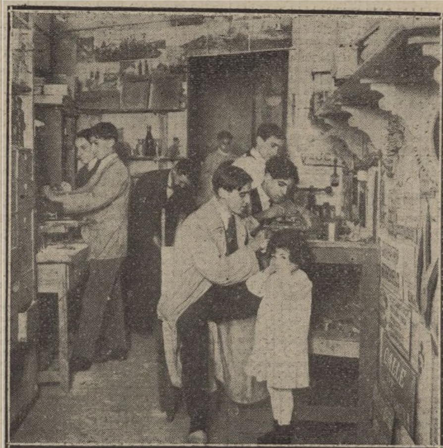
Taller de grabado y sellos de caucho.

pato, bórax, salitre y óxido de cinc. Con este esmalte se cubren los objetos