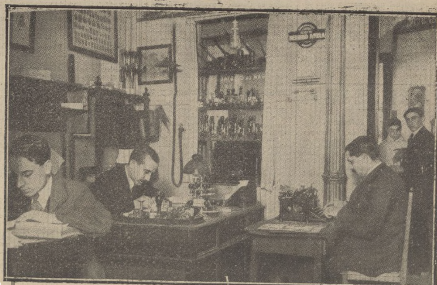
Detalles del escritorio.