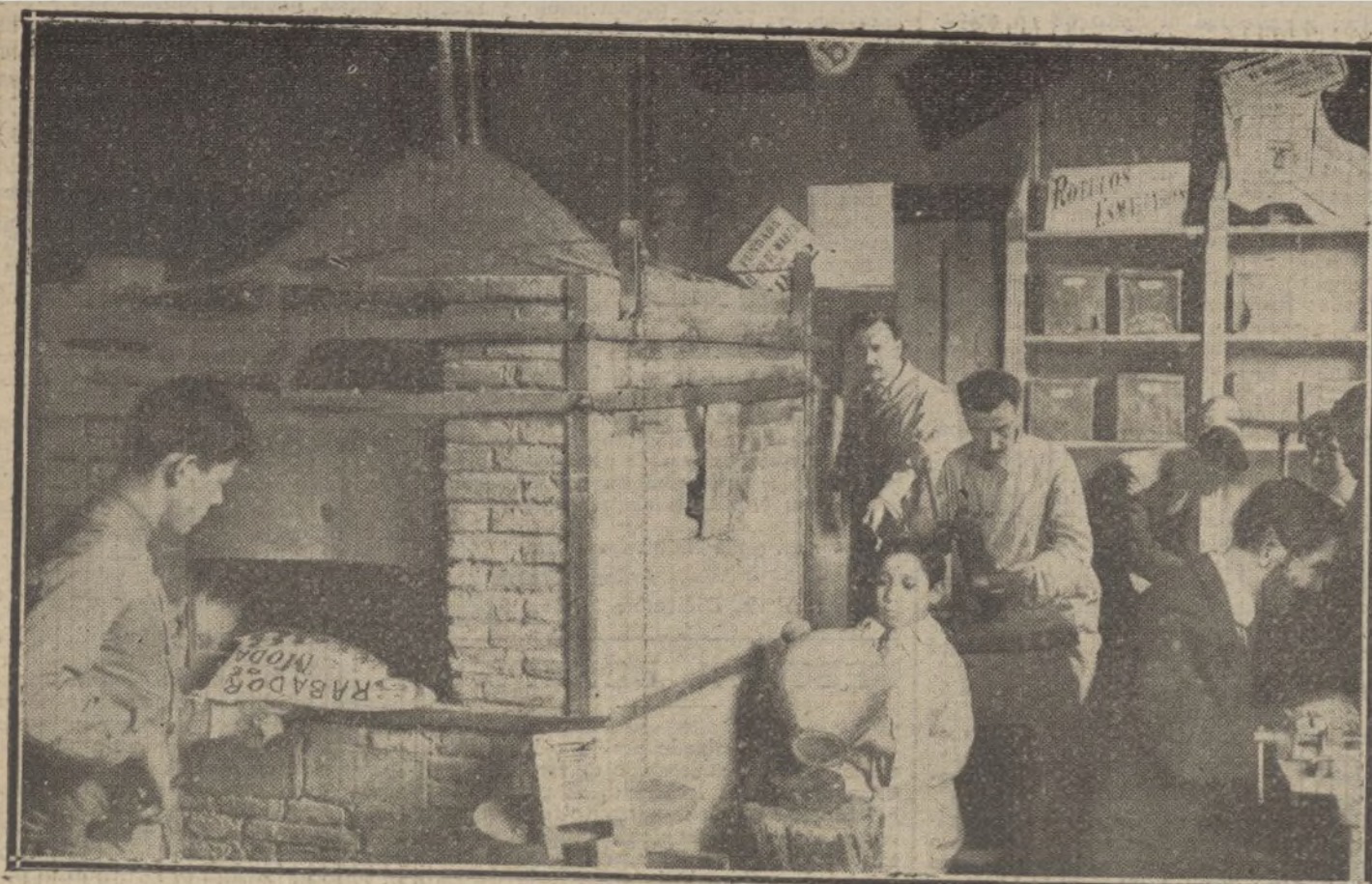
Vista de los talleres de esmaltado.