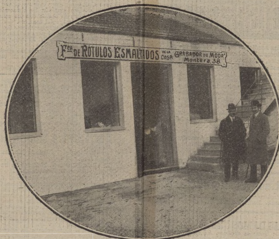
Vista de la fábrica, situada en la calle de Fuencarral, 145.