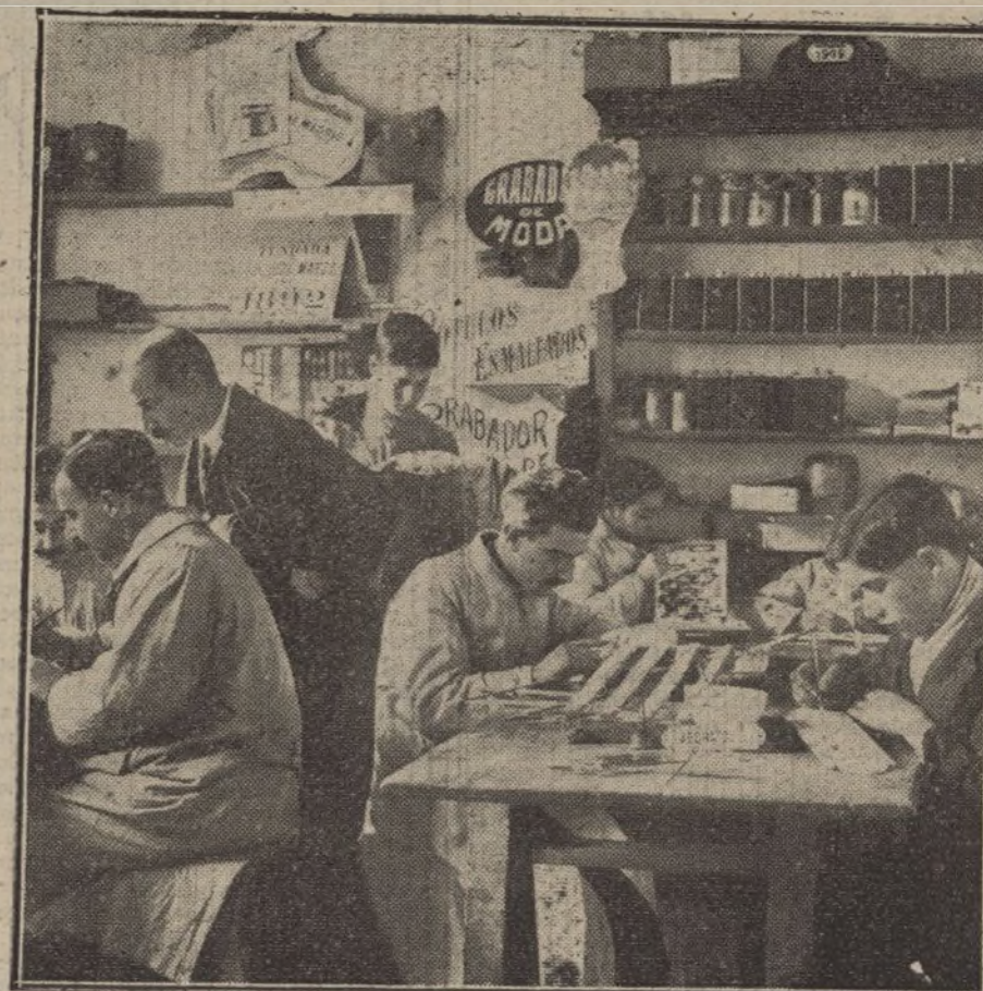
Vista de los talleres de dibujo y retoque.

piezas de todas clases. Lo más generalizado ha sido siempre las planas para puertas, anuncios, numeraciones, etcétera, y es muy usado el esmalte de hierro en las vasijas de cocina, donde da un excelente resultado.