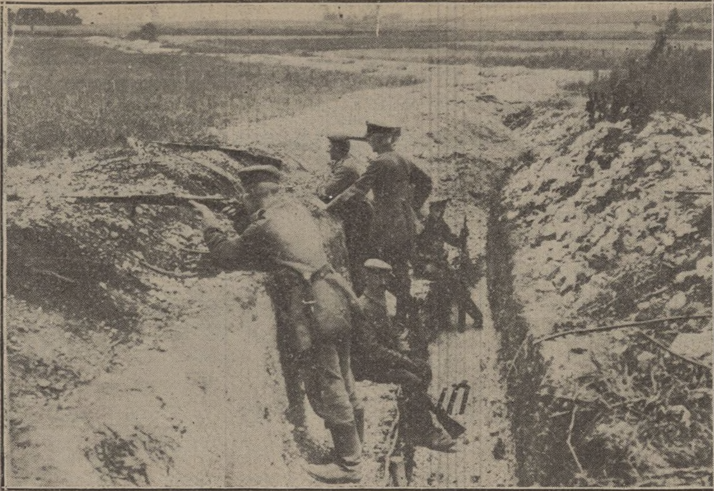
Soldados alemanes en una trinchera del frente ruso.