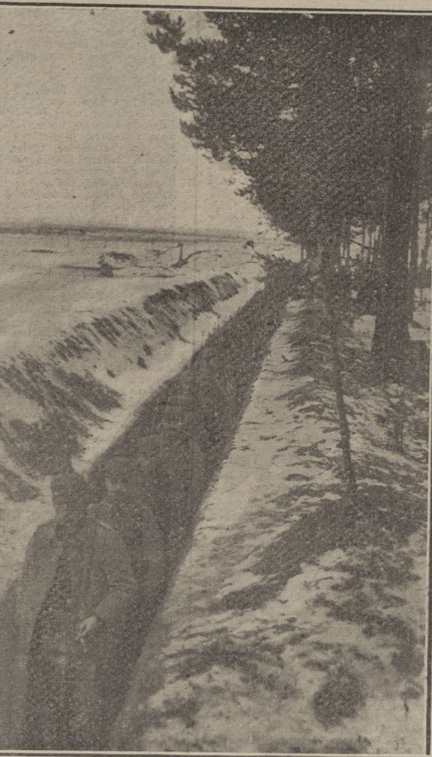
LA GUERRA EN ORIENTE.—Infantería alemana marchando por una trinchera hacia el frente de combate.