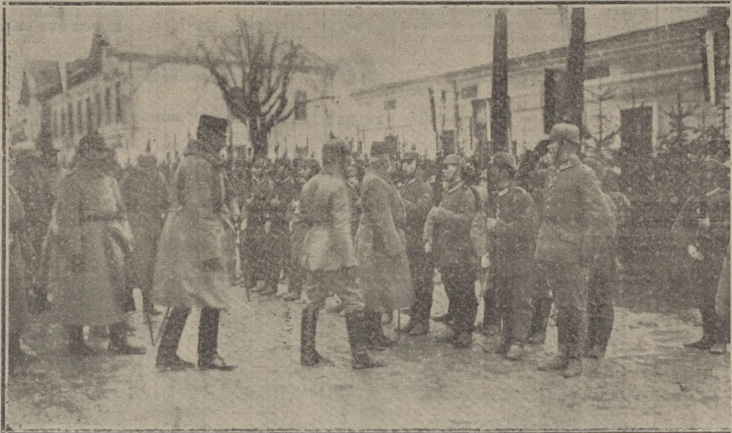
El Archiduque Federico conversando con un soldado alemán.

LA ENTENTE Y LOS ITALIANOS.—EL CONGRESO NACIONAL SOCIALISTA ITALIANO.—LA LUCHA EN EL FRENTÉ BALKANICO.—COMO JUZGAN LOS PERIODICOS FRANCESES LA SITUACION.—EL SERVICIO OBLIGATORIO EN INGLATERRA.—EL BLOQUEO DE LOS IMPERIOS CENTRALES