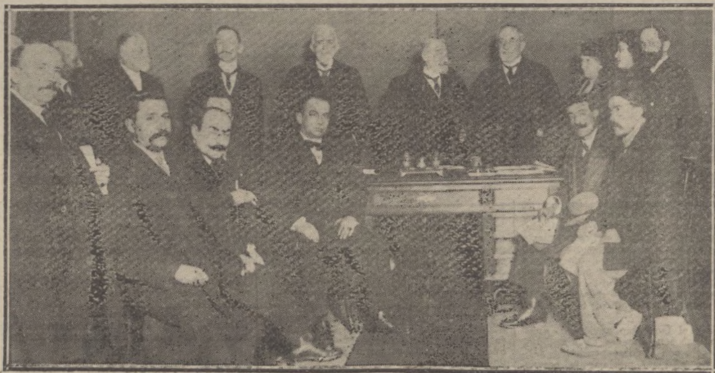
Reparto de premios en el Instituto de Reformas Sociales, acto verificado ayer, bajo la presidencia del ministro de Fomento, y con asistencia de los señores general Marvá, Azcárate y vizconde de Eza.

Los rusos continúan con gran encarnizamiento su ofensiva. Varios ejércitos se hallan concentrados en un espacio relativamente reducido. Los asaltos continúan sin interrupción; los combates delante de Cernowitz llegan a una violencia extremada.—Chovil.