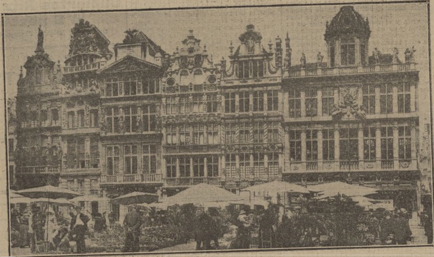
Un aspecto de la histórica plaza de Bruselas, donde se alza el Palacio del Rey y otros edificios de la época de la dominación española.