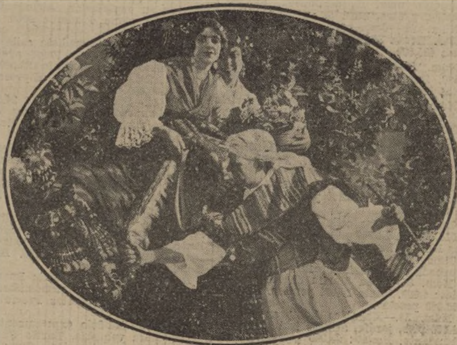
Cuadro de Emilio Ferrer, que ha figurado en la Exposición permanente del Círculo de Bellas Artes.

El año artístico ha comenzado con auspicios inmejorables. En lo que va de mes se han celebrado numerosas Exposiciones de Pintura, que si no han sido comentadas con la extensión que merecían, cúlpanse á exigencias del breve espacio de que disponemos, y no á falta de interés de las mismas.