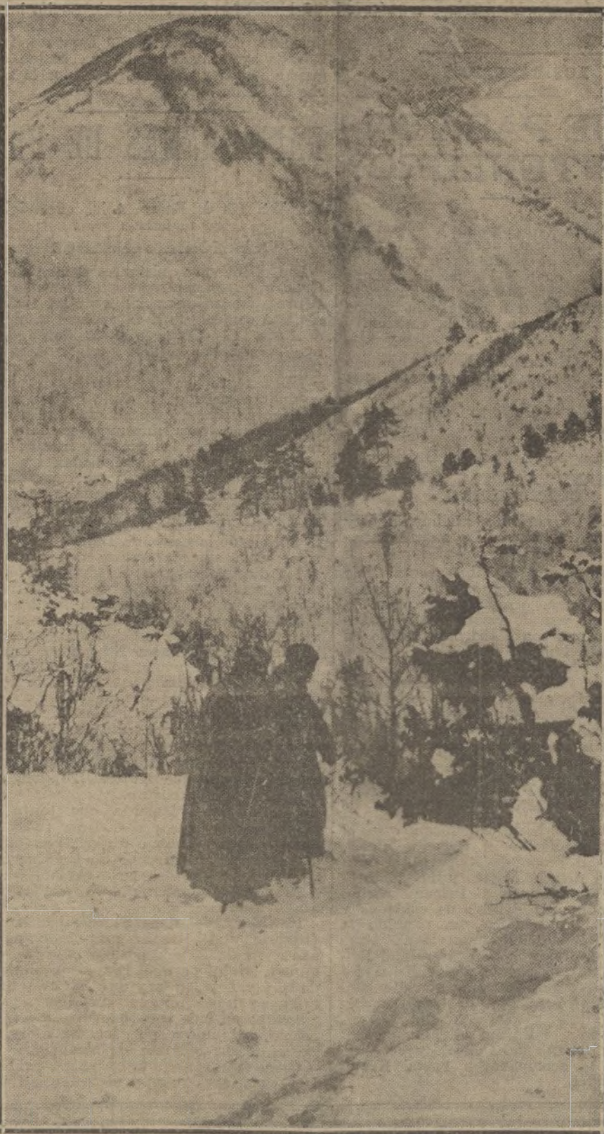
El anciano Rey de Servia acompañado de uno de los oficiales de su ejército, durante su marcha a Albania.

Entre Soissons y Reims, los cañones de trinchera franceses han hecho estallar un depósito de municiones.