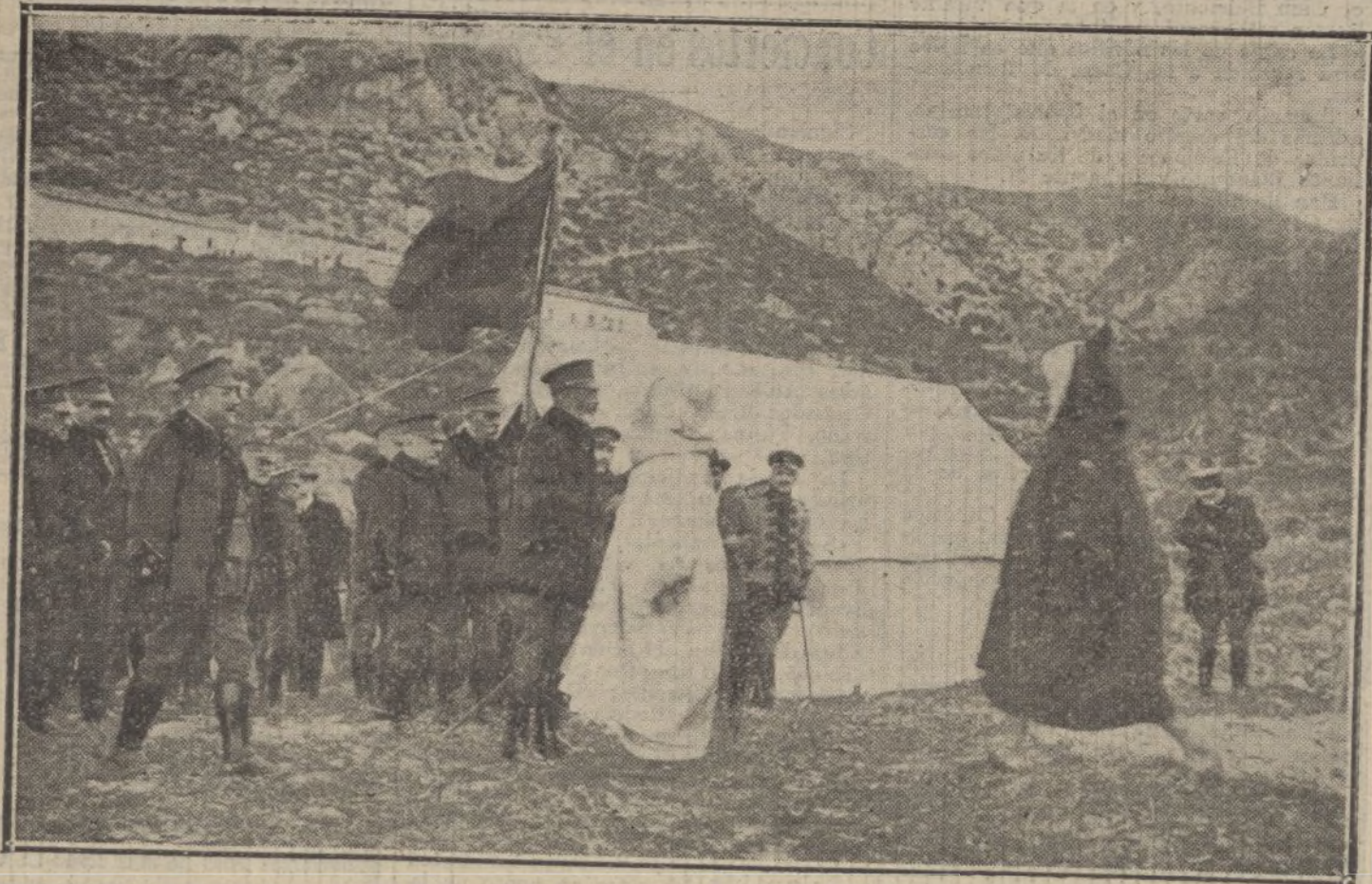
NUESTRA ACCION EN MARRUECOS.—Los jefes de las cabillas de Wad-el-Marza, Aun-Xir, El Jebel-Llunes, Harfa el Beinal y Del-Huidar, recientemente sometidas á España, haciendo su presentación ante las autoridades militares.