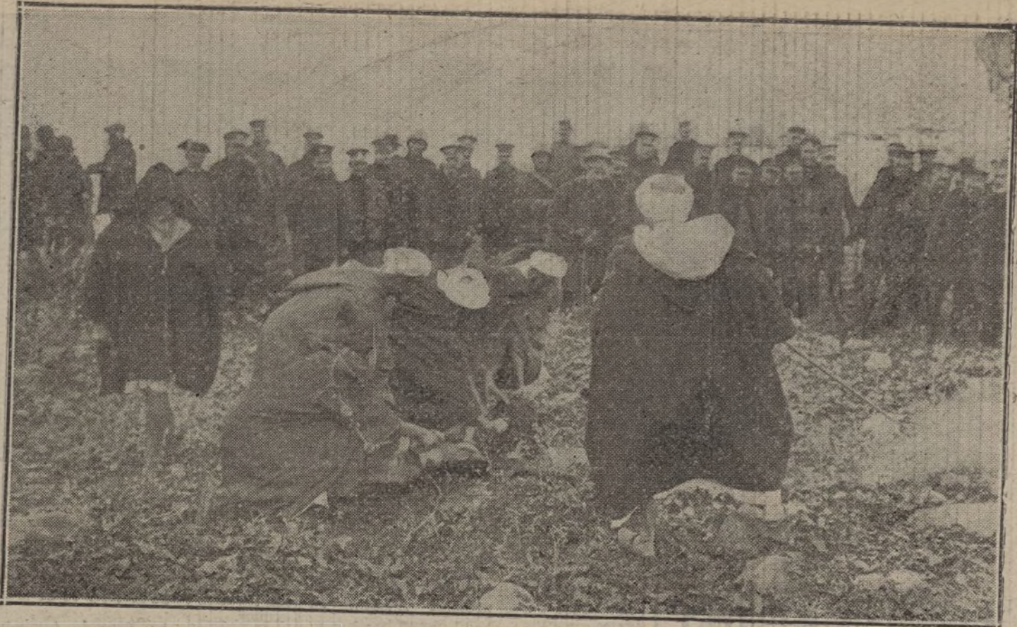
NUESTRA ACCION EN MARRUECOS.—Moros de las cabillas sometidas á España, sacrificando á las reses como acto de obediencia.

La tarea de devolver todos los trabajos que no publicamos sería abrumadora, y para evitarla, como para prevenir reclamaciones, que resultaría imposible atender, recordamos que no se devuelven los originales.