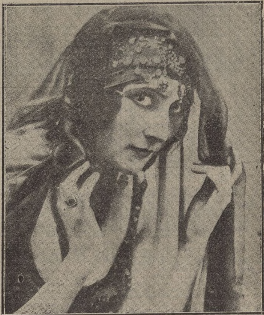
La notable actriz Mile. Napierkowska.

Lector amigo; perdona mi pereza, y no me guardes rencor por no explicarte la totalidad del drama, pues para ello fuera preciso manchar muchas cuartillas y disponer de humor, del que hoy carezco, a más de que con ello saldrás seguramente beneficiado, porque al ignorar el resto del drama, acaso te entre en ganas de presenciar su exhibición.