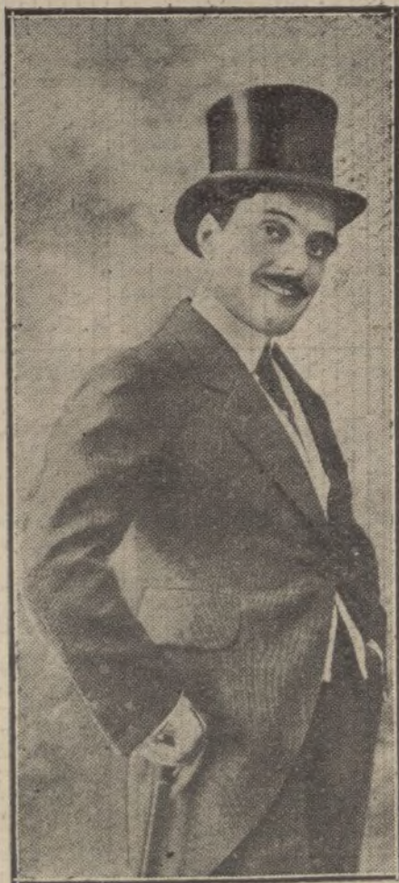
El famoso actor de cinematógrafo Max Linder.

«No os burléis; acaso mi corazón sea la mejor herencia del profesor Strahl»; añadiendo en seguida, casi profético: «Un solo corazón para las dos, puede ser trágico». Y termina el prólogo; y aún pareceme observar que entre los espectadores hay cansancio y sus miradas de aburrimiento.