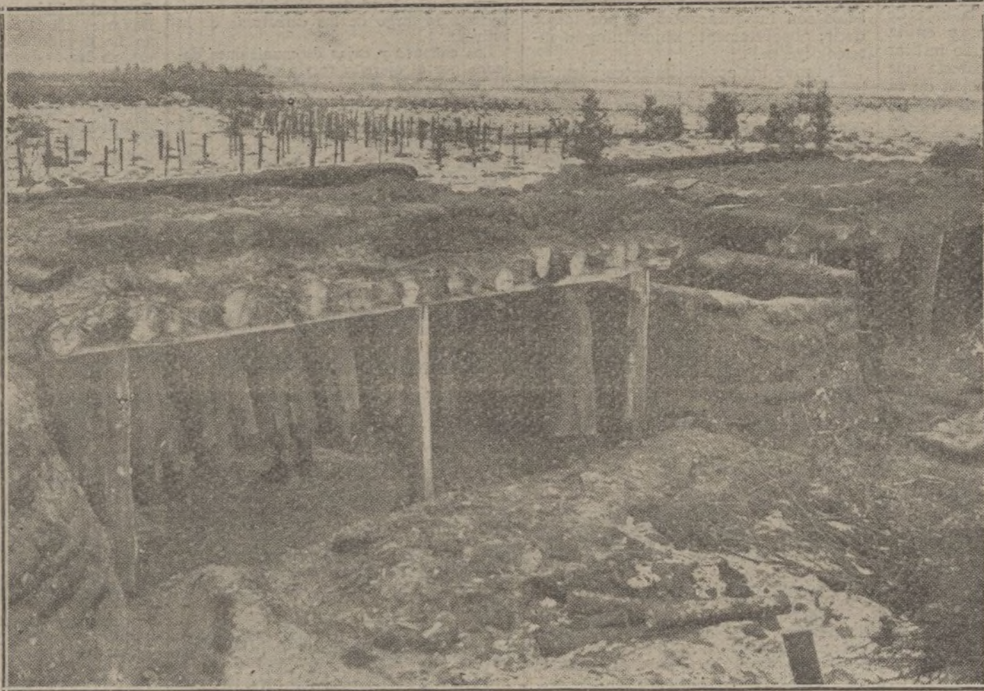
LA VIDA EN CAMPAÑA.—Una trinchera cubierta, montada por los soldados alemanes en terrenos pantanosos de Rusia.

de acción más que en el caso de que Francia, Inglaterra, Rusia é Italia se decidan por fin, después de diez y ocho meses de guerra, a fijar de modo preciso el conjunto de los medios que les deben procurar la victoria final. El estado de espíritu, cuya consecuencia era la falta absoluta de preparación, la cual, en Inglaterra sobre todo, había sobrepasado toda medida, debía tener como consecuencia una serie de empresas sin coordinación por parte de los diversos Gobiernos.