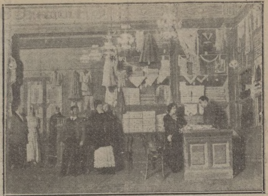
Una escena de «Hormiguita», obra estrenada ayer en el teatro Cervantes.

Cajas Registradoras "NATIONAL" Modelos ultramodernos CON GRANDES VENTAJAS SOBRE LOS ANTIGUOS MODELOS DE OCASION INFORMES GRATIS