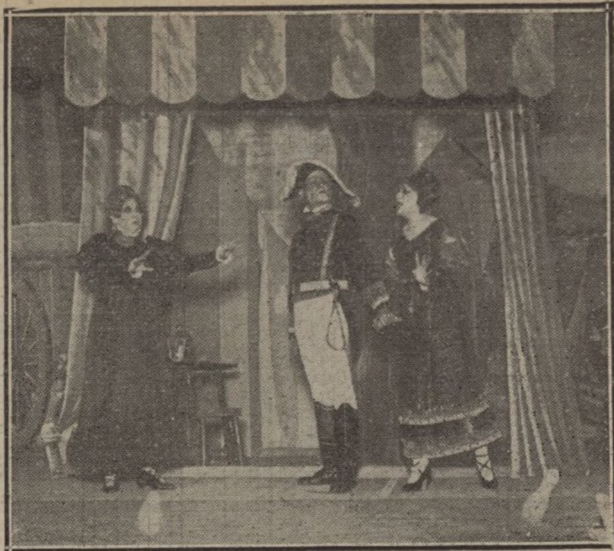
Una escena del tercer acto del melodrama «La reina gitana», estrenado anoche en Martín con éxito felicísimo.

NUMERO DEL TELEFONO DE LA ADMINISTRACION DE «LA TRIBUNA» (PLAZA DE CANALEJAS, 6): 5.551