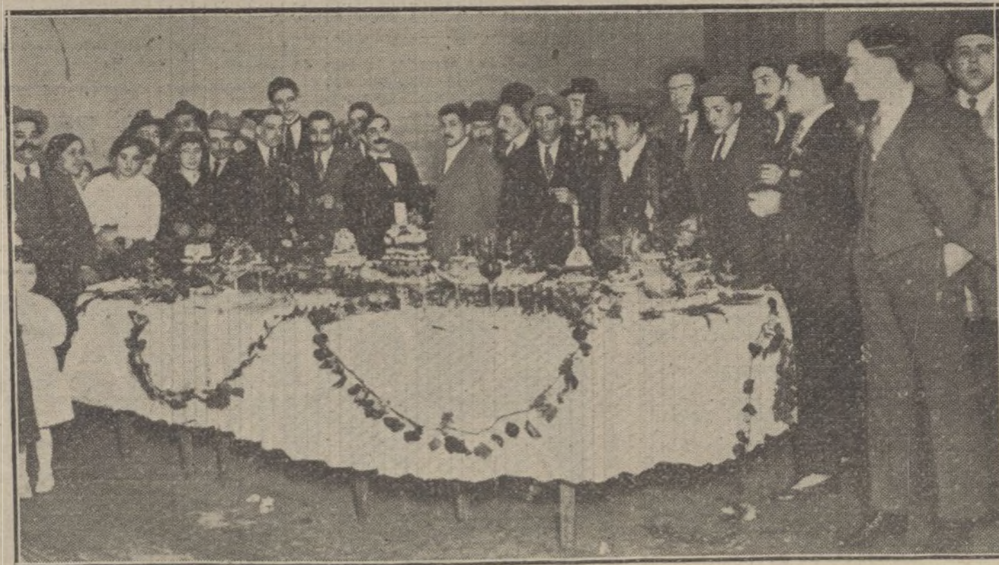
ERTAMEN CULINARIO EN BARCELONA.—Mesa que ha obtenido el primer premio en el concurso organizado por las Sociedades Artística de Cocineros y La Alianza de Camareros.