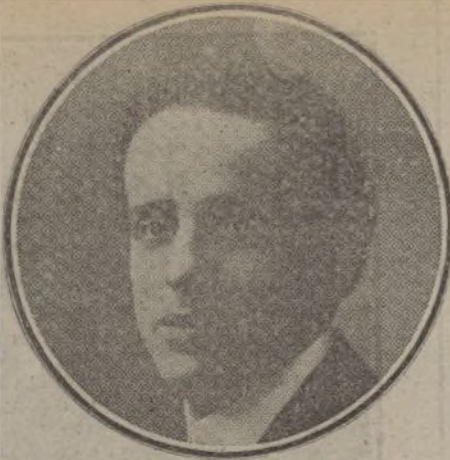
JUAN NADAL, notable tenor español, que ha cantado con gran éxito la ópera «Gioconda» en el teatro Real.