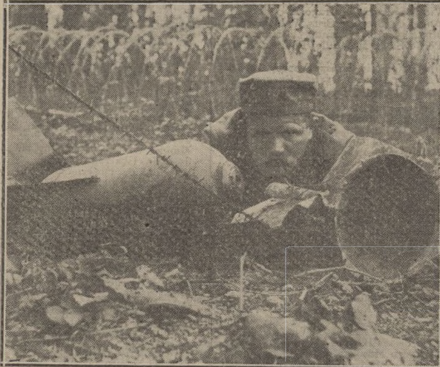
Centinela alemán junto á una mina.