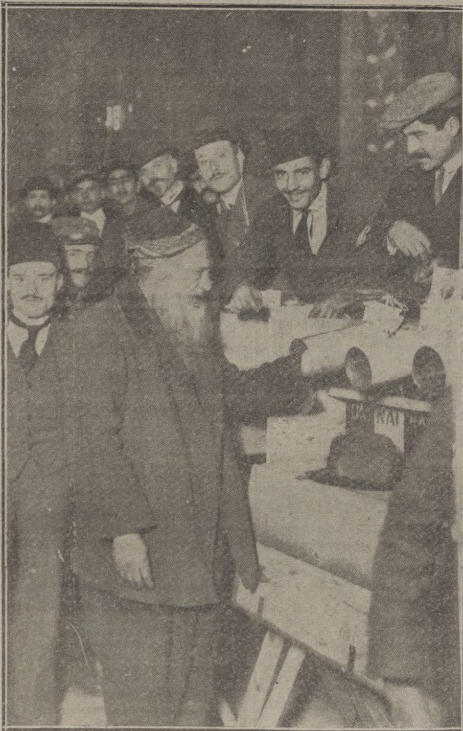
Curioso procedimiento empleado en Grecia para emitir el voto en las recientes elecciones generales.

En la altura de Combres la explosión de una mina francesa causó pocos daños a nuestras trincheras avanzadas, y el enemigo, que trató de ocupar el hoyo