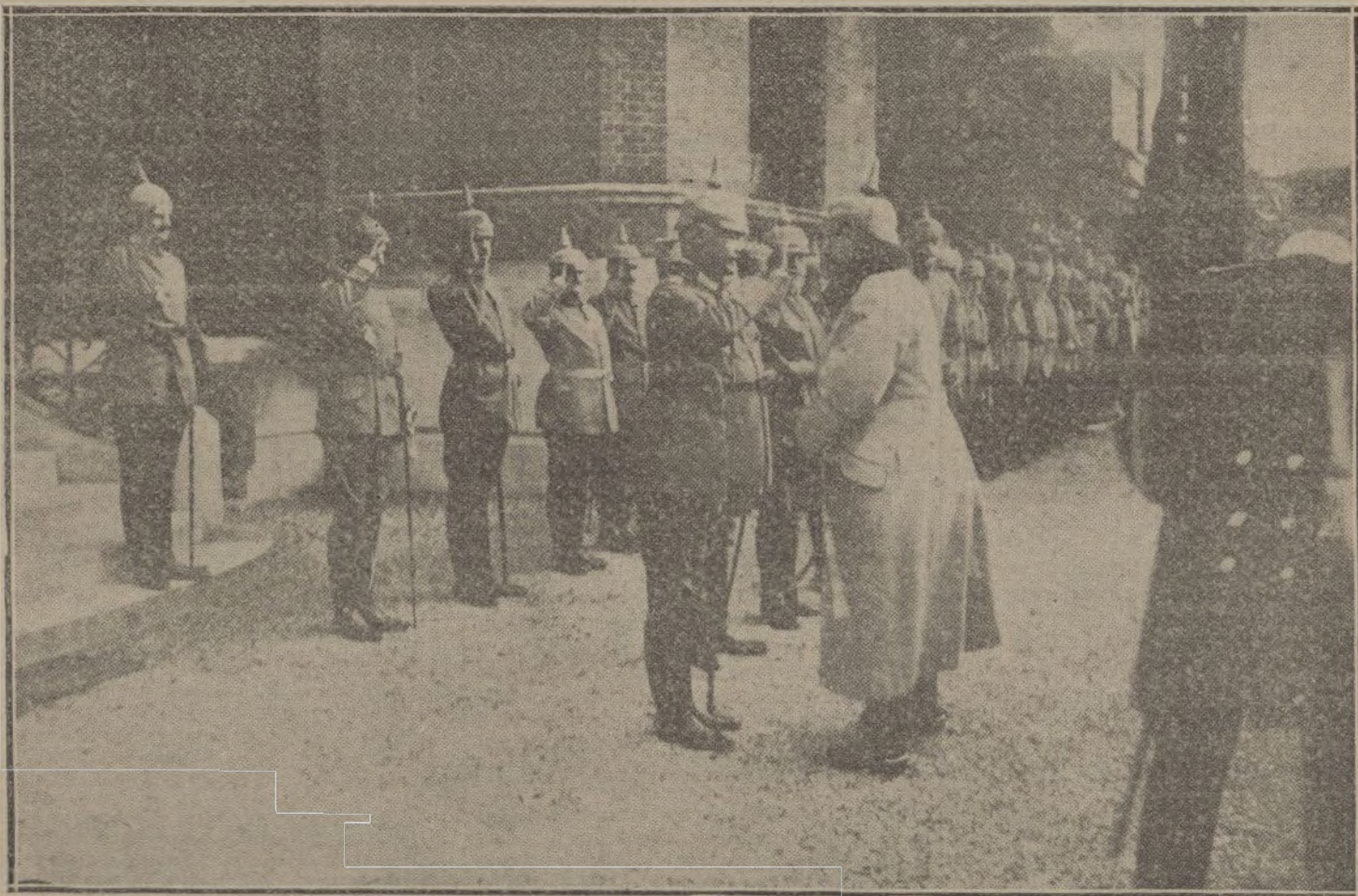
LOS SOBERANOS EN LA GUERRA. —El Kaiser conversando con el Príncipe heredero de Baviera durante una revista militar.

ville á la Folie, los franceses han hecho estallar una mina que ha causado grandes daños á las galerías alemanas.