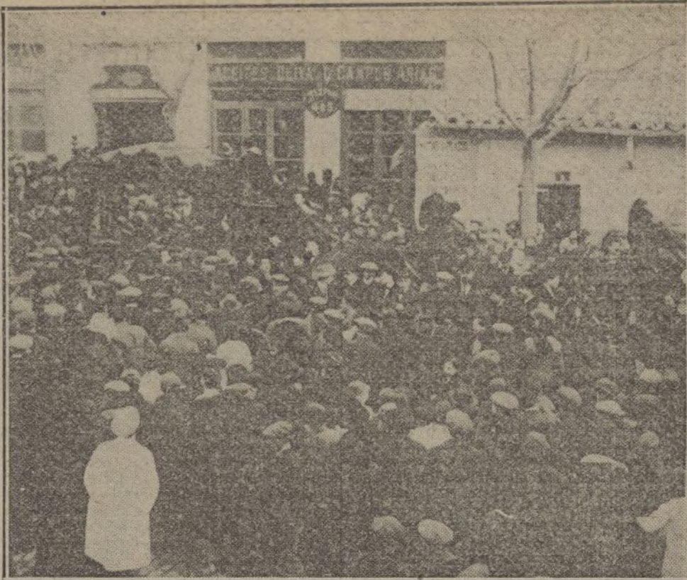
EL ENTIERRO DE «DON MODESTO».—El cortejo fúnebre al ponerse en marcha, frente á la casa mortuoria.

Presidentes honorarios: los excelentes señores D. Angel Bulido Fernández y conde de Santa Engracia; presidente