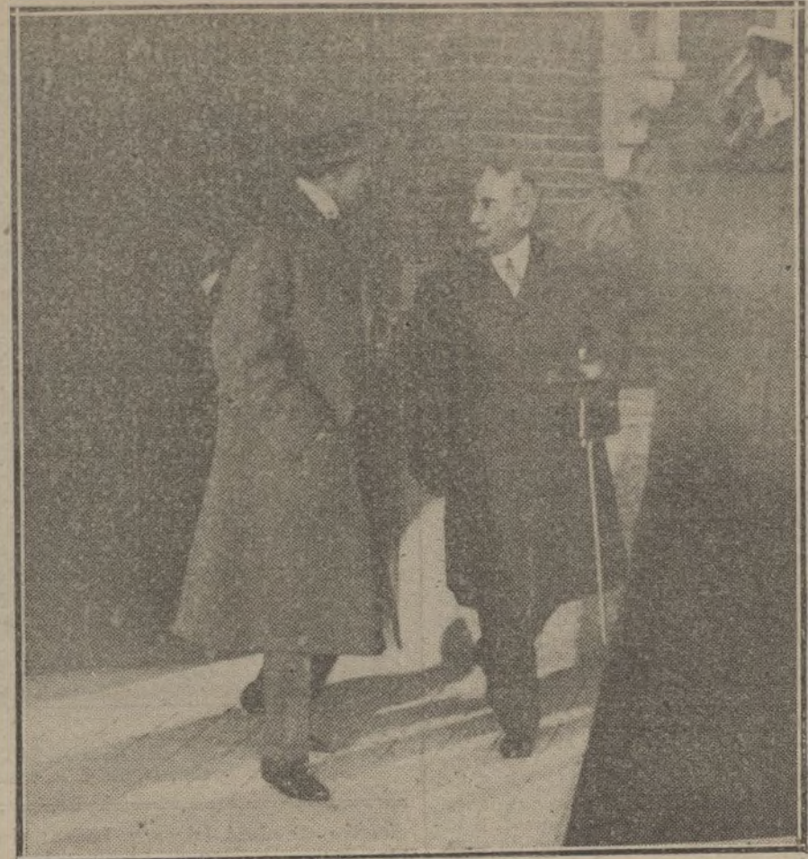
S. M. el Rey saliendo de la estación del Mediodía, á su regreso de la cacería de Láchar.