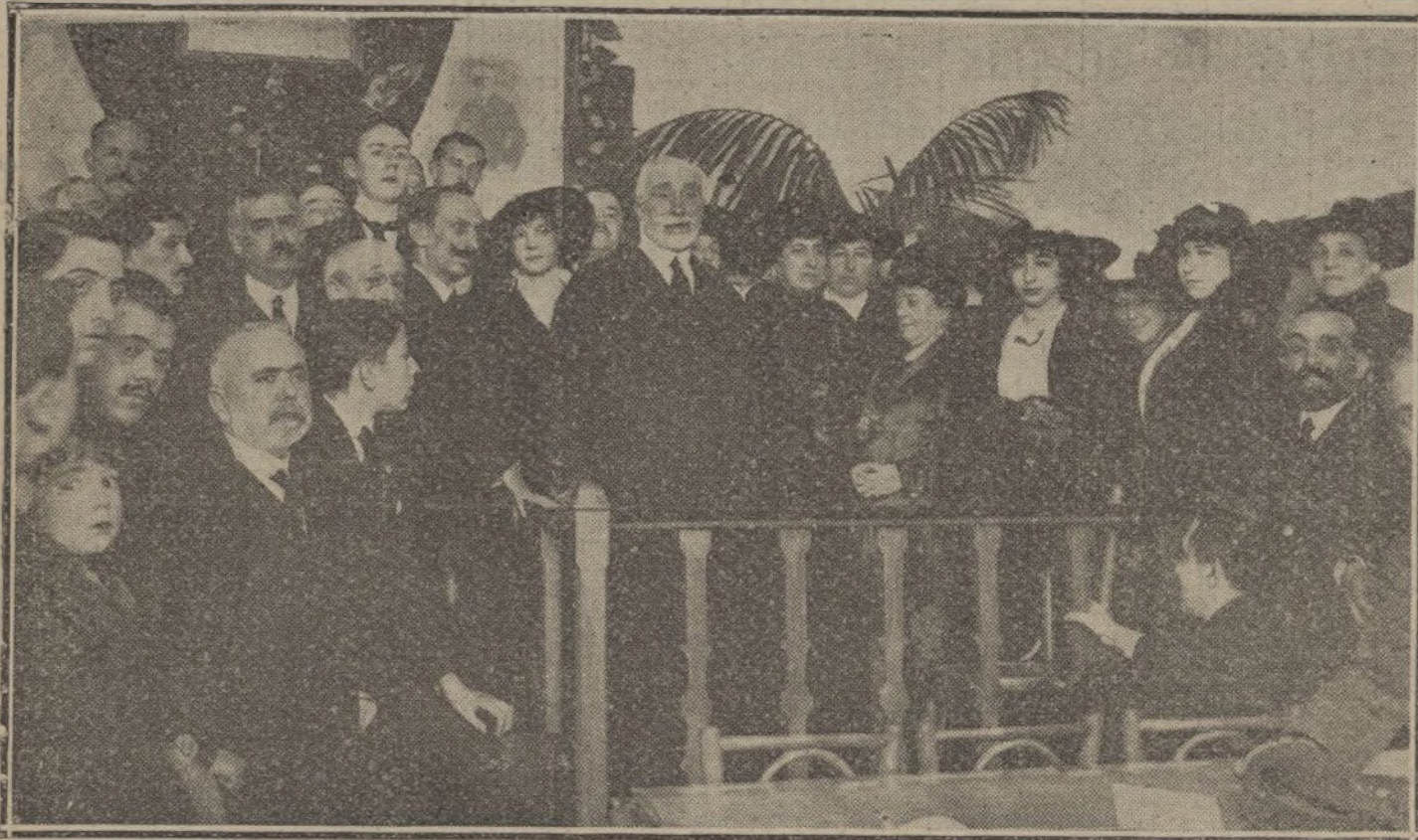
D. Antonio Maura rodeado de las damas que forman el Patronato de Escuelas del Centro Instructivo de la Latina, durante la sesión celebrada ayer tarde.

Ayer se verificó la Inauguración de las escuelas del Centro Instructivo Maurista de la Latina, acto que resultó brillantísimo y que realizaron con su presencia las damas que forman el Patronato de dichas escuelas.