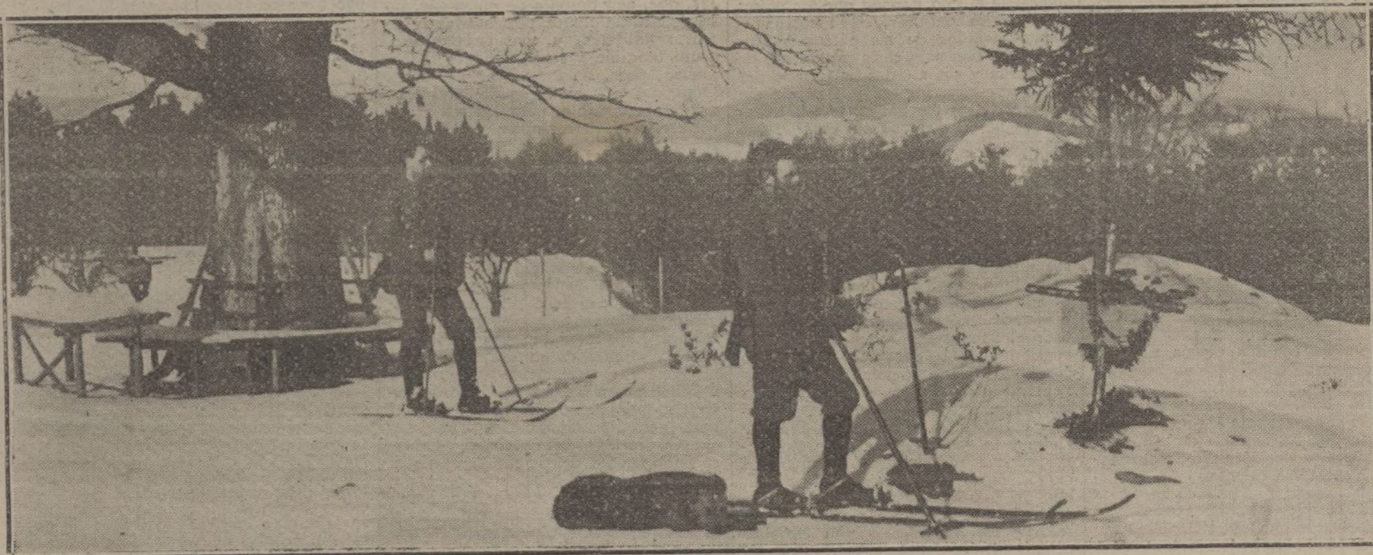
Paisaje nevado de los Vosgos con algunas tumbas de héroes de la guerra.