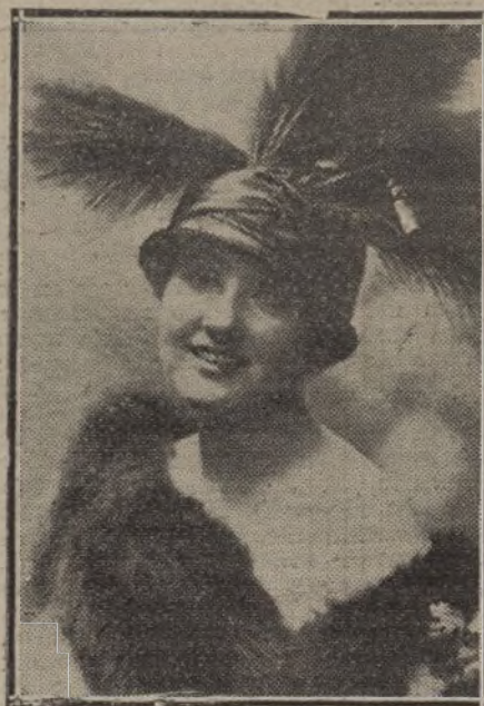
"HESPERIA", celebrada actriz cinematográfica.

dustriales con aristas, gusto, arte y disposición para responder dignamente.