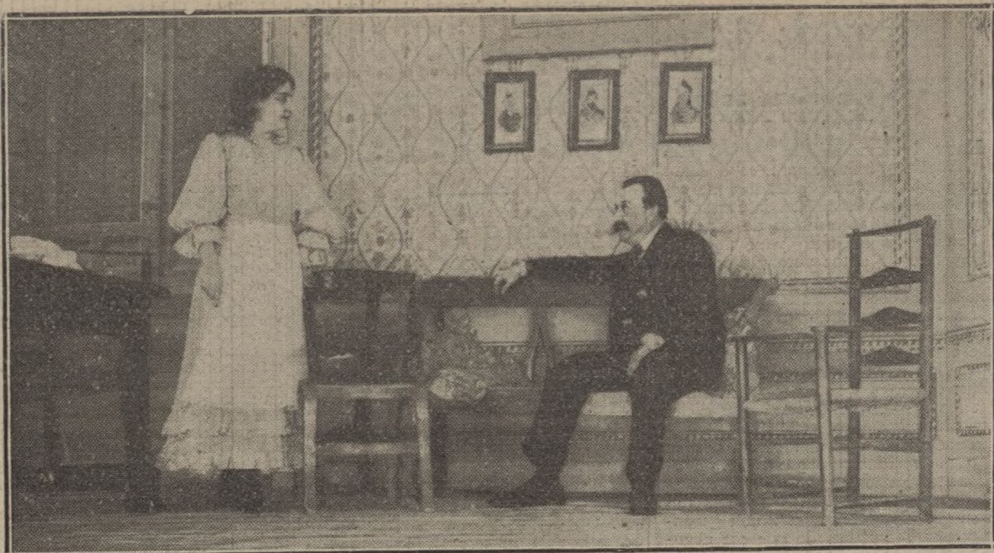
Una escena de la comedia de Galdós «El tacaño Salomón», estrenada anoche en el teatro de Lara.

actividad para remediar este mal, juzgamos urgente urgentísimo que sean perseguidos esos pordioseros astrosos, hampones profesionales, que se hallan hoy agazapados, por miedo á las órdenes transmitidas, en las guaridas que tienen en los alrededores de Madrid, donde funcionan con gran escándalo verdaderas sociedades de explotadores de los pequeños mártires de la mendicidad.