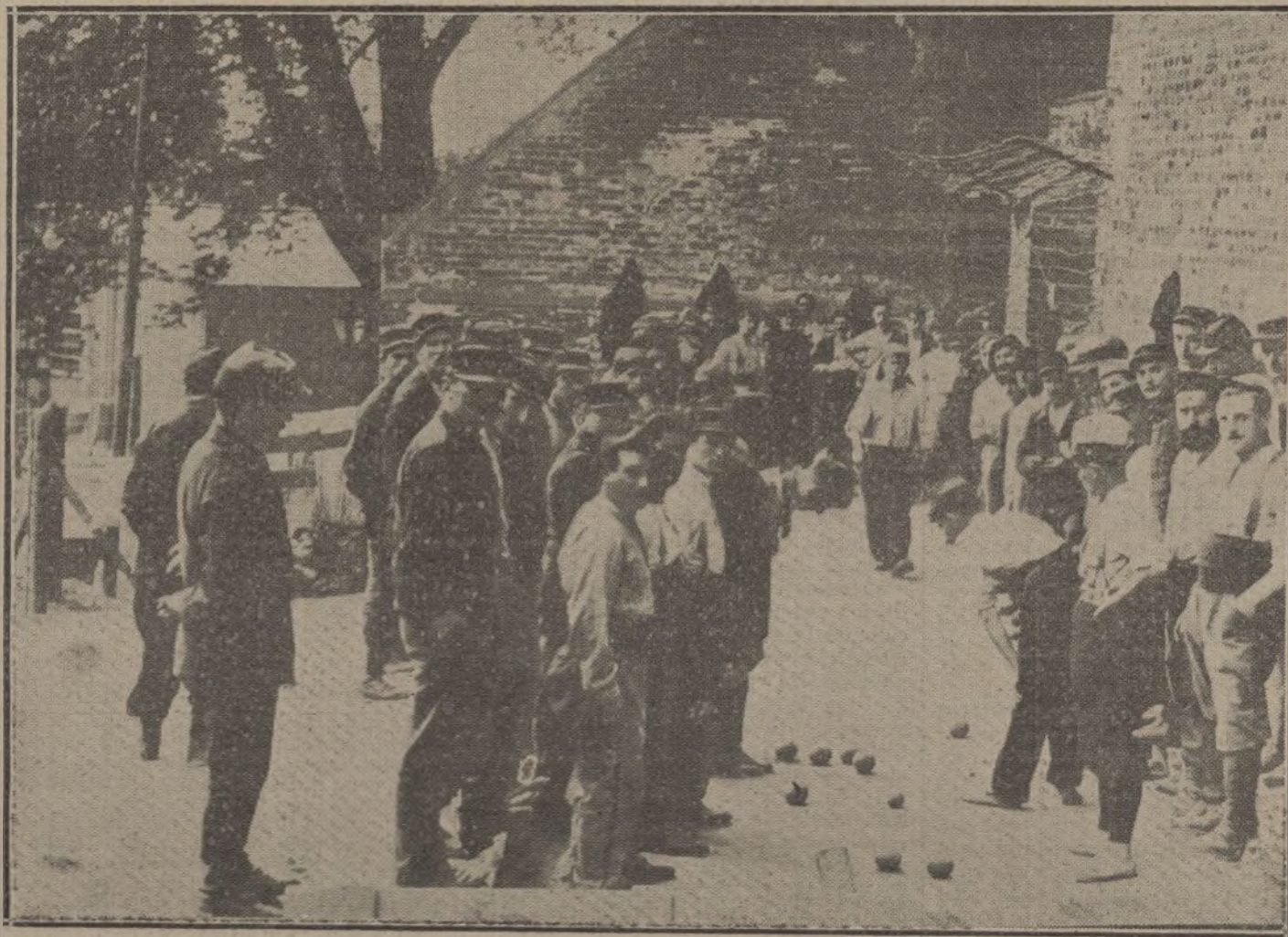
Soldados franceses en un campamento de prisioneros de Alemania, jugando á los bolos.