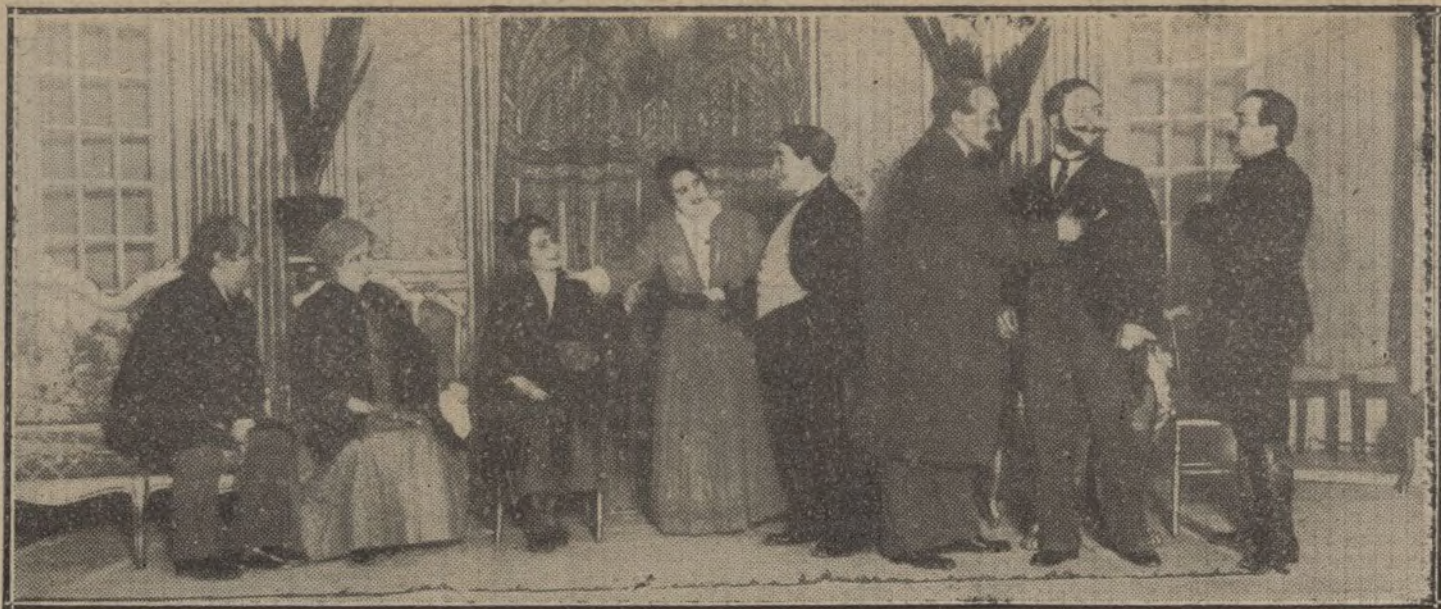
Una escena de «La novela de bolsillo», obra estrenada anoche en el teatro Cómico.

gro piensan venir a esta población, pues han pedido precio de los hoteles, y preguntado si existe en esta campo de «golf».