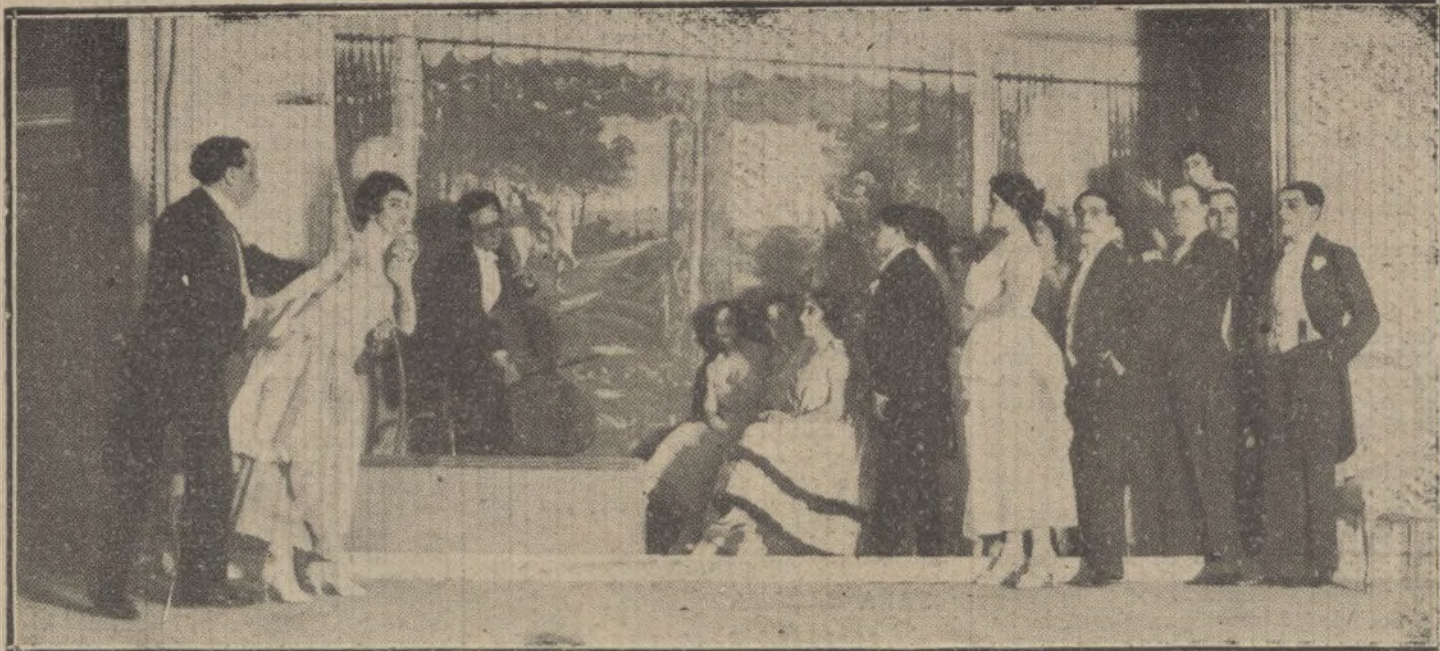
Una escena de «La mujer ideal», obra estrenada esta tarde en el teatro de Eslava.

Regresará dentro de pocos días, acompañado de su familia.