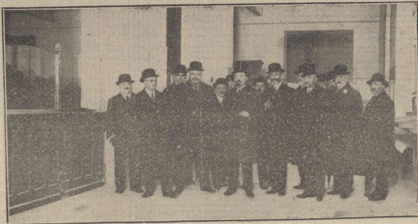
El ministro de la Gobernación y el director de Comunicaciones, durante la visita que giraron ayer á las oficinas del Ahorro Postal, instaladas en el nuevo edificio de Correos.

Al destaparse la cartera aparece una doble cubierta, con el escudo de España, y debajo una dedicatoria que dice: «La quinta región militar, á S. M. Don Alfonso XIII.»