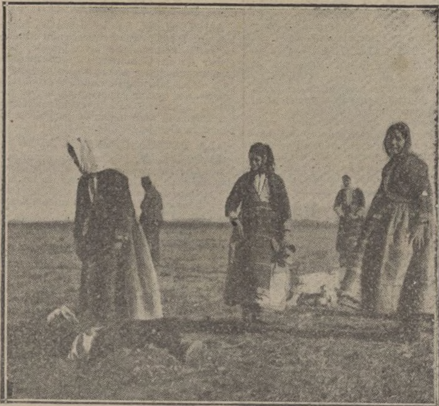
LAS PRIMERAS VICTIMAS EN SALONICA.—Mujeres del campo ante el cadáver de un griego, víctima de la lucha que en aquel territorio neutral sostienen los ejércitos aliados.

Durante la persecución nuestras tropas cogieron al enemigo muchos centenares de cabezas de ganado bovino.