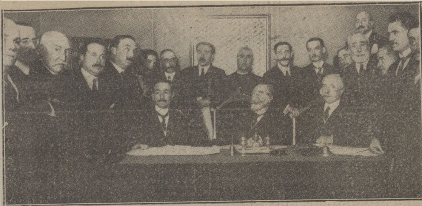
El ministro de Fomento y el vizconde de Eza, presidiendo el reparto de premios verificado ayer en la Sociedad de Agricultores de España.

La tarea de devolver todos los trabajos que no publicamos sería abrumadora, y para evitarla, como para prevenir reclamaciones, que resultaría imposible atender, recordamos que no se devuelven los originales.