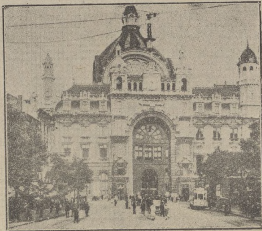
La estación central de Amberes.

Junto a la muerte se veía palpar la vida, en ese eterno y universal contraste en que discurre la existencia. Mientras las piedras del hogar caían abatidas por el hierro destructor y los cuerpos muertos eran enterrados, en los campos exhumaban los labradores el fruto de la vida que se formara en lento germinal bajo el cielo de fuego del combate. Los percherones hundían sus poderosos cascos en la mullida tierra de los bancales al tirar del arado, y del fondo del surco abierto salían los panes de tierra en los cuales parecían engastadas las patatas. Los labradores formaban montones de tubérculos siguiendo los abiertos surcos. Del campo llegaba hasta el tren el vaho áspero de