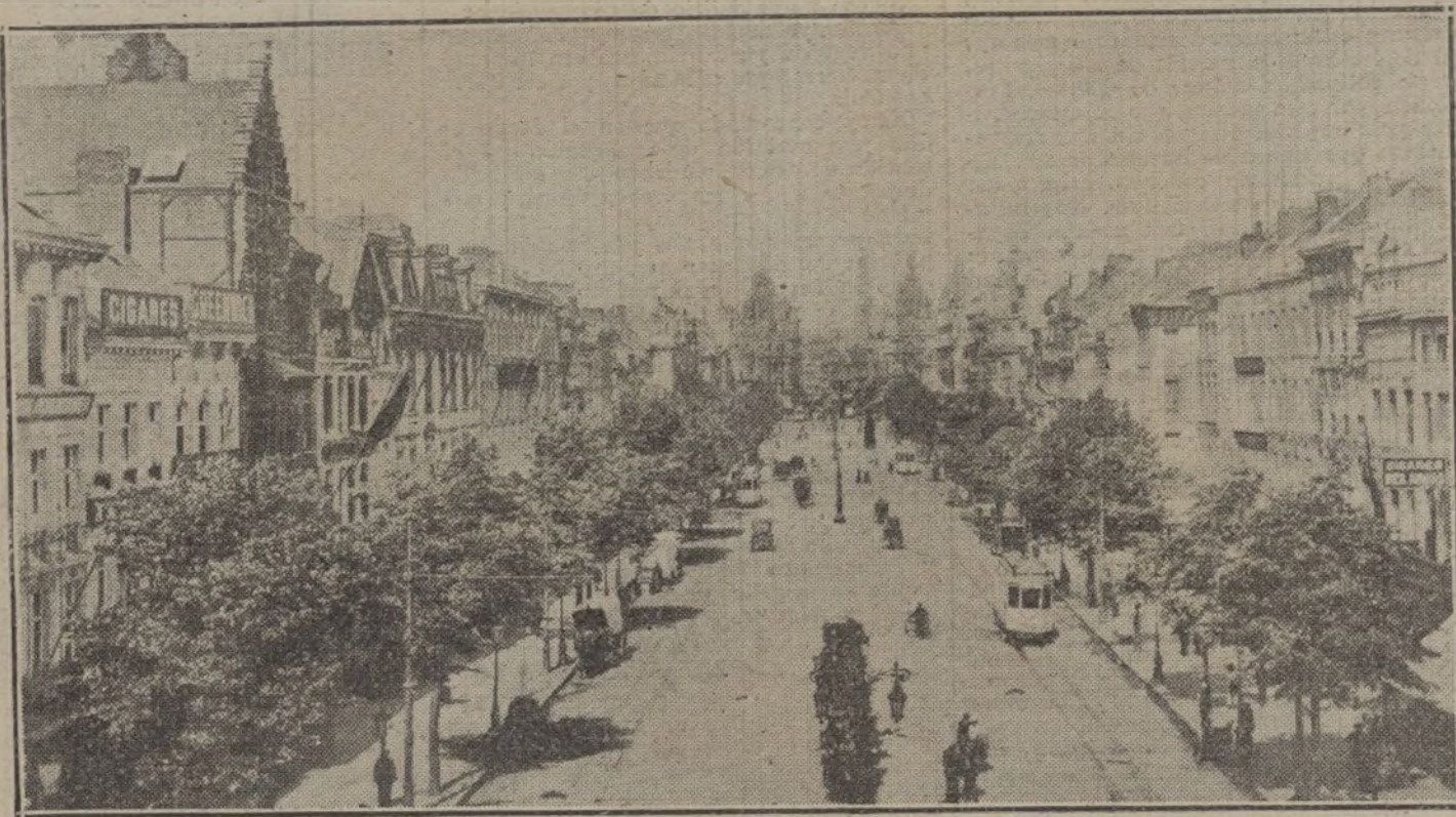
La gran avenida del Kaiser, en Amberes.