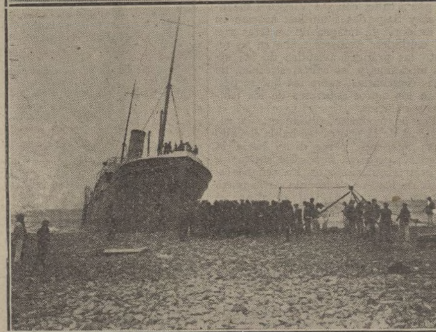
EL TEMPORAL EN CEUTA.—Estado en que ha quedado el cuartel de Infantería de la posición A, cuyo hundimiento a consecuencia de un ciclón ocasionó numerosas víctimas. Debajo, el vapor correo «Vicente Ferrer» embarrancado en la costa de Ceuta.

La Juventud Ciudadana se organiza activamente en todos los pueblos de la circunscripción, para emprender una vigorosa y entusiasta campaña de opinión, celebrando mítines y manifestaciones públicas y constituyendo grupos de resistencia, para evitar que las actas puedan hacerse en blanco, y con objeto de demostrar que para representar a la circunscripción de Almería en el Parlamento no basta contar sólo con la influencia oficial. El Comité llamado de Salud Pública, iniciador de la campaña contra el caciquismo conservador, se ha adherido a este movimiento, y ha iniciado una suscripción popular, cuyos productos se destinarán a sufragar los gastos que origina la propaganda. Esta se desarrollará activamente, secundando la acción los partidos a que pertenecen los citados candidatos.