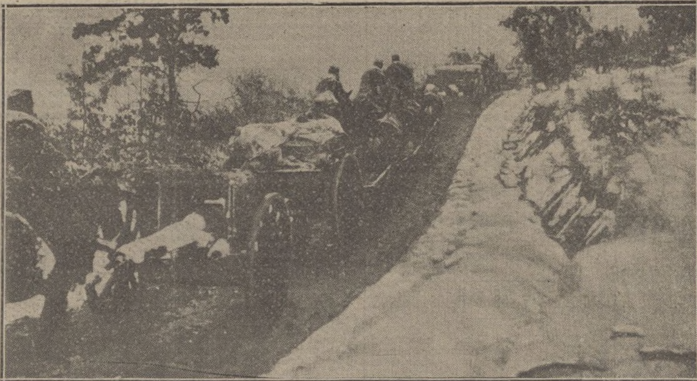
Un convoy montenegrino siguiendo a las tropas en su retirada.

«El teniente coronel y diputado monsieur Driant ha llamado la atención del ministro de la Guerra sobre el número creciente de casos de embriaguez observados en el frente, producidos por la venta ilimitada de vino en los acantonamientos. Así, por ejemplo, en un pequeño pueblo del Norte donde no viven más que 40 familias entraron desde el 10 al 24 de Enero 14.583 litros de vino; es decir, 720 litros por cada familia al mes. Ha habido, como consecuencia de estos abusos, casos de indisciplina y numerosos castigos. El 24 de Enero, y en este mismo pueblo, un soldado borracho mató de un disparo al médico militar, que se negaba a reconocerle por enfermo.