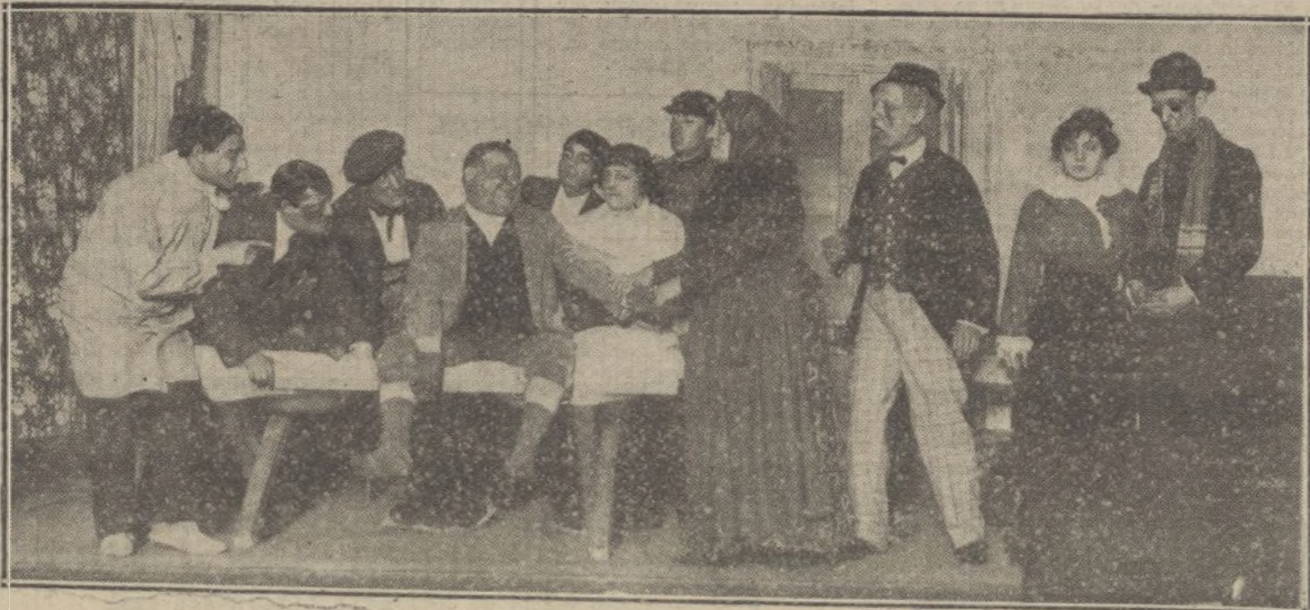
Una escena de «La Remolino», obra de los Sres. Muñoz Seca y García Álvarez, estrenada en el teatro Español.

El público, que invadía el espacioso paseo y calles inmediatas, quedó complacido de la fiesta, haciendo grandes elogios de sus organizadores.