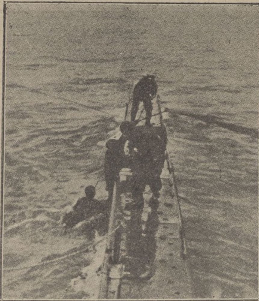
Tripulantes de un submarino recogiendo a los naufragos de un vapor hundido.

En el bosque de Le Prétre, el fuego de nuestra infantería derribó un avión enemigo, que cayó envuelto en llamas. Perecieron ambos tripulantes.