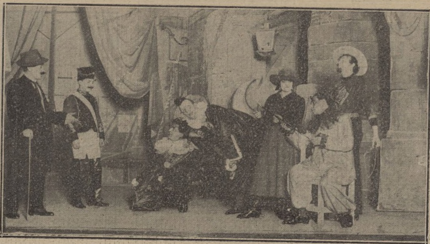
Una escena de «Toninadas», comedia de Linares Rivas, que se estrena esta noche en el teatro Español.

Y basta ya de filosofar sobre el cariño,