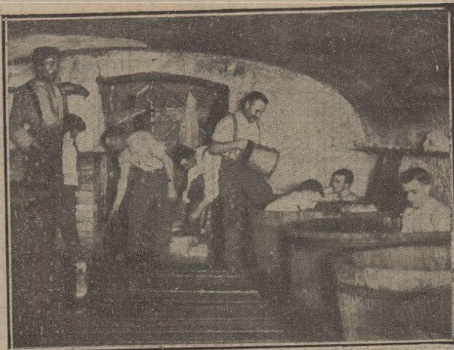
Una instalación de baños detrás del frente alemán, en el teatro ruso de operaciones.

Y como ese fracaso, que no pudieron ocultar todos los pregones ruidosos que lo divulgaron gran victoria, y que costó ríos de sangre para seguir clavados; como ese fracaso, los también notorios de la falta de socorro á Bélgica y de la escasa defensa y abandono de su más formidable plaza fuerte; del humillante chasco de los Dardanelos, el abortado plan de llegar á Constantinopla en una semana, de la misma barrera infranqueable de los Vosgos á la costa próxima á Inglaterra, desde la retirada habilitada