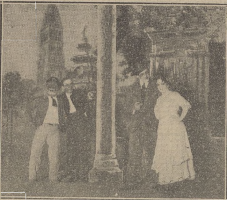
Una escena de «El patio de los naranjos», zarzuela de Pollicer y Fernández del Villar, música del maestro Luna, que se estrena esta noche en el teatro de Apolo.

PARA TODO LO REFERENTE A PUBLICIDAD FRANCESA EN «LA TRIBUNA», DIRIGIRSE A NUESTRA AGENCIA EN PARÍS: 22, RUE VIENNE, 22