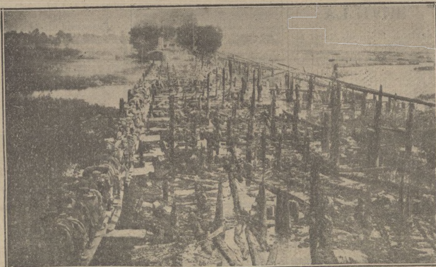
LA GUERRA EN ORIENTE.—Construcciones alemanas para facilitar el paso por los ríos y las regiones pantanosas de Rusia.

El Juzgado municipal de Almoradid procedió al levantamiento del cadáver.