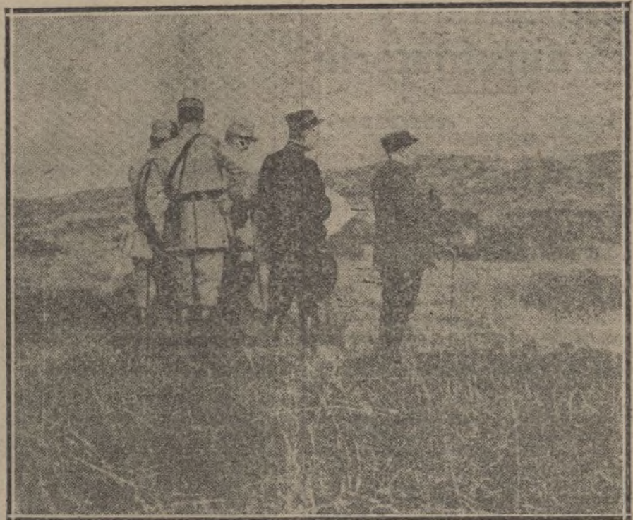
LA GUERRA EN LOS BALKANES.—El general Castelnaud, en un puesto de observación de Salónica.

Para todo lo referente a publicidad francesa en LA TRIBUNA, dirigirse a nuestra Agencia en París: 22, Rue. Vivienne, 22.