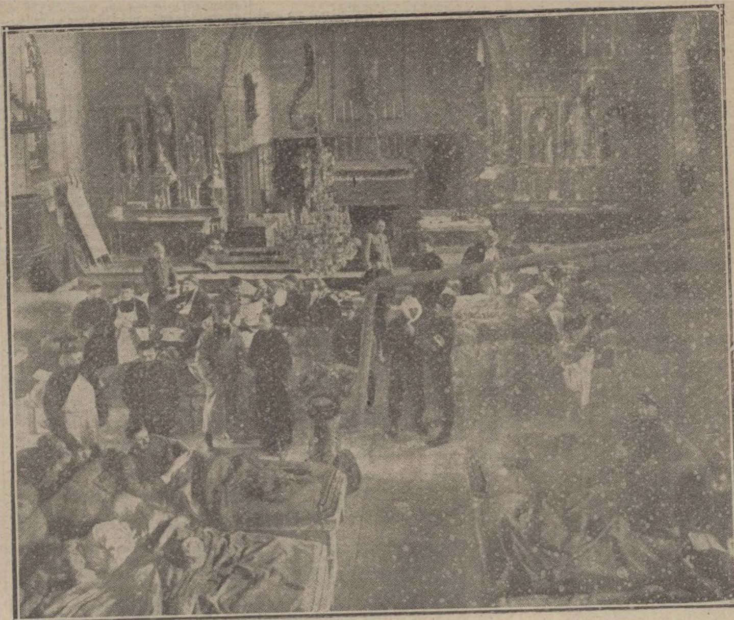
Iglesia transformada en hospital de sangre por las tropas francesas, cerca del frente de batalla.

de pueblos derruidos mediante cesión de madera, a precios módicos, procedentes de los montes del Estado, y en muchos casos de necesidad se entrega esta madera gratuitamente. Columnas de trabajadores reponen las carreteras, donde ganan sus sustentos.