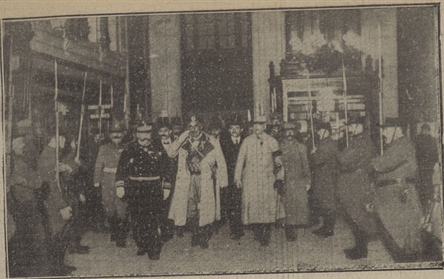
LOS REYES SIN REINO. —El Rey de Montenegro á su llegada á Lyon, acompañado del general D'Amade y el prefecto del Rhone.

todo. Desde mi mesa del comedor, instalado en la planta baja del hotel, veía las casas destruidas de la pared de enfrente. Todavía colgaba un letrero de un inuro con el nombre del establecimiento que allí hubo. «Fonda de Barcelona», leí.