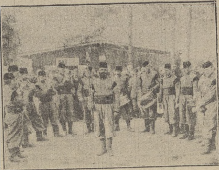
Prisioneros musulmanes en un campo de concentración de Berin.

NUMERO DEL TELEFONO DE LA REDACCION Y TALLERES DE «LA TRIBUNA» (JARDINES, 4, 6 Y 8): 4.444