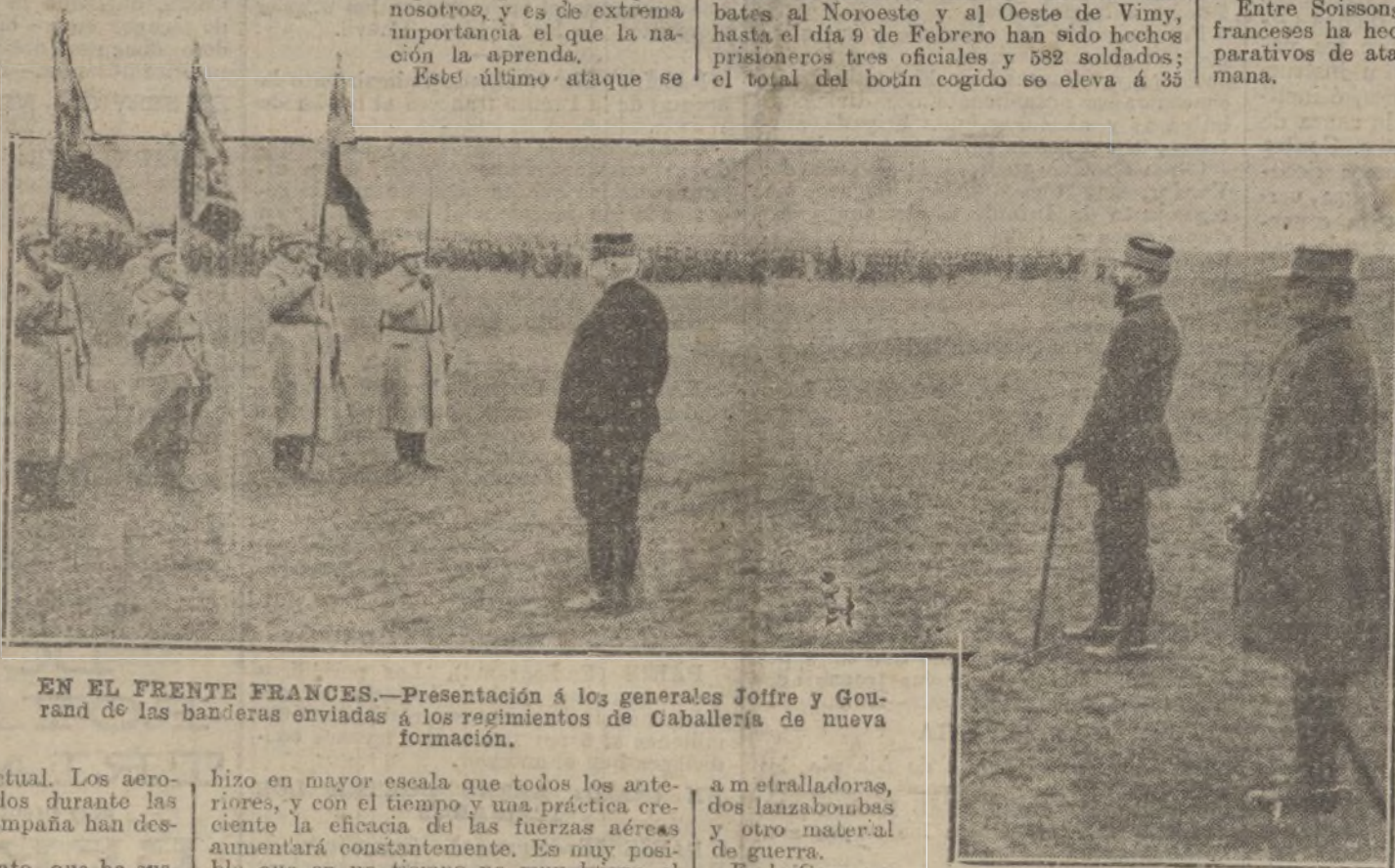
EN EL FRENTE FRANCÉS.—Presentación á los generales Joffre y Gou- rand de las banderas enviadas á los regimientos de Caballería de nueva formación.

En el frente del Cáucaso continúa con éxito nuestra ofensiva.