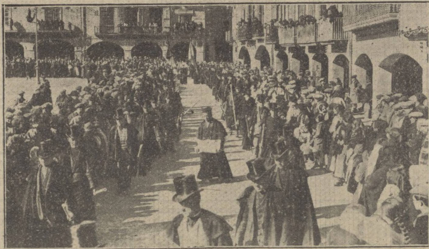
EL ENTIERRO DEL OBISPO DE VICH.—Grupo de seminaristas de Vich con sus típicas capas y sombrero de copa, en el entierro del obispo.