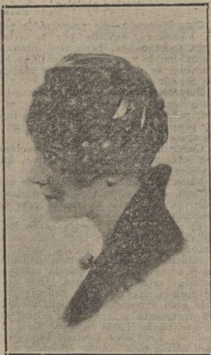
Sra. Cleo Madison, notable artista cinematográfica.