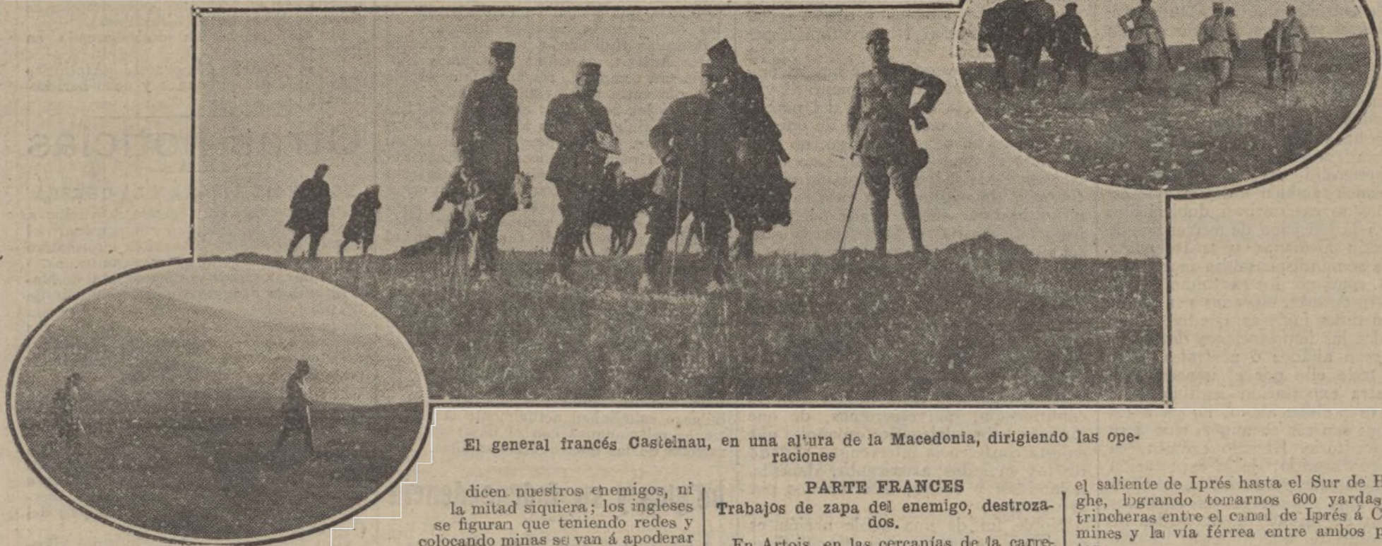
El general francés Castelnau, en una altura de la Macedonia, dirigiendo las operaciones

GRECIA Y LOS ALIADOS.—VENIZELLOS «RENUNCIA A LA MANO DE DOÑA LEONOR».—DICEN DOS BULGAROS ILUSTRES.—VAPORES INCENDIADOS. DINERO PARA LA GUERRA.—LA OFENSIVA EN GALITZIA.—EN EL MAR