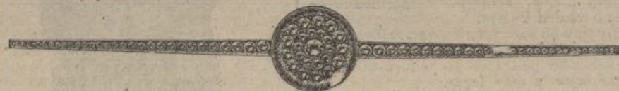
Núm. 38/3. Imperdible, brillantes, diamantes y rubíes ó zafiros, en oro de ley 18 quilates, ptas. 800.

GARANTIZAMOS EL VALOR CON FACTURA QUE SE ACOMPAÑA A CADA COMPRA