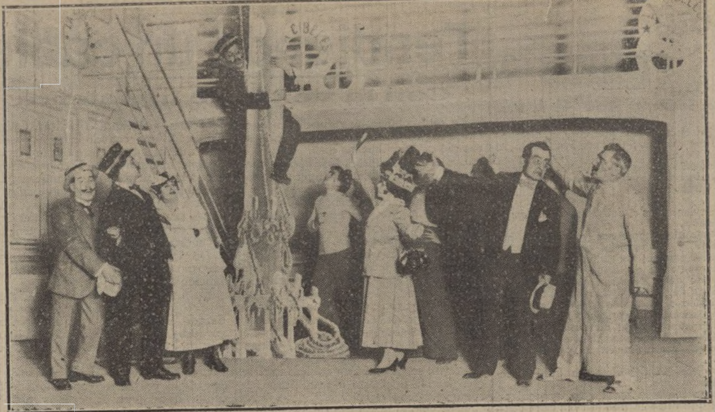
Una escena de «El valiente capitán», obra estrenada anoche en el teatro Cómico.

En los 22 paisajes que expone en el salón de Casa Vilches, hemos creído sorprender esa noble intención. Y en arte, saber ver las cosas, es ya una estimable predisposición a saberlas hacer. Por hoy, Winthuisen es un pintor opaco, al que falta estudiar mucho todavía, y perfeccionar su estilo hacia una independencia artística más completa. Pero no puede negarse tampoco que hay en él un deseo y una buena voluntad, que habrá de conducirle a la formación de un temperamento fuerte, si no se malogran esos propósitos que tan claramente descubrimos en sus cuadros de ahora.