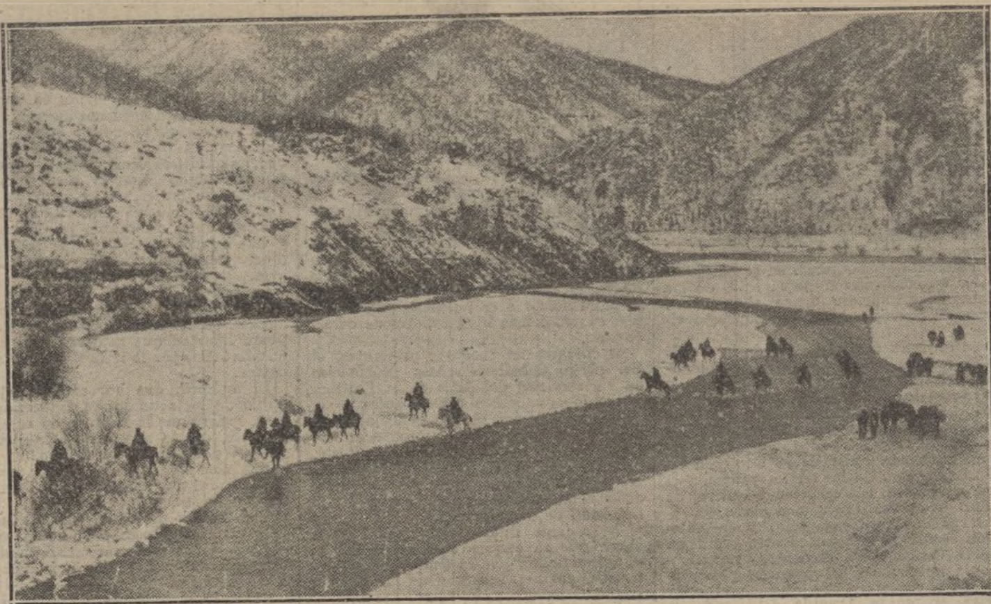
LA GUERRA EN LOS BALKANES.—Caballería servia fugitiva vadeando un río en la frontera albanesa.