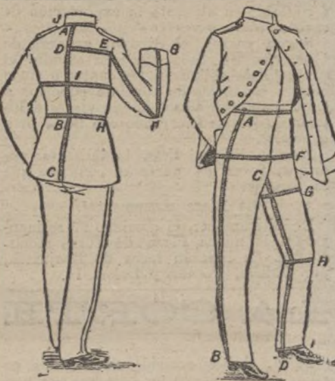
Método para tomar la medida.

Esta Casa pone a la disposición de sus clientes, y especialmente á los señores jefes y oficiales, clases é individuos de los beneméritos Cuerpos de la Guardia civil y Carabineros, á quienes se facilita el pago, cobrando por cargo, de seis á doce plazos mensuales, según la importancia del pedido, un inmenso surtido en estambres, melstons, elasticotines de todas clases y precios, así como paños de las primeras casas de Béjar.