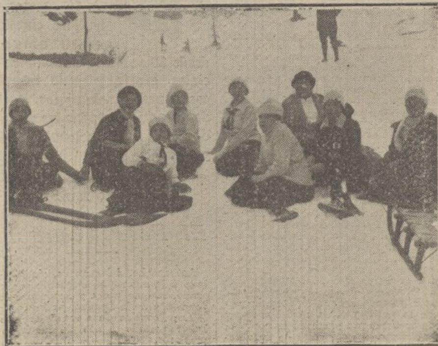
LOS DEPORTES DE INVIERNO EN BARCELONA.—Grupo de jóvenes durante una excursión por el valle de Ribas, en las vertientes del Monsell.

Una señora que se dirigía a Madrid presenta heridas de mayor gravedad que los restantes heridos.