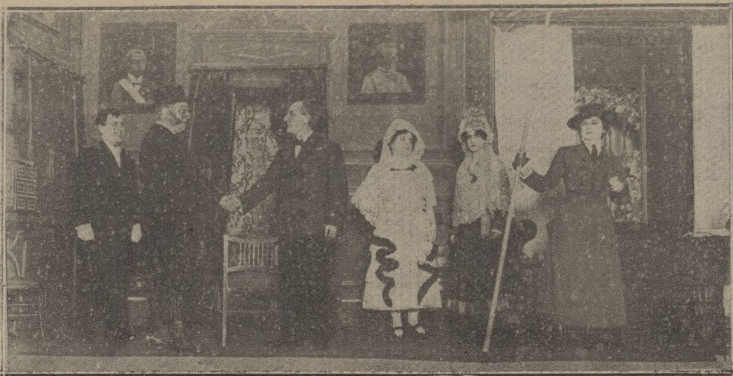
Una escena de «Lolita Tenorio», obra estrenada anoche en el teatro Infanta Isabel.