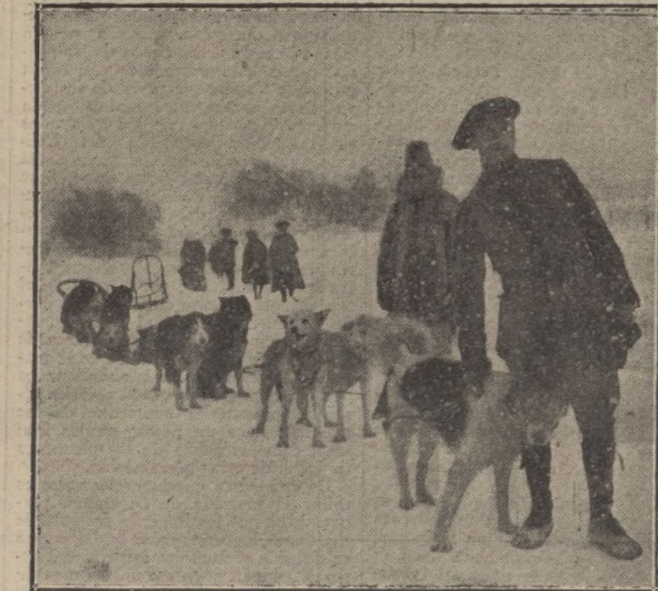
LA LUCHA EN LOS VOSGOS.—El teniente Hass, cónsul de Francia en Alaska, encargado de instruir á los conductores de perros.

«Respecto á los propósitos ingleses de estrechar el bloqueo contra Alemania existe en las esferas industriales y co-