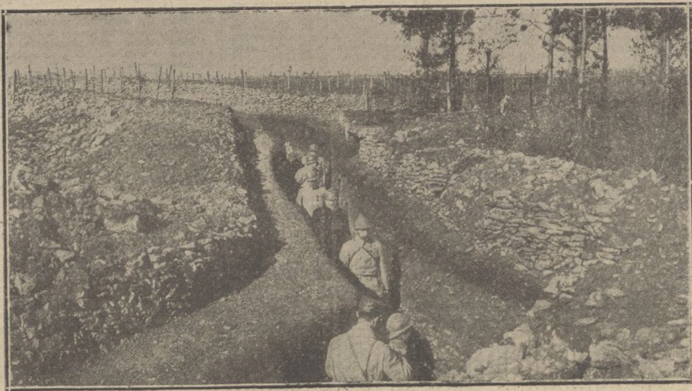
LOS JEFES DE ESTADO EN LA GUERRA.—El Presidente de la República francesa visitando una de las trincheras del frente.

Con tan triste motivo reiteramos á la distinguida familia del malogrado y facilísimo poeta la expresión de nuestro sincero pesar.