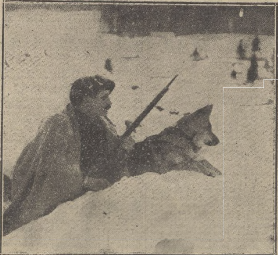
LA LUCHA EN LOS VOSGOS.—Un centinela avanzado con su perro de compañía.

Activos duelos de artillería en casi todo el frente de Iprés y en otros puntos aislados.