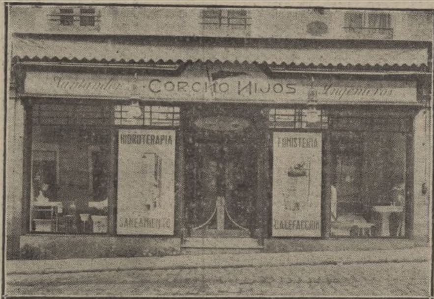
Establecimiento de Corcho H'jos.

La marca de sus automóviles es la de Scripps-Booth, acreditadísima en el mundo industrial. Podemos asegurar que será la predilecta del público español, lo