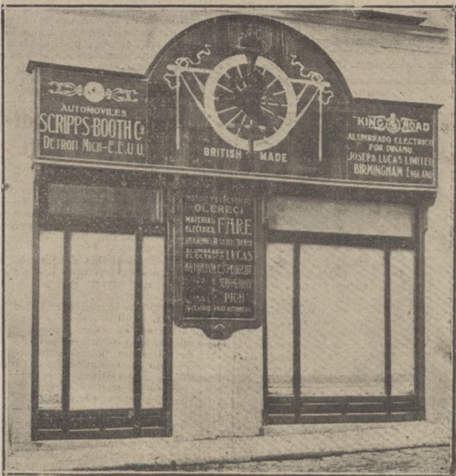
La Agencia de automóviles americanos