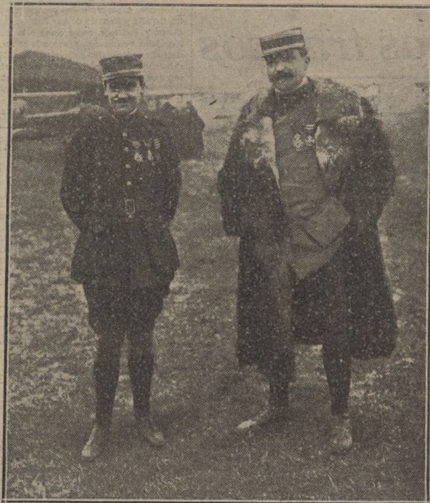
LA GUERRA EN FRANCIA.—Los pilotos-aviadores franceses Guynemer y Brocard, a los que se ha concedido la Legión de Honor y otras distinciones por sus arriesgados servicios de campaña.

En el mismo orden de ideas, hacia un horizonte de visión más grave y profunda, se ha levantado triunfalmente la Unión Antillana, como verá usted en el folleto que contiene las bases, a propuesta mía, aprobadas en Santo Domingo de Guzmán, Habana, Santiago de Cuba y San Juan de Puerto Rico. Mi excursión por estas Antillas ha durado cuatro meses, y nunca presencié en nuestras islas un entusiasmo tan fervoroso.