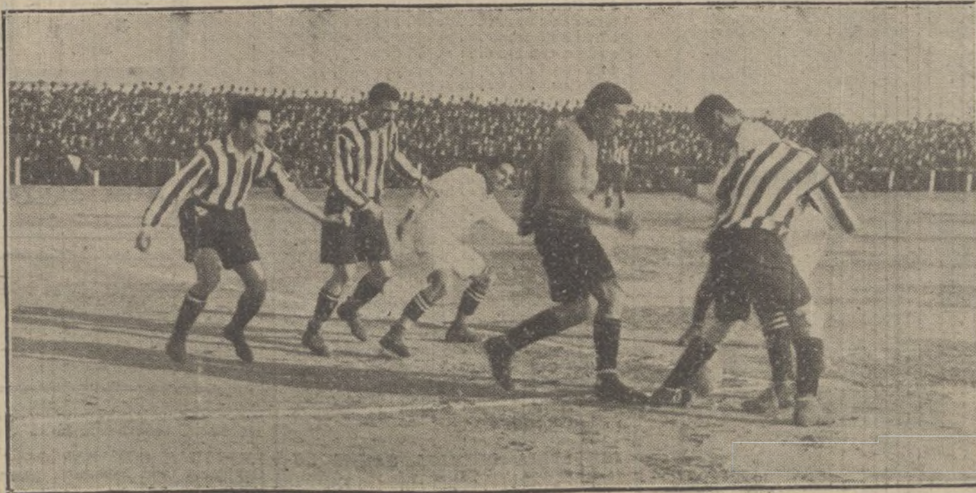
Un momento interesante del partido de foot-ball jugado ayer tarde entre los equipos Madrid F. C. y Athletic.

La tarea de devolver todos los trabajos que no publicamos sería abrumadora, y para evitarla, como para prevenir reclamaciones, que resultaría imposible atender, recordamos que no se devuelven los originales.