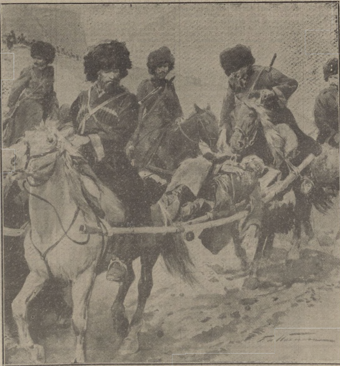
LOS RUJOS EN CAMPAÑA.—Conducción de soldados heridos.

disminución de intensidad los combates de artillería.