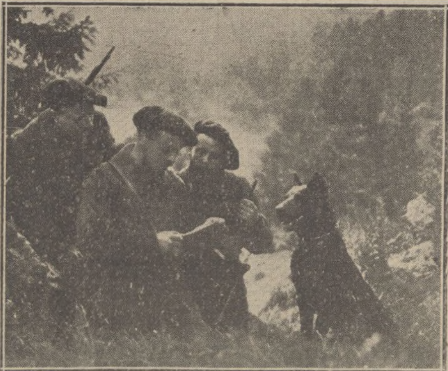
Llegada de un perro mensajero desde un puesto de observación á la segunda línea de combate, con una nota conteniendo noticias del enemigo.