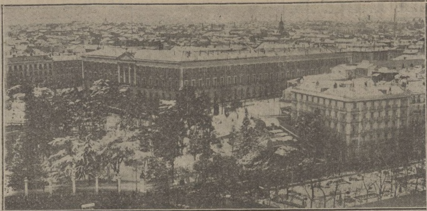
Aspecto del ministerio de la Guerra y calle de Alcalá durante la nevada que ha caído hoy. (Fotografía de VIDAL, obtenida desde la torre central del nuevo edificio de Correos.)

en Tirana entre serbios, búlgaros y austro-húngaros.—Hallet.