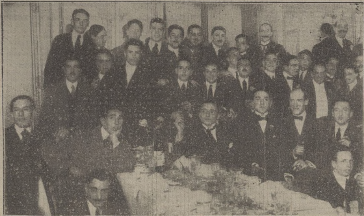
Banquete celebrado anoche en el café Inglés en honor del equipo de foot-ball Madrid F. C., que en reñida lucha ha ganado el campeonato de la región Centro.

LA TAREA DE DEVOLVER TODOS LOS TRABAJOS QUE NO PUBLICAMOS SERIA ABRUMADORA, Y PARA EVITARLA, COMO PARA PREVENIR RECLAMACIONES, QUE RESULTARIA IMPOSIBLE ATENDER, RECORDAMOS QUE NO SE DEVUELVEN LOS ORIGINALES.