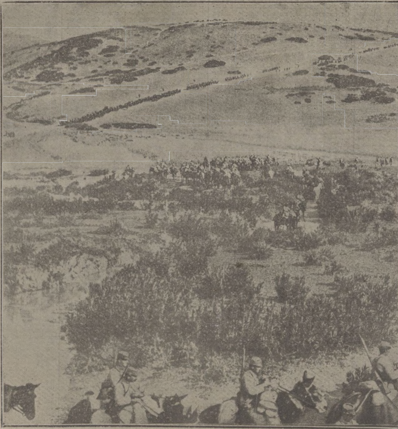
MOVILIZACION DE LAS TROPAS FRANCESA EN MARRUECOS.—La columna del coronel Simón, á su llegada á los terraplenes del campo de operaciones.

Cualesquiera que sean las medidas inmediatas que se adopten, con ánimo de aprovechar mejor nuestros recursos disponibles, no lograremos nunca el dominio del aire hasta que no lo reconozcamos como de importancia igual al dominio de los mares. No dudamos de que el Gobierno, apreciando dicho estado, tenga preparado algún remedio.»