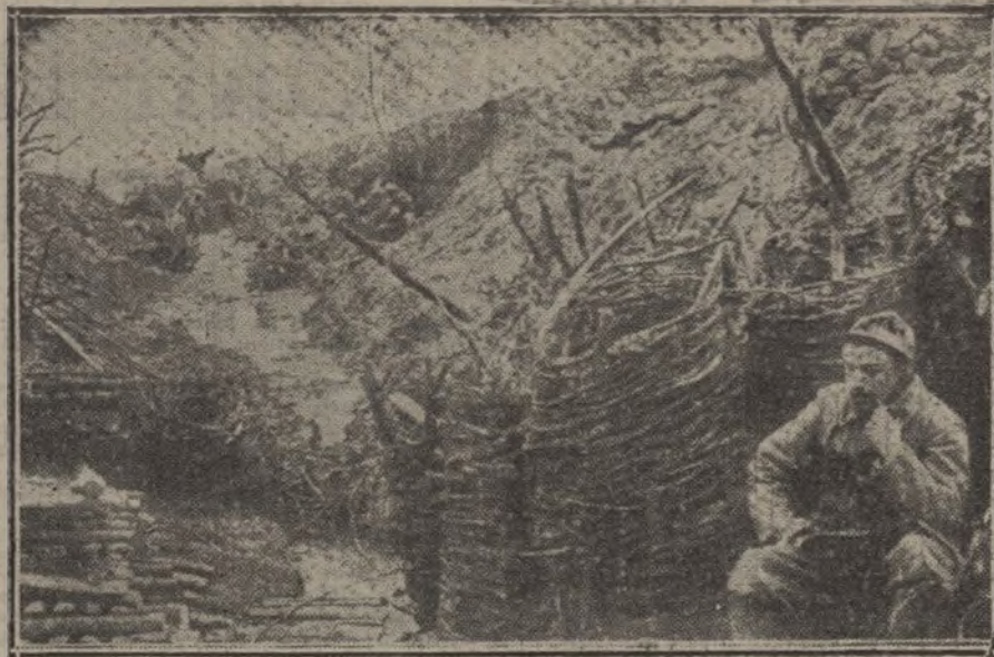
Una trinchera situada al pie de la cofina de Nuestra Señora del Loreto, transformada por las lluvias en un caudaloso río.

Contra nuestros navieros y nuestros siderúrgicos se desatan todas las iras de los gobernantes, espontáneas o inspiradas; y sobre esto de la inspiración acaso haya que hablar largo, y se produzca la justa protesta de quienes trabajan, producen y se avienen a dar toda clase de facilidades a los gobernantes.