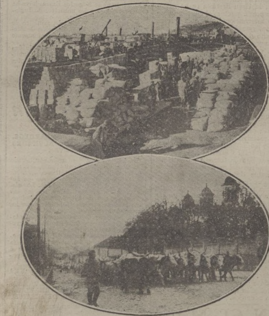
El puerto de Belgrado ocupado con el material de aprovisionamiento austroalemán. Conducción de vacas y toros por las calles de Belgrado á los campamentos alemanes.

Segundo. Todo suboficial ó clase que por efecto de negligencia y falta de vi-