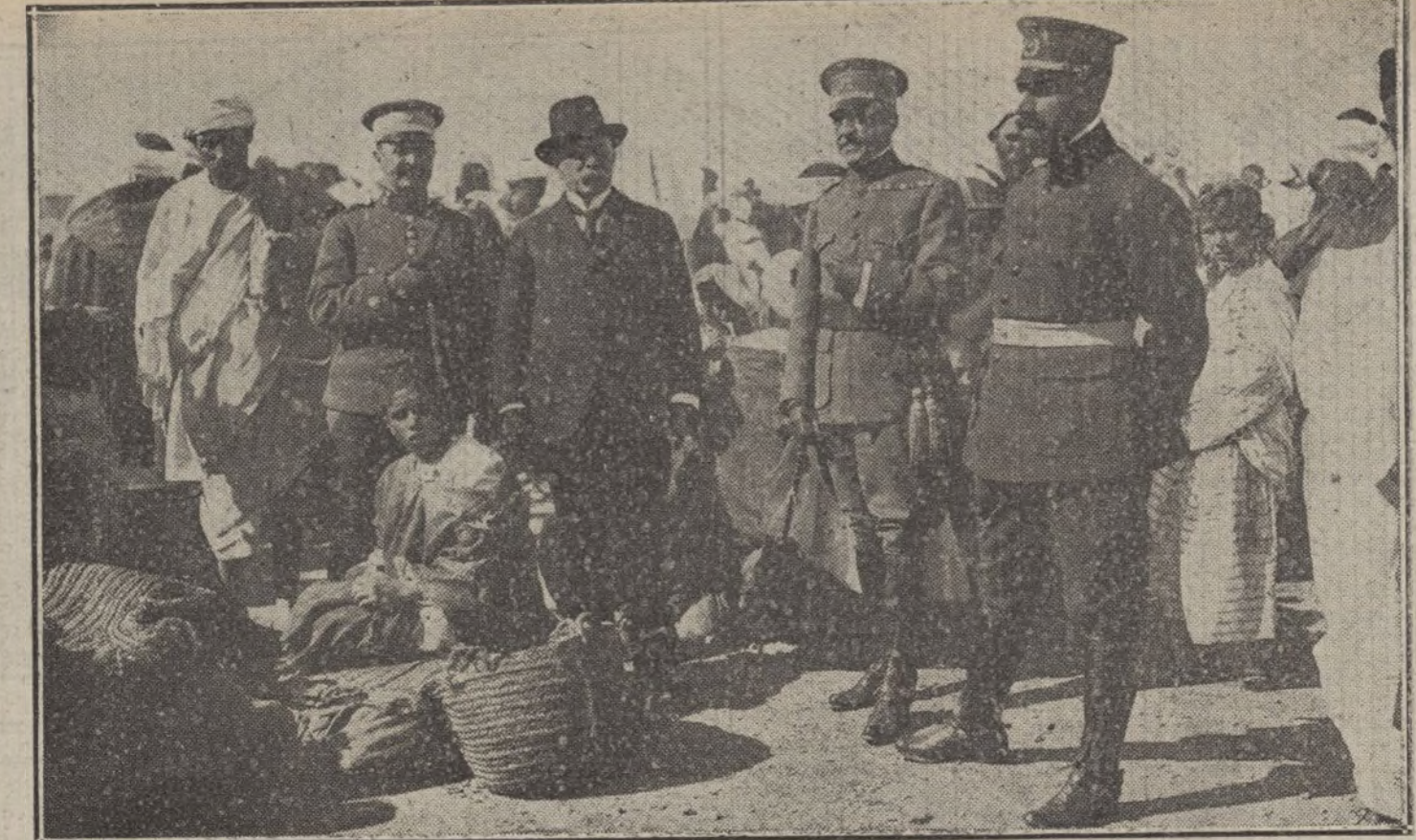
NUESTROS INTERESES EN AFRICA.—El general Huerta, acompañado del comandante general Aizpuru, comandantes Fanjul y Souza, visitando los típicos puestos moros del mercado del zoco del Hach.

El último párrafo de la disposición cuarta de la Real orden de 22 de Octubre de 1914 dictando las reglas por las que debe regirse el depósito franco de