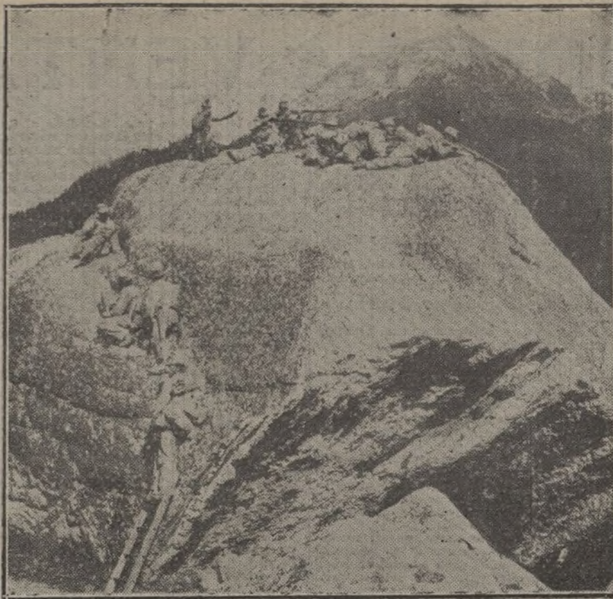
LA GUERRA EN EL FRENTES ITALIANO.—Soldados italianos en una altura del Isonzo esperando al enemigo.

—Ah... pero ¿no tienen pan? Pues que coman tortas.