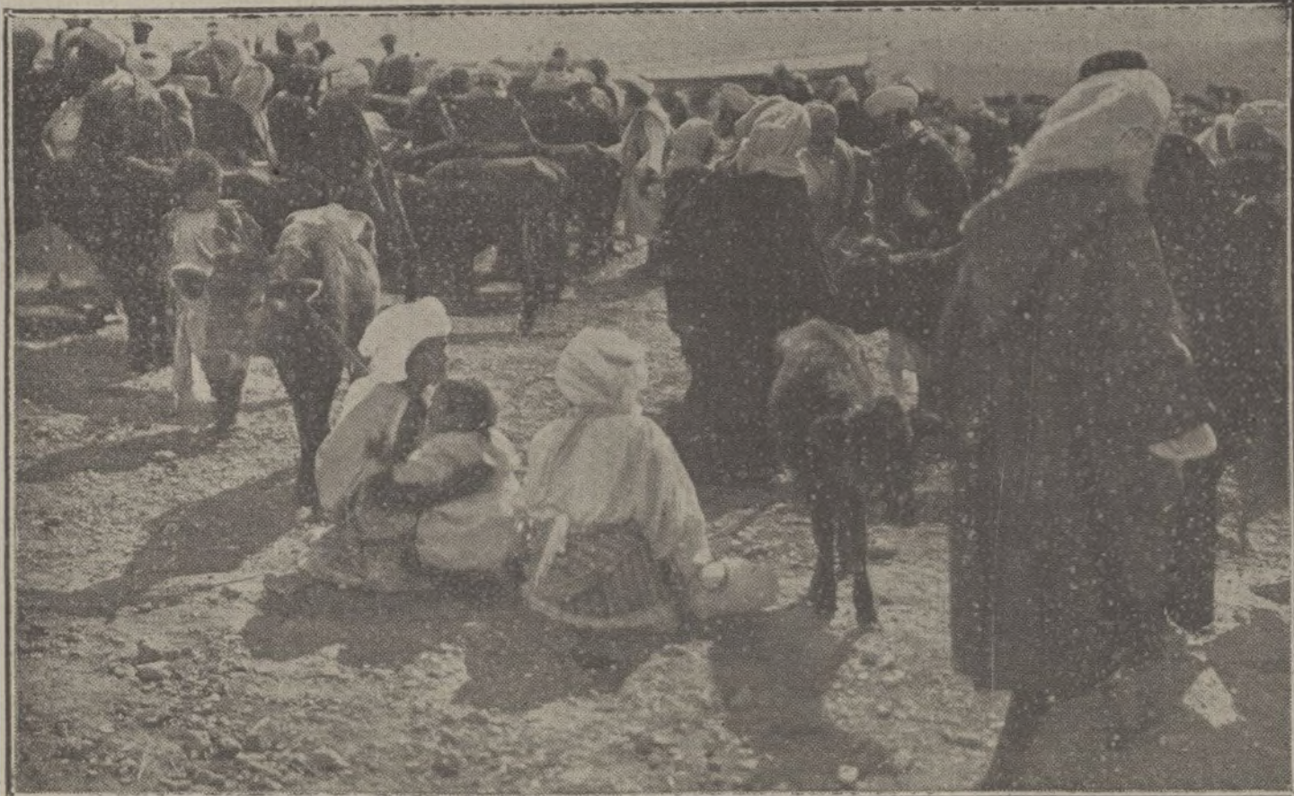
NUESTROS INTERESES EN MARRUECOS.—Mercado de terneras en el zoco del Hach, que ha visitado el general Huerta.

LA TAREA DE DEVOLVER TODOS LOS TRABAJOS QUE NO PUBLICAMOS SERIA ABRUMADORA, Y PARA EVITARLA, COMO PARA PREVENIR RECLAMACIONES, QUE RESULTARIA IMPOSIBLE ATENDER, RECORDAMOS QUE NO SE DEVUELVEN LOS ORIGINALES.