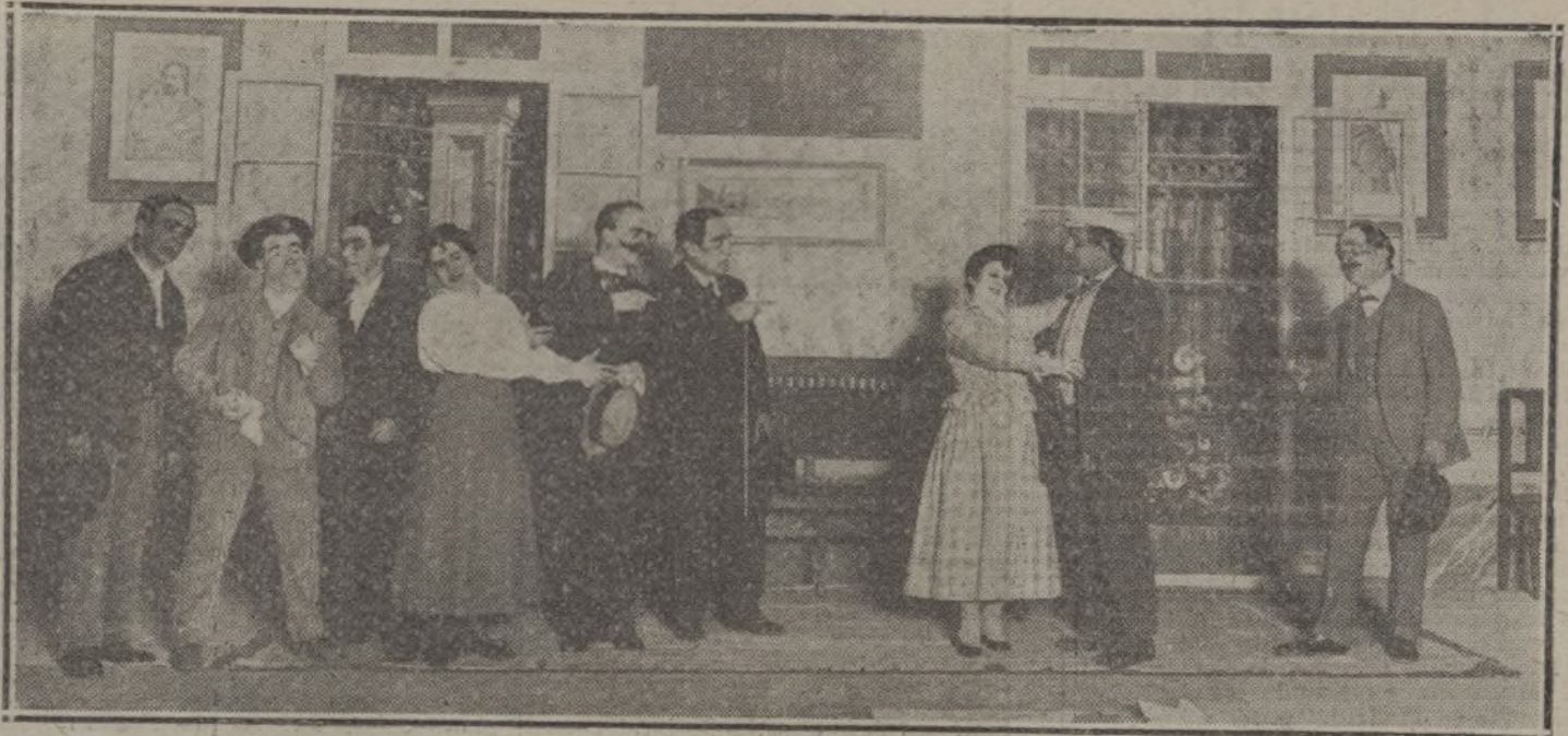
Una escena del tercer acto del juguete cómico «Los niños de Eciija», estrenado ayer en el teatro Cómico.

Cuota máxima, cinco pesetas; cuota mínima, una peseta.