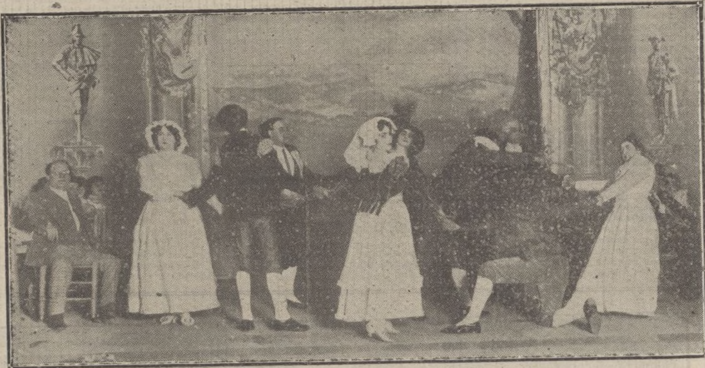
Representación del célebre cuadro de Goya «La gallina ciega», una de las escenas que más se aplaudieron en la obra «La patria de Cervantes», estrenada anoche con gran éxito en el teatro de Apolo.

El Juzgado instruye las oportunas diligencias.