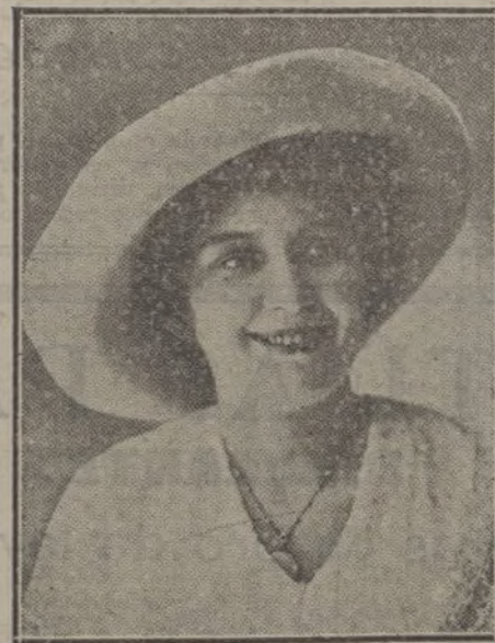
La señorita SYLVAIRE, notable actriz de cinematógrafo.

Doré, Gran-Vía, Triánón, Royalty y Príncipe Alfonso, que eran los salones en donde se estrenaba esta estupenda «film», vieron ante sus puertas agolparse la mul-