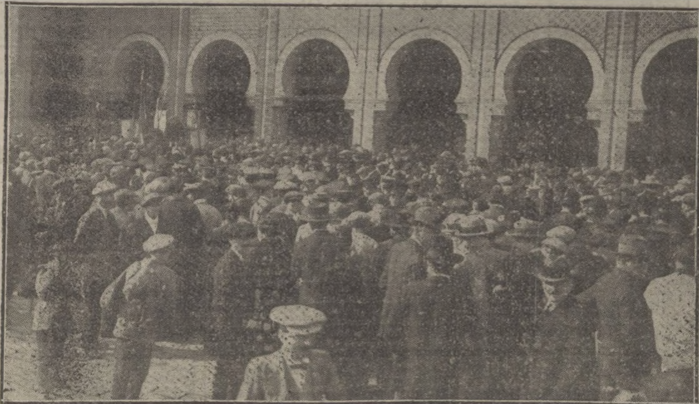
EL HOMENAJE AL DOCTOR LETAMENDI EN SEVILLA.—Aspecto de la estación de la plaza de Las Arenas a la llegada de los estudiantes madrileños, que asisten a las veladas necrológicas en honor del doctor Letamendi.

Undécima. Cerrado el concurso, se anunciará oportunamente el día en que deben recogerse los cuentos no premiados ni elegidos.