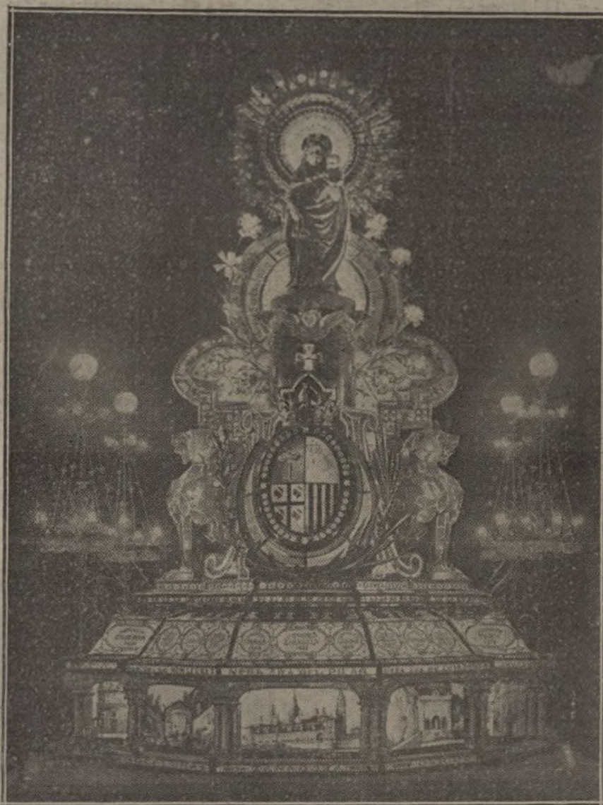
Anda de la Virgen del Pilar con artísticos faroles, proyecto y construcción de la casa Viuda e Hijo de L. Quintana, premiada en reciente concurso.

A esta acreditadísima Casa se deben los famosos faroles del Rosario de Zaragoza, de la catedral de Valencia y de otras