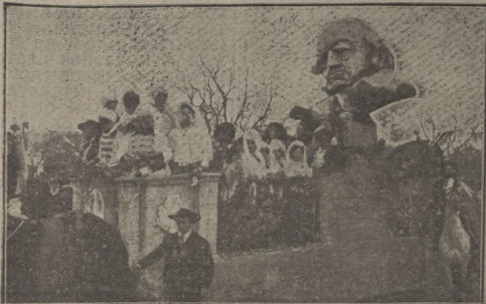
«Alegoría de Goya», carroza presentada por el Centro de Hijos de Madrid, fuera de concurso.