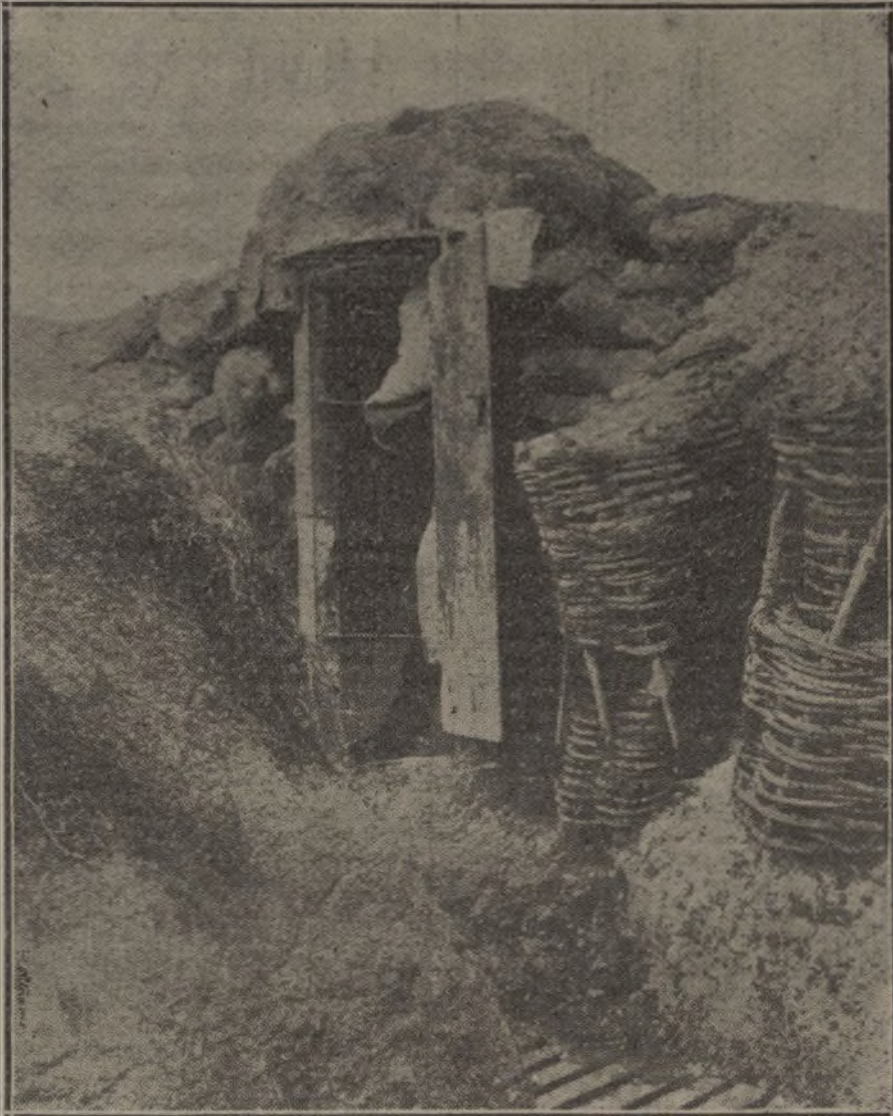
Vivienda de invierno, establecida en una trinchera del Norte de Francia.

En el Argonne cañoneó la artillería fran-