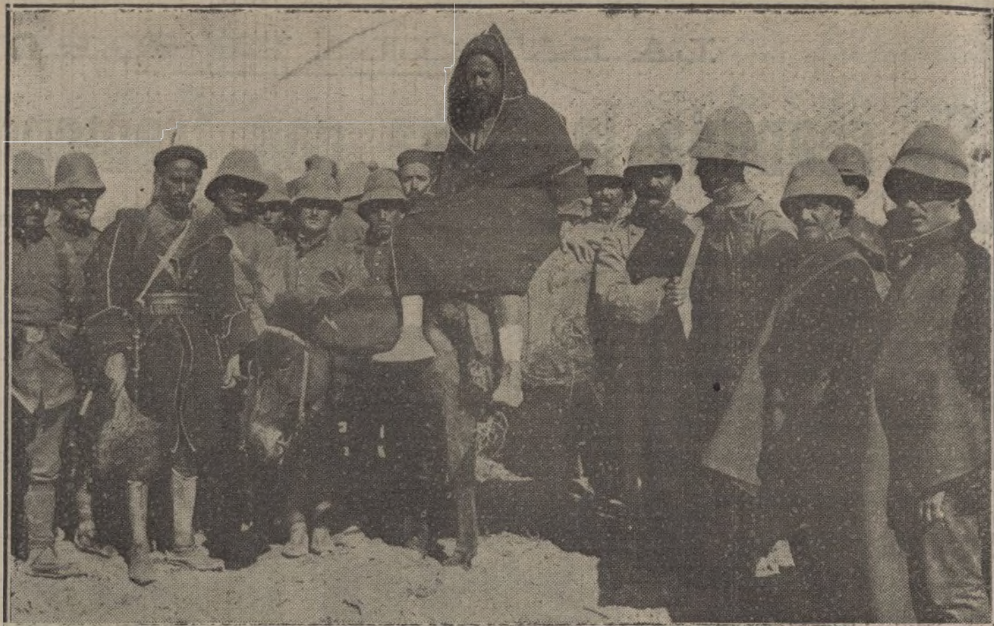
NUESTRAS TROPAS EN AFRICA. —Askari de la cuarta «mía» de policía indígena, herido en una pierna durante las re- cientes operaciones de avance por la izquierda del Kert. El herido al ser conducido desde la línea de fuego á la ambulancia.

Segundo. Nombre y domicilio del pri- mitivo expedidor en Alemania.