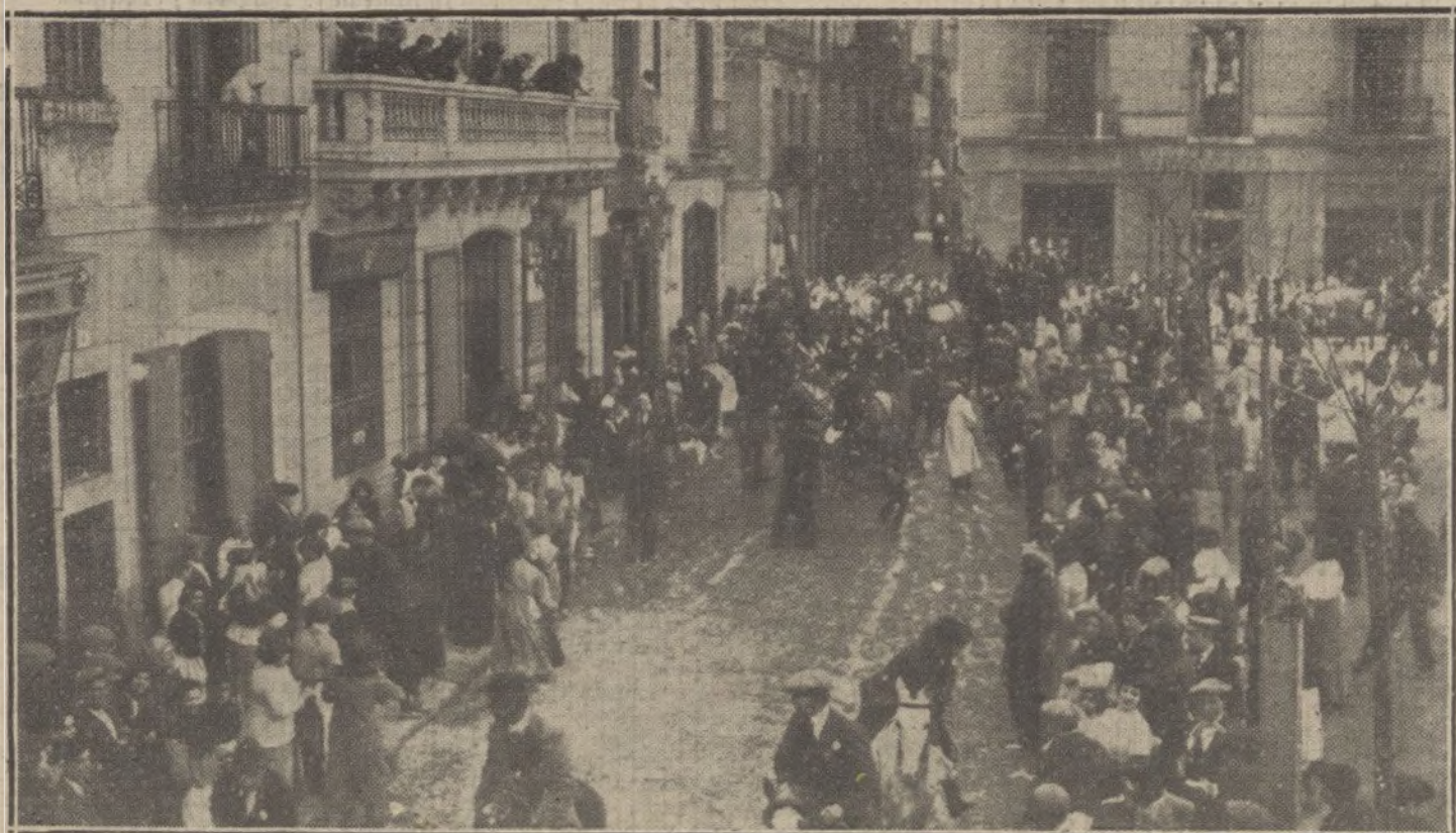
FIESTAS EN BARCELONA. —Las tradicionales «collas» de San Medin pasando por delante de la antigua Casa Consisto- rial de Gracia antes de dirigirse á la ermita.

NUMERO DEL TELEFONO DE LA ADMINISTRACION DE «LA TRIBU- NA» (PLAZA DE CANALEJAS, 6): 5.545