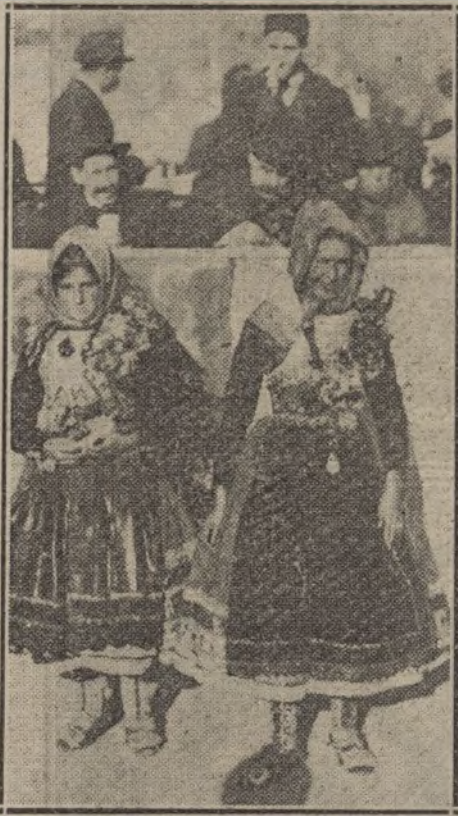
Artísticos trajes de aldeanas de Lagar (Toledo), que ayer llamaron poderosamente la atención.

La noche de ayer transcurrió sin incidentes de importancia. A pesar del frío, la animación, ni muy grande ni muy escogida, duró en las calles hasta altas horas de la madrugada.