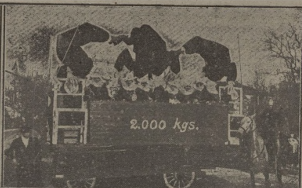
«Equilibrio inestable», carroza que obtuvo el segundo premio, primero de los concedidos.