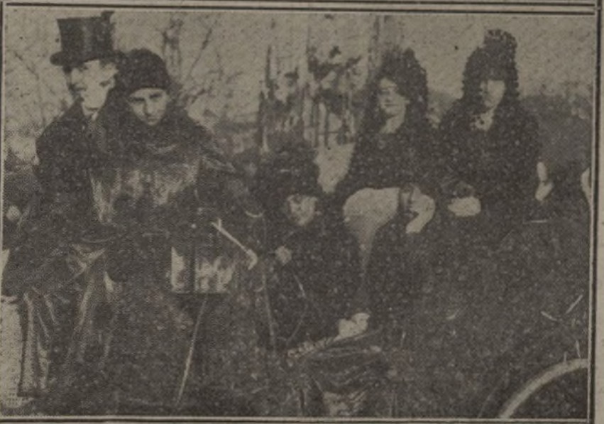
Dos de los coches que han desfilado esta tarde por el paseo de la Castellana.