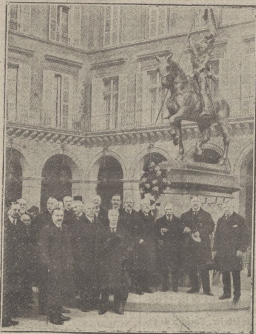
Los miembros del Parlamento inglés, después de depositar una corona de rosas en el monumento a Juana de Aco.

ocho primeros meses de guerra. Lo que más llama la atención en el documento es que el Gobierno italiano llame a los pequeños distritos donde se opera un gran territorio. En realidad, están las tropas italianas en todo el frente demasiado cerca de su frontera, y no tiene punto de comparación la faja de terreno que Italia hasta ahora ha «libertado del yugo extranjero» con lo que podría haberse incorporado sin necesidad de entrar en guerra con Austria-Hungría.