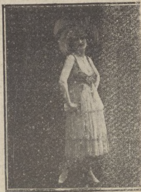
LUCILLE JOHNSON, célebre bailarina norteamericana, esposa de Jack Johnson campeón mundial de boxeo.

Por el ferrocarril central de Aragón continúa descargándose la exportación de ganado mular dedicado a Francia, procedente casi todo él de la región manchega.