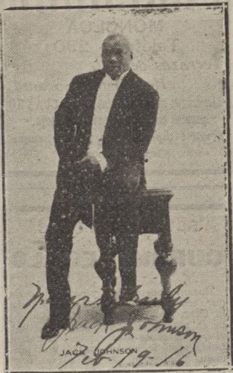
JACK JOHNSON, el más formidable boxeador que ha existido, y que actualmente se halla entre nosotros.

La lesionada fué asistida en la Casa de Socorro correspondiente, donde la apreciaron lesiones diversas, y después trasladada a su domicilio.