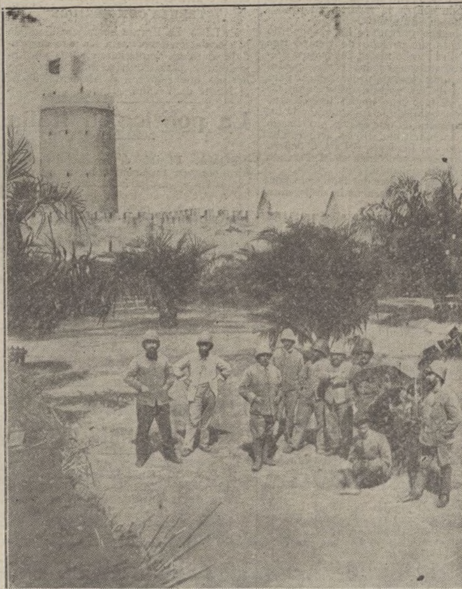
LA GUERRA EN LAS COLONIAS.—Blocaos alemanes de Yoko en el Camerón