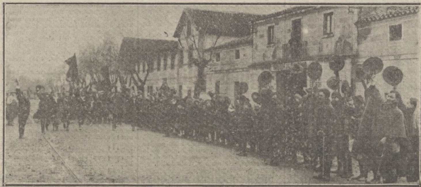
Llegada a Canillejas de los exploradores zaragozanos, donde han sido recibidos por los madrileños.