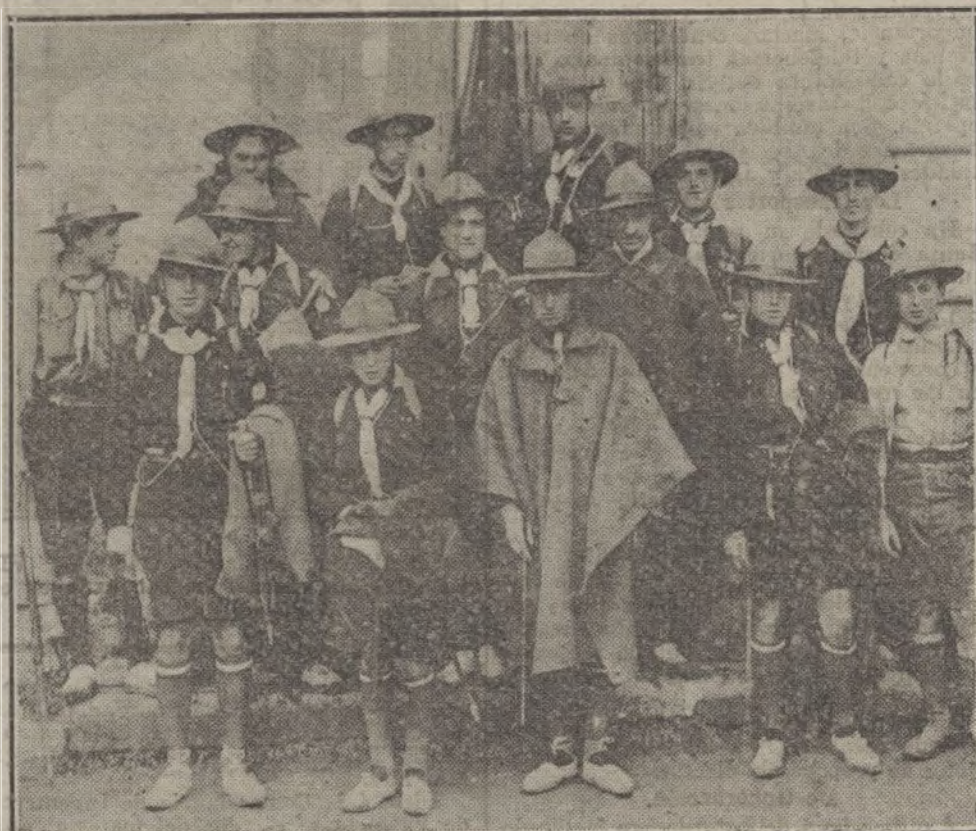
Los exploradores que han hecho el viaje a pie de Zaragoza a Madrid, para entregar a Mariano de Cavia un mensaje de salutación, a su llegada a San Fernando.

En la mañana de hoy salieron de San Fernando los exploradores de Zaragoza, los cuales, como es sabido, traen la honrosa misión de entregar al insigne Mariano de Cavia un mensaje de felicitación de la ciudad y heroica ciudad.