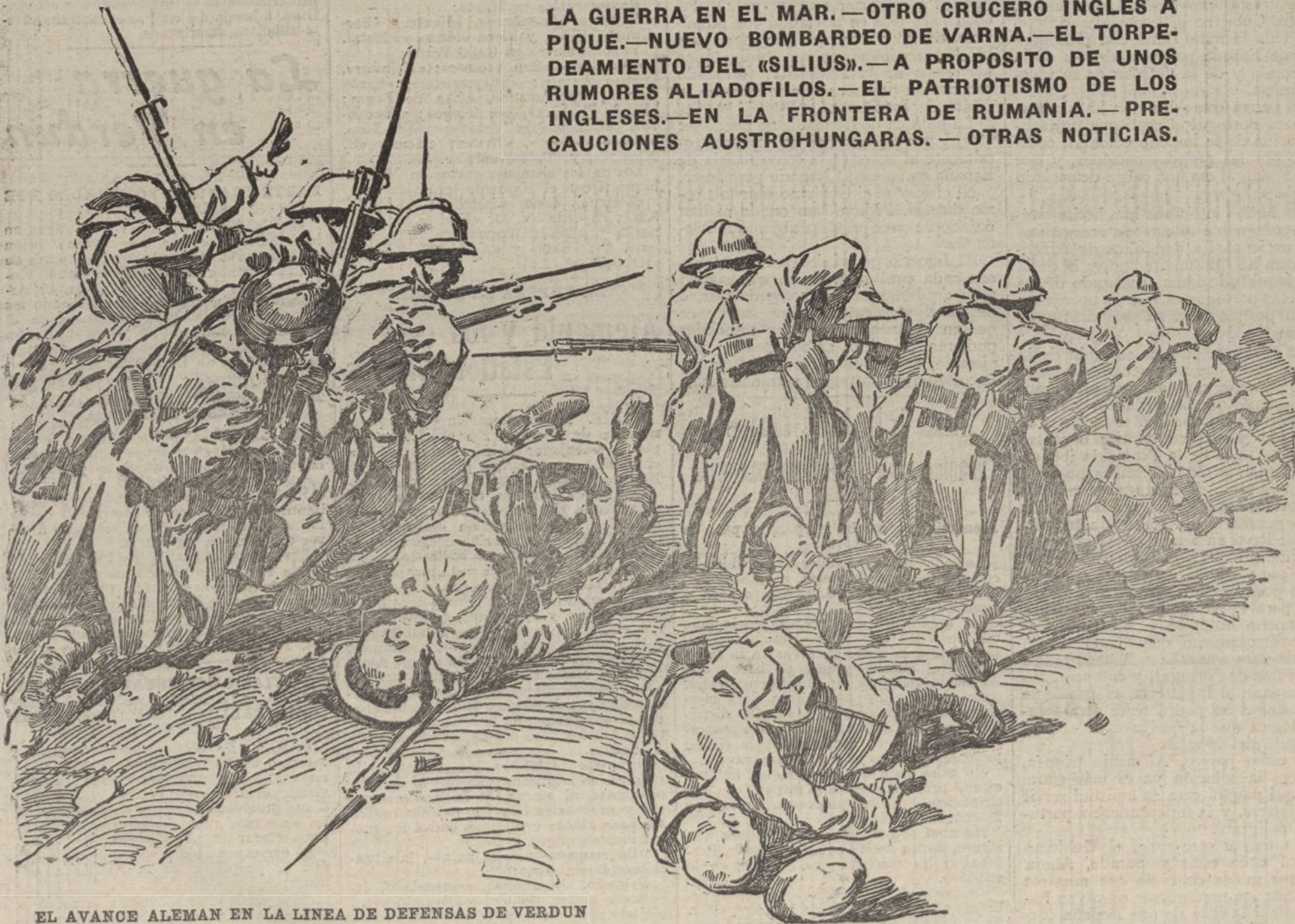
EL AVANCE ALEMAN EN LA LINEA DE DEFENSAS DE VERDUN

LA GUERRA EN EL MAR.—OTRO CRUCERO INGLES A PIQUE.—NUEVO BOMBARDEO DE VARNA.—EL TORPEDEAMIENTO DEL «SILIUS».—A PROPOSITO DE UNOS RUMORES ALIADOFILOS.—EL PATRIOTISMO DE LOS INGLESSES.—EN LA FRONTERA DE RUMANIA.—PRECAUCIONES AUSTROHUNGARAS.—OTRAS NOTICIAS.