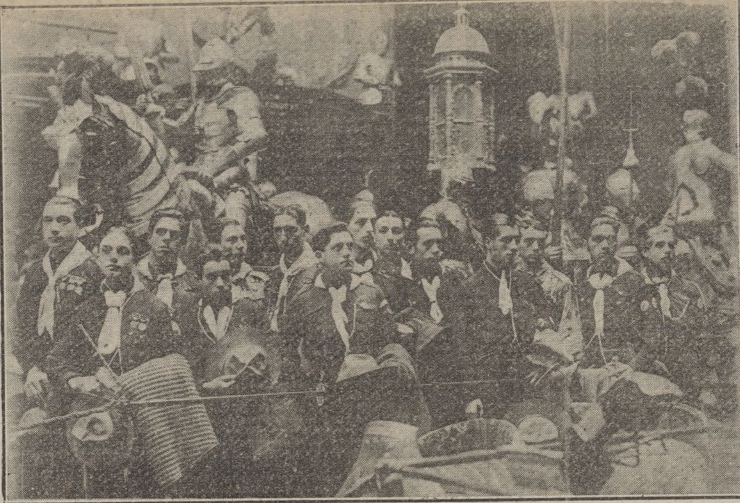
Los exploradores zaragozanos visitando la Armería Real.

Compañía Arrendataria de Tabacos, 280; Banco Hispano-Americano, 124; ídem Español del Río de la Plata, 268; acciones del Ferrocarril del Norte de España, 372; Sociedad general Azucarera, acciones preferentes, 59; ídem ordinarias, 21; obligaciones amortizables, 75,25; Duro Felgueras, 92,50; francos, 88,25; libras, 24,95.