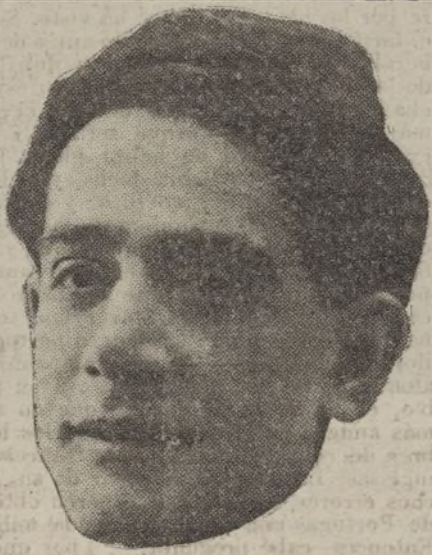
El notable actor ALFONSO MUÑOZ, que esta noche celebra su beneficio en el teatro Español.