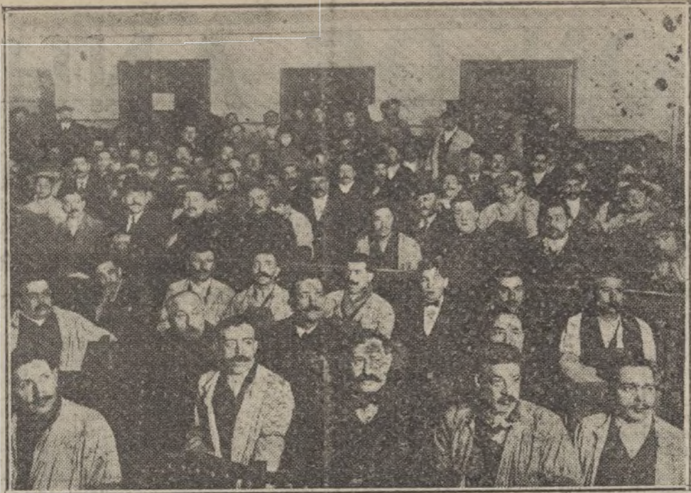
Aspecto del Salón Madrileño durante el mitin.

Y Quinto. Que teniendo acordado y reglamentado la Asociación de los gremios de carnes frescas y saladas de Madrid la implantación del Banco de los Gremios, se halla en condiciones para que inmedia-