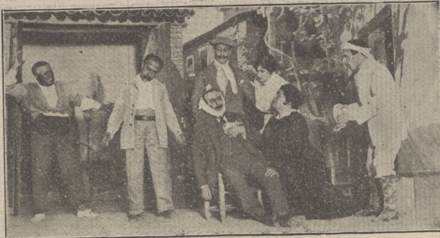
Una escena del sainete «La bendición de Dios», de Paso y Abati, que se ha estrenado esta tarde en el teatro Cervantes.

La base de defensa naval de Italia no está en el Adriático, sino en el Jónico; en Tarento, y sus barcos llegarían más tarde y en peores condiciones a cualquier punto de la costa italiana adriática si una escuadra enemiga estuviese preparada en cabo Stylos, bahía de Etolia, o en el canal de Corfú; por eso la diplomacia italiana se ha esforzado en impedir la expansión griega en territorio albanés, a fin de quitarle posiciones en el Adriático y otorgárselas a Albania, país menor.