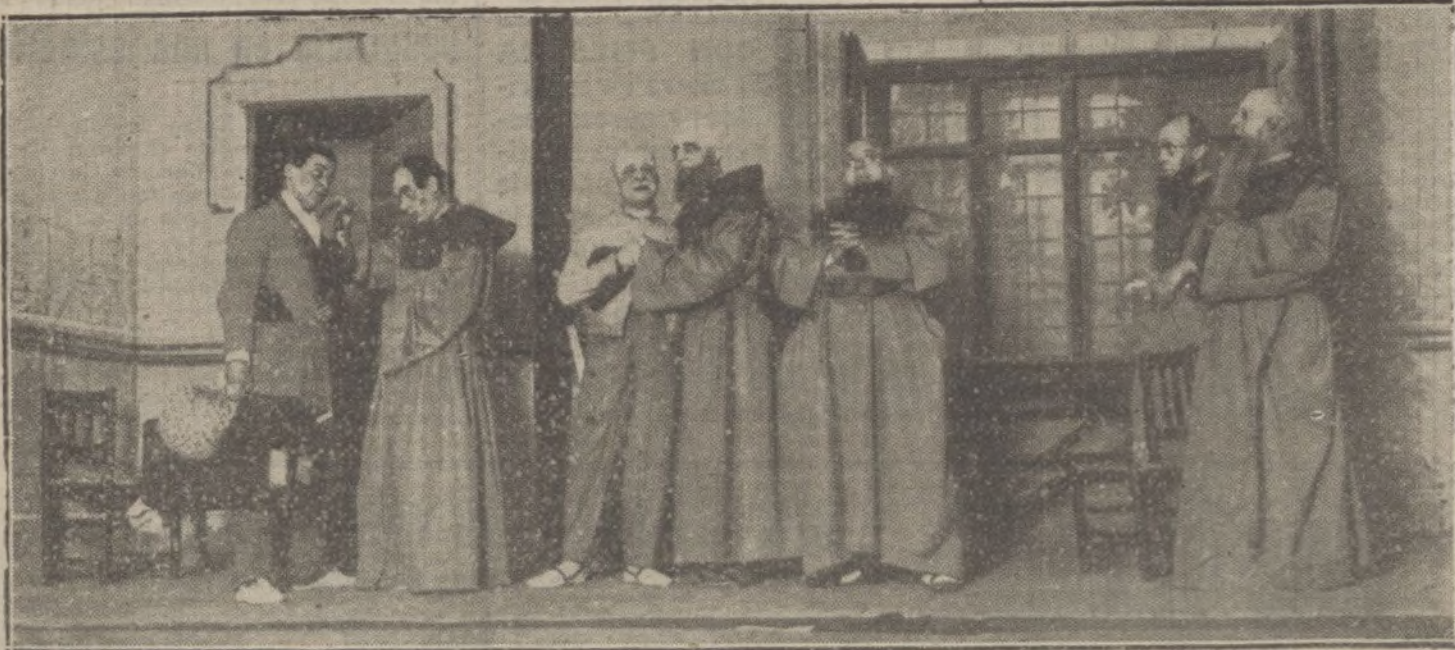
Una escena de la obra «Los gabrieles», estrenada esta tarde en el teatro Infanta Isabel.

LA TAREA DE DEVOLVER TODOS LOS TRABAJOS QUE NO PUBLICAMOS SERIA ABRUMADORA, Y PARA EVITARLA, COMO PARA PREVENIR RECLAMACIONES, QUE RESULTARIA IMPOSIBLE ATENDER, RECORDAMOS QUE NO SE DEVUELVEN LOS ORIGINALES