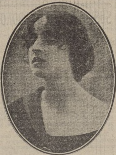
PINA MENICHELLI, distinguida actriz cinematográfica.