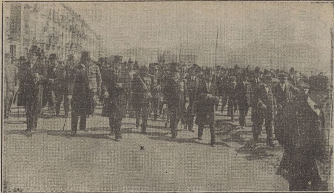
HOMENAJE AL GENERAL MUÑOZ COBOS EN CARTAGENA.—Las autoridades de Cartagena dirigiéndose a inaugurar la avenida que lleva el nombre del prestigioso general (X).

La travesía estuvo llena de inquietudes. Las minas submarinas que arrastra la corriente amenazaban a cada momento hundir el buque. Todos los pasajeros estábamos en un estado de inquietud que revelaba el peligro. Los medios de salvamento