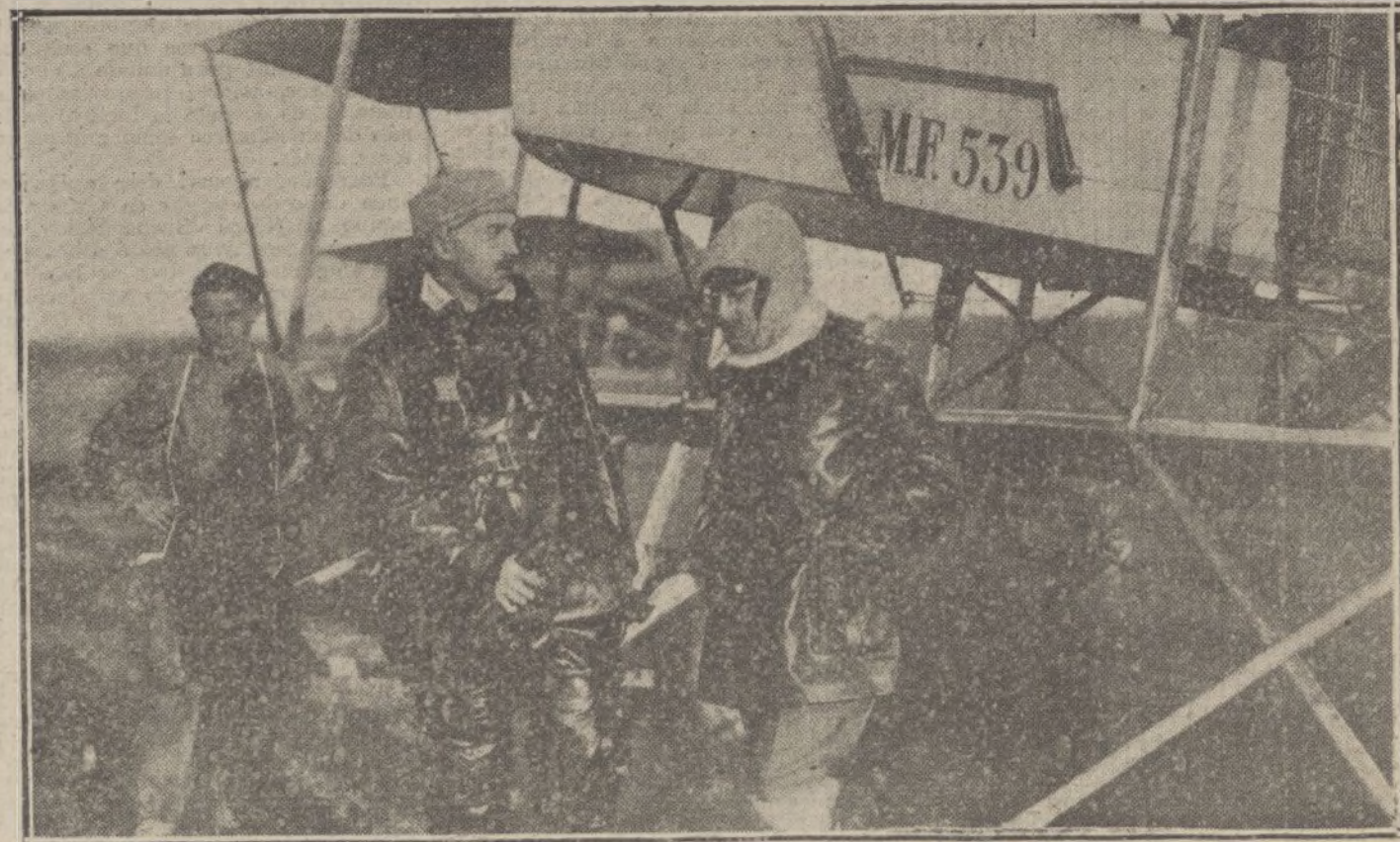
LA LUCHA EN BELGICA.—Aviadores en el frente inglés disponiéndose para una exploración.

En la novela recién publicada, «El hombre de oro», escasean los requisitos que los viejos preceptistas exigían a las obras literarias. «El hombre de oro» es una novela varia, incoherente, desproporcionada, desordenada, multiforme. Todo lo más, todo lo más, es una novela bella. El Sr. Blanco-Fombona nos describe en «El hombre de oro» un fragmento de vida americana. En una de las Repúblicas de Sudamérica—Venezuela, la patria de Bolívar—radica la acción de la novela. Se pinta en ella un trozo de la vida política,