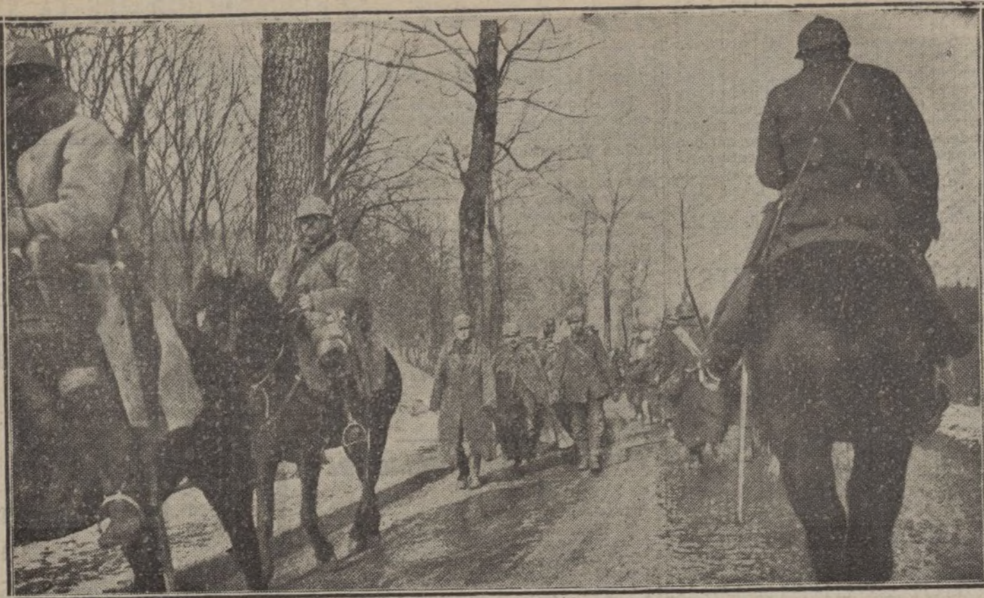
LAS OPERACIONES EN VERDUN.—Columna de prisioneros alemanes conducidos al interior de la plaza.

NUMERO DEL TELEFONO DE LA ADMINISTRACION DE «LA TRIBUNA» (PLAZA DE CANALEJAS. 6): 5.551