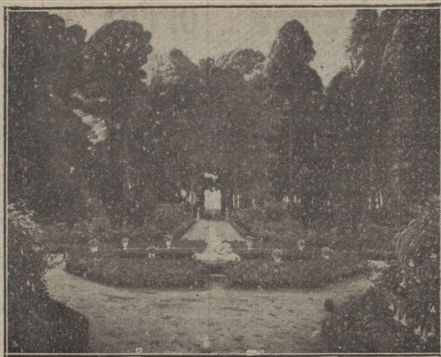
«Jardín de Aranjuez», cuadro de Santiago Rusiñol, que figura en su Exposición de Casa Vilches.