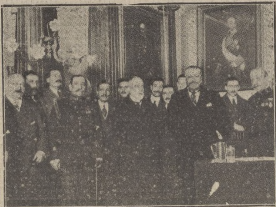
El director general de Comunicaciones, interesante conferencia en el Centro del

Para todo lo referente á publicidad francesa en LA TRIBUNA, dirigirse á nuestra Agencia en París: 22, Rue Vivienne, 22.