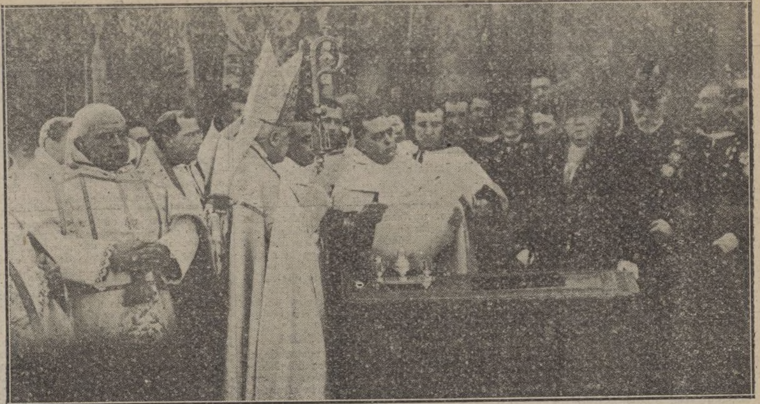
S. A. la Infanta Isabel, en representación de SS. MM., presidiendo el acto de bendición y colocación de la primera piedra para el convento de Carmelitas, ceremonia que se ha verificado esta tarde, á las cuatro y media.

La causa única de esta prohibición, que no siento tanto por los perjuicios materiales que me ocasiona, como por el dolor moral que me produce, ha sido que, apartándonos del deseo de D. Jacinto, hemos dado honores de estreno á lo que él deseaba que se hubiese representado sin anuncio previo, ni llamativa propaganda, ni clasificado como tal estreno. Esta es la razón única, y ese mi único pecado; lo confieso con la misma lealtad con que declaro que el Sr. Benavente me hubiera evitado este gran dolor prohibiéndome la re-