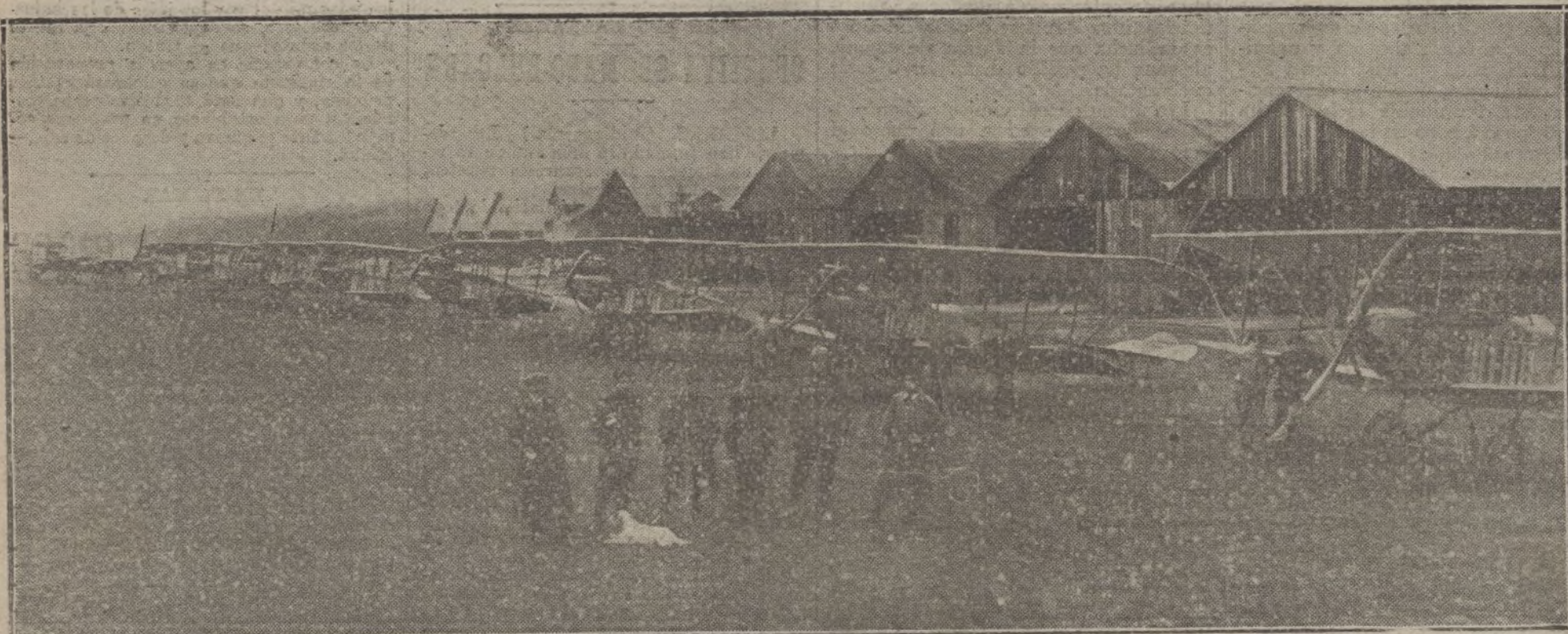
Escuadrilla de aeroplanos alemanes en un campo de aviación frente a Verdun.