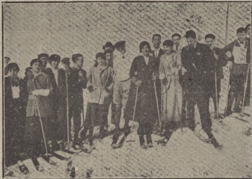
Grupo de deportistas que tomaron parte en las carreras de skis, celebradas el pasado domingo en Navacerrada.