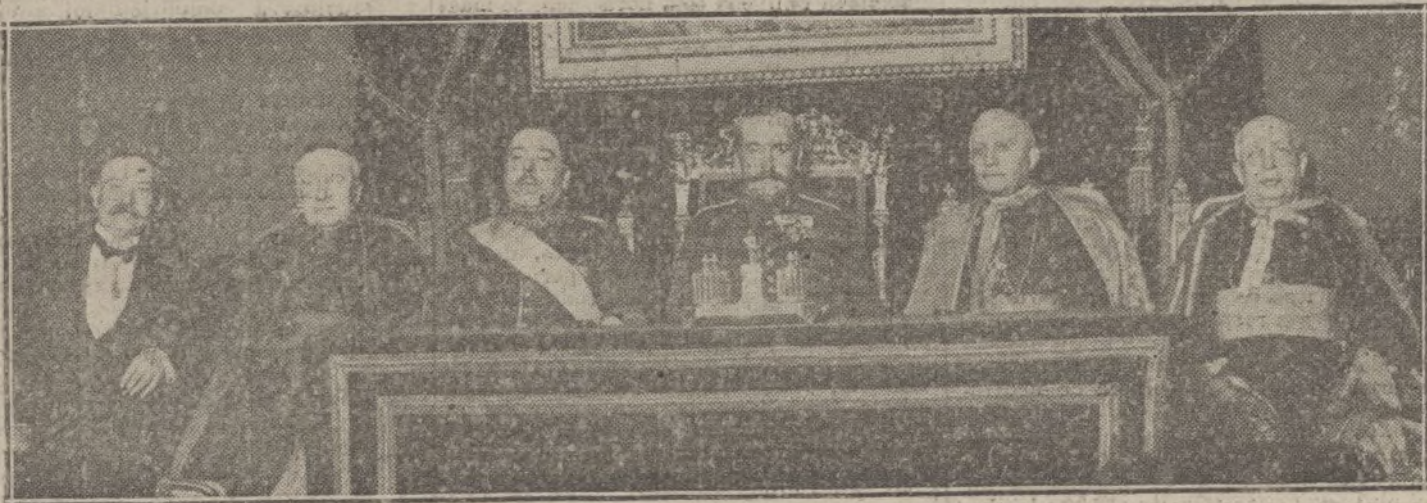
S. A. el Infante Don Carlos, acompañado del obispo de Madrid-Alcalá, Nuncio de Su Santidad, monseñor Ragonesi; obispo de San Luis de Potosí y Sres. Burell y Ugarte, presidiendo la sesión celebrada anoche en la Real Academia de la Historia para conmemorar el XL aniversario de la fundación de la Sociedad Geográfica.

Las consecuencias de la guerra en España, si han producido ventajas para algunas industrias y producciones, no muchas, ha ocasionado, sin embargo, grandes perturbaciones en todo el país. Y no tenemos derecho a quejarnos siquiera; somos de todos los pueblos neutrales de Europa el que vive en mejores condiciones, aquel en que la vida se desarrolla de modo más normal. Volved la vista alrededor vuestro y veréis cómo todos los demás sufren, cómo padecen en un grado de sufrimiento mucho mayor que nosotros. La acción del Estado por muy solícita que sea,