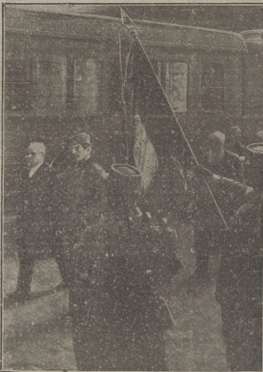
El Presidente de la República francesa y el Príncipe regente de Servia en la estación de Lyon, revistando á las tropas que les rindieron honores.

Contra las posiciones que conquistamos en Sella Freikofel y en el pascio del