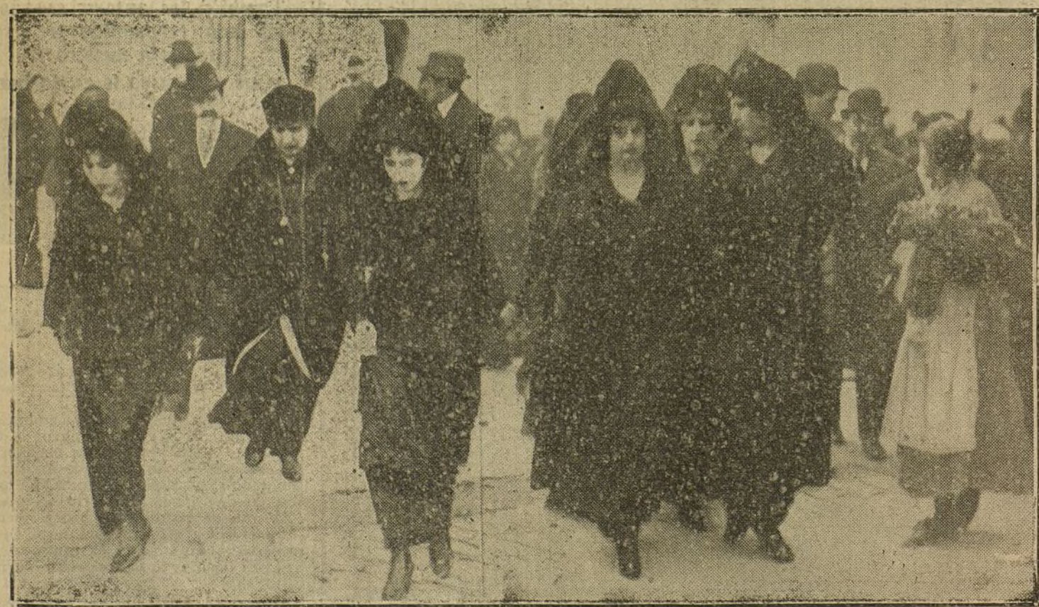
LA VISITA A LOS SAGRARIOS.—Grupo de castizas madrileñas visitando los templos.

NUMERO DEL TELEFONO DE «LA TRIBUNA»: 4.444