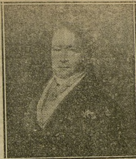
El padre de Bismarck, Carlos Guillermo Fernando.