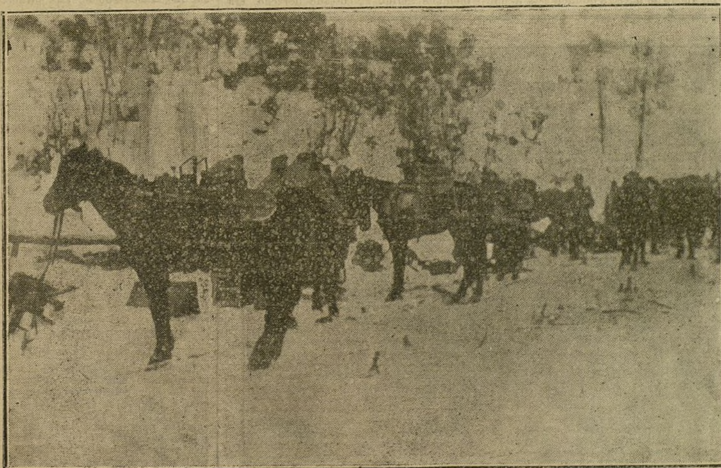
LA GUERRA EN ORIENTE.—Transporte de ametralladoras austriacas en la región nevada de los Cárpacos.

El ministro de Hacienda visitó la corte de Tablada, con objeto de apreciar la altura del río. Aumenta la intranquilidad.