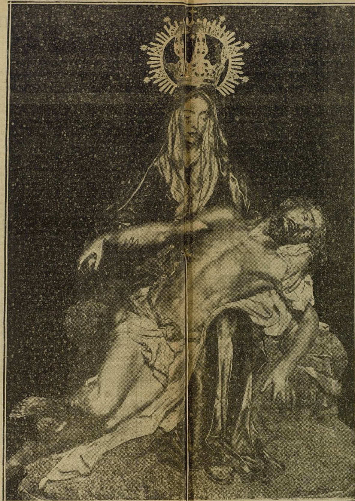
Magnífica imagen labrada en madera y construída en una sola pieza. Se atribuye al célebre escultor Carmona, que vivió en época de Carlos III.

Los que opinan que fué el costado izquierdo el traspasado, dan la razón de que poniéndose un hombre enfrente de otro, el lado derecho del uno, corresponde al izquierdo del otro. Alegan, además, que la impresión de las llagas del serafico padre San Francisco, apareció en el costado derecho la llaga, teniendo una cicatriz enroscada, de la que derramaba algunas veces sangre. Aquel Serafín que imprimió las llagas al Santo Padre, tenía la figura de Cristo; como quiera que se apareció cara á cara, dicen que habiéndole herido el costado derecho, era