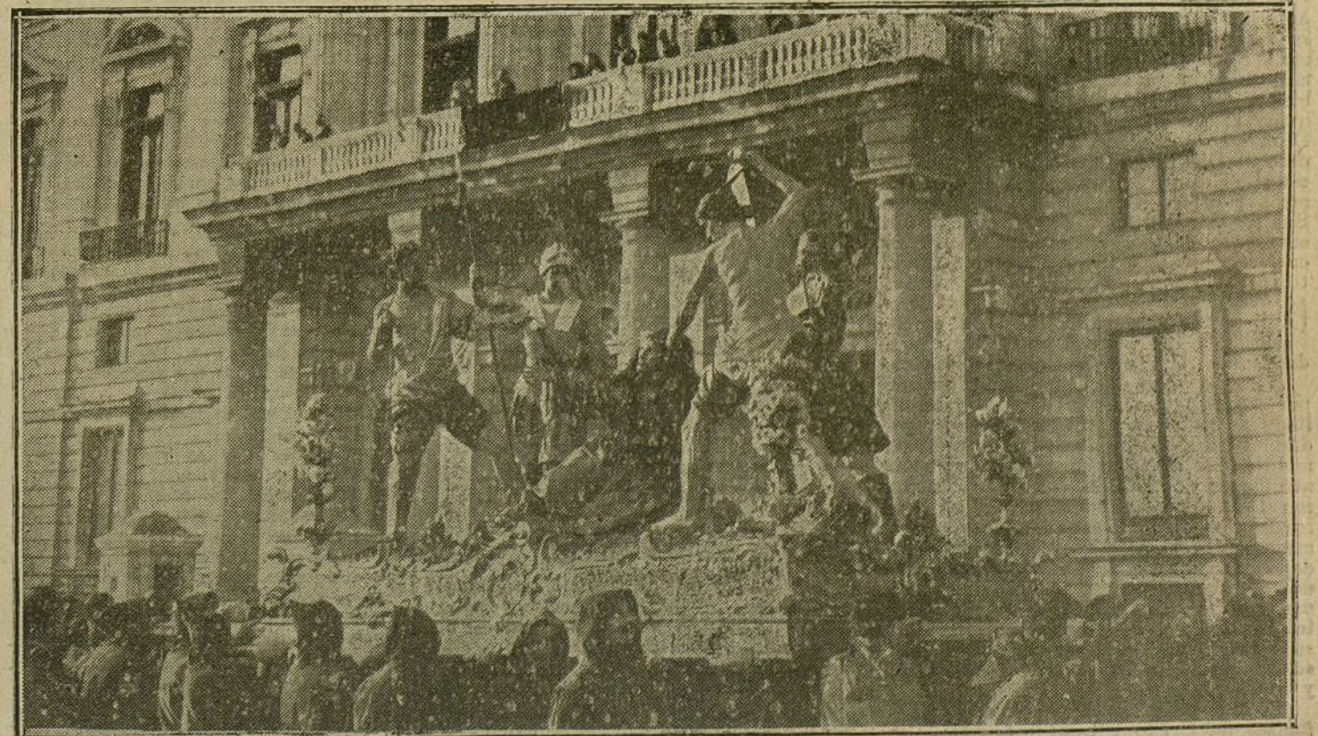
LA PROCESION DE VIERNES SANTO.—Los pasos de la procesión del entierro desfilando por delante del Palacio Real.

Además de esta breve exposición, de este concepto profundo de la verdadera doctrina teológica del valor expiatorio de la muerte de Jesús, que hace desaparecer todo aquel simbolismo paulino que la quiso atribuir Loisy, claramente manifestado queda su valor evangélico en las propias enseñanzas del Hijo de Dios, y en los textos de sagrados escritores, contra cuya veracidad nada seguramente pueden la más exquisita sutileza de análisis de estos modernos filósofos y teólogos, que habiendo escrito en su bandera la negación de todo lo incomprensible ó contrario á sus ideas, se asocian con creciente fanatismo para ver de conseguir fines