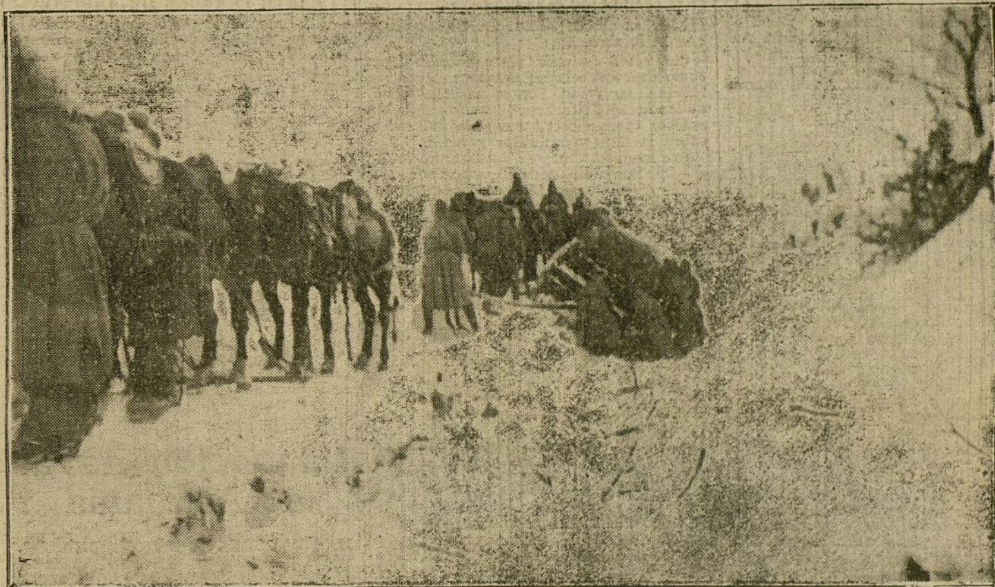
LA GUERRA ENTRE LA NIEVE.—Un convoy austriaco detenido por el temporal en el territorio de Dukla.

Y volvemos á la pelea terrestre; son tan nimios los hechos, tan insignificantes, tan aislados, que el parte oficial fran-