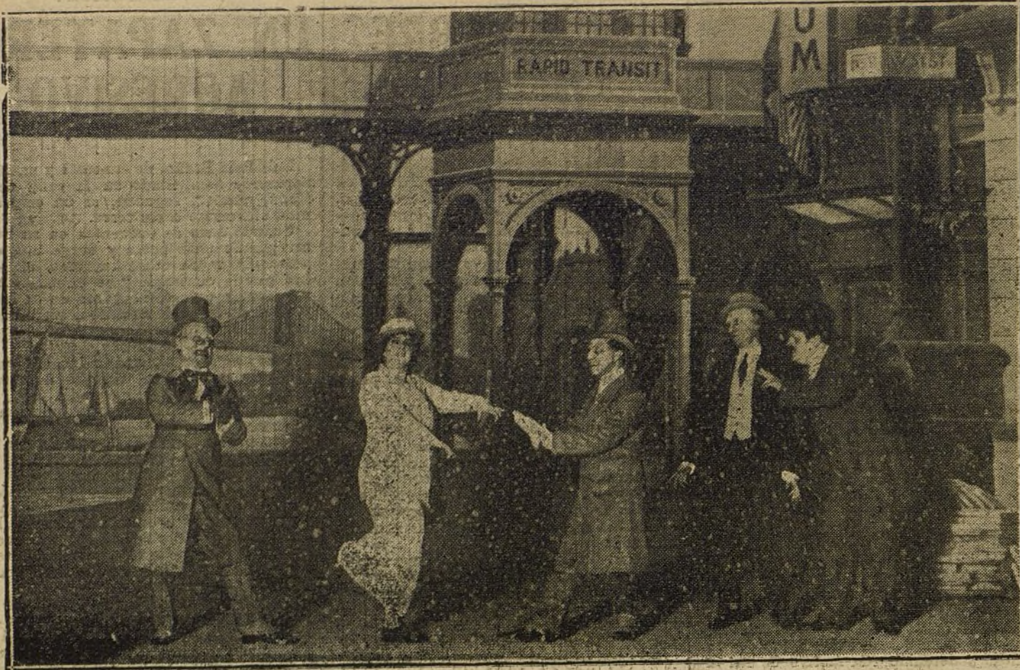
Una escena de «La pandereta», zarzuela estrenada anoche en Apolo.