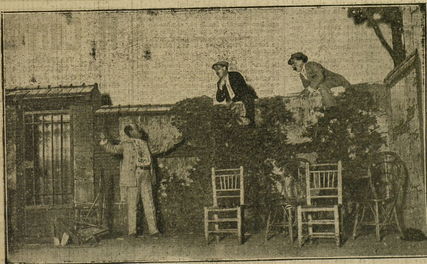
Una escena de «Mi querido Pepe», juguete cómico estrenado anoche en Cervantes.