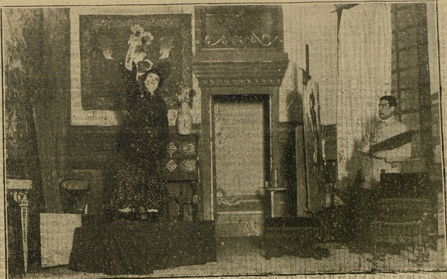
Una escena de «La bella Pinguino», comedia estrenada anoche en el Trianon-Palace.

Tanto el libro como la música alcanzan un éxito grande y merecido.