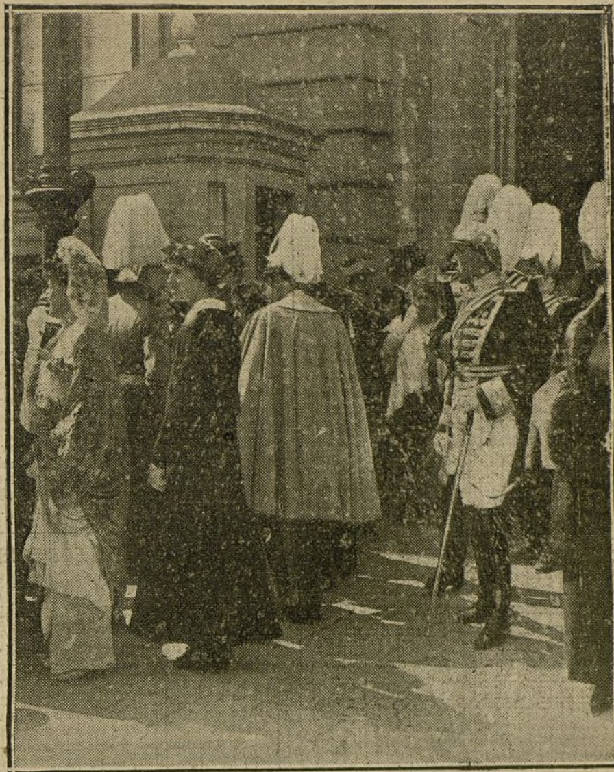
LA FESTIVIDAD DE AYER EN PALACIO.—El público saliendo del regio Alcázar, al terminar la capilla pública y las ceremonias verificadas con motivo de la Pascua de Resurrección.

El teatro estaba lleno de aristocrático público.