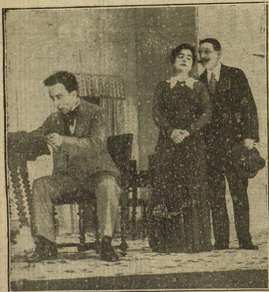
Una escena de «La marcha nupcial», estrenada en el teatro de la Princesa.

Su opinión personal es que ganarán los aliados, y que esto conviene también a los intereses de España.