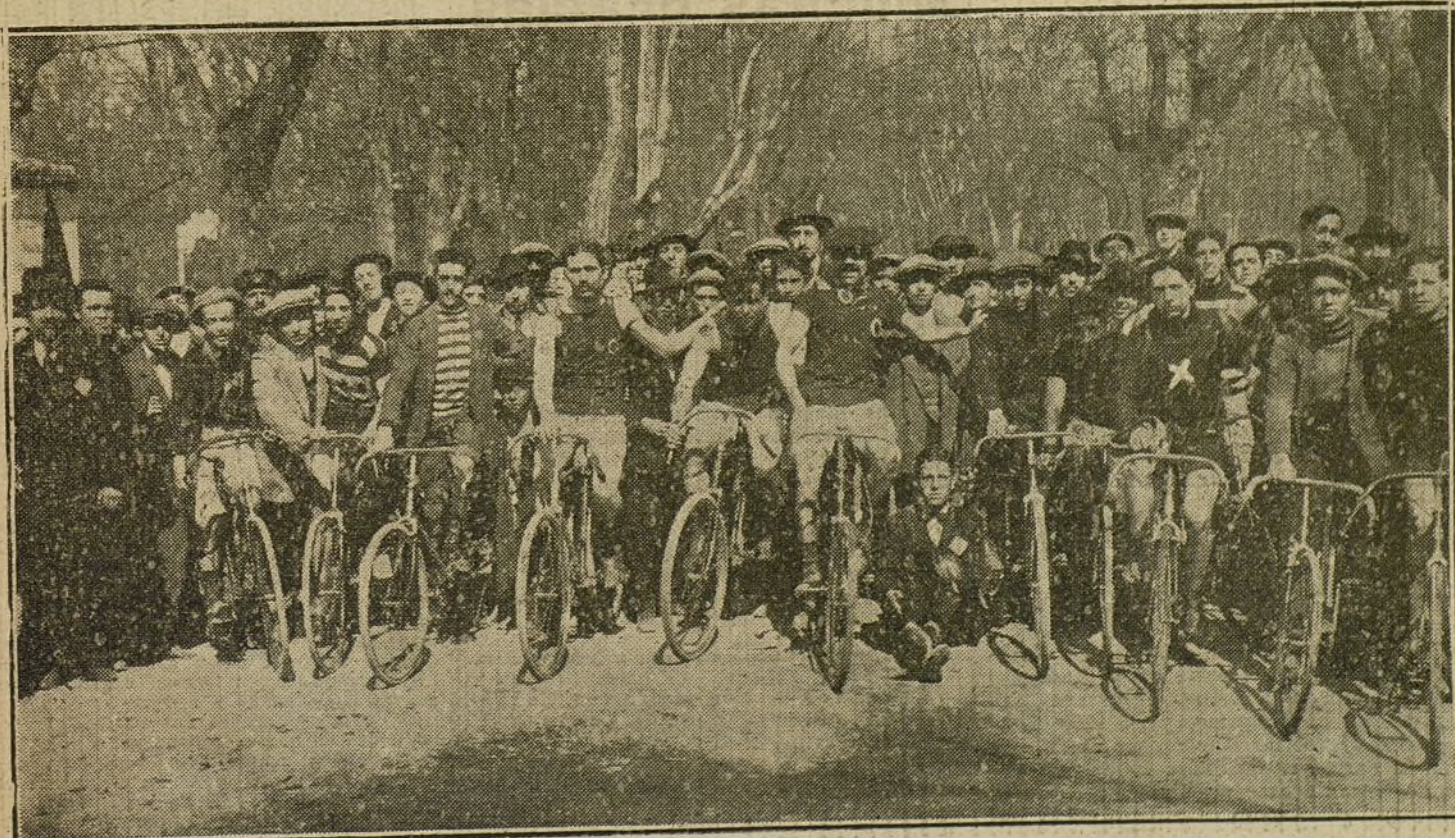
CARRERAS CICLISTAS.—Los ciclistas que tomaron parte en las carreras de neófitos verificadas ayer en la carretera de la Cornuá, dispuestos para la salida. X, el vencedor.