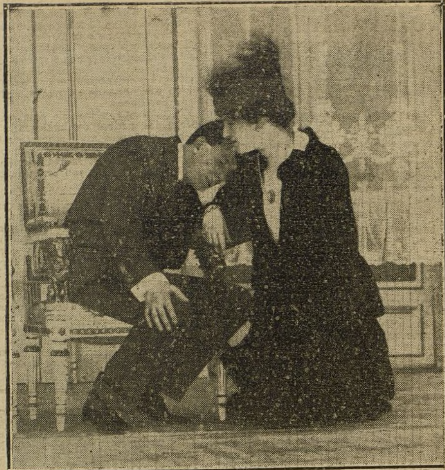
Una escena de «El gavilán», obra estrenada en el teatro de la Comedia.

Los rifeños blasonan de haber humillado sus piratas las banderas de las más poderosas naciones.