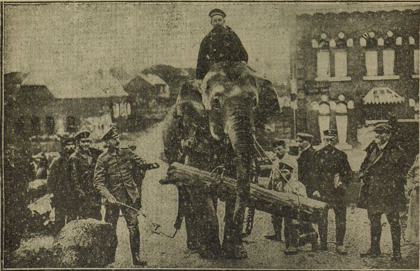
LA GUERRA EN FRANCIA.—Elefante regalado por el parque Hagenbeck al Ejército alemán, y destinado al transporte de madera en los campamentos de Francia.