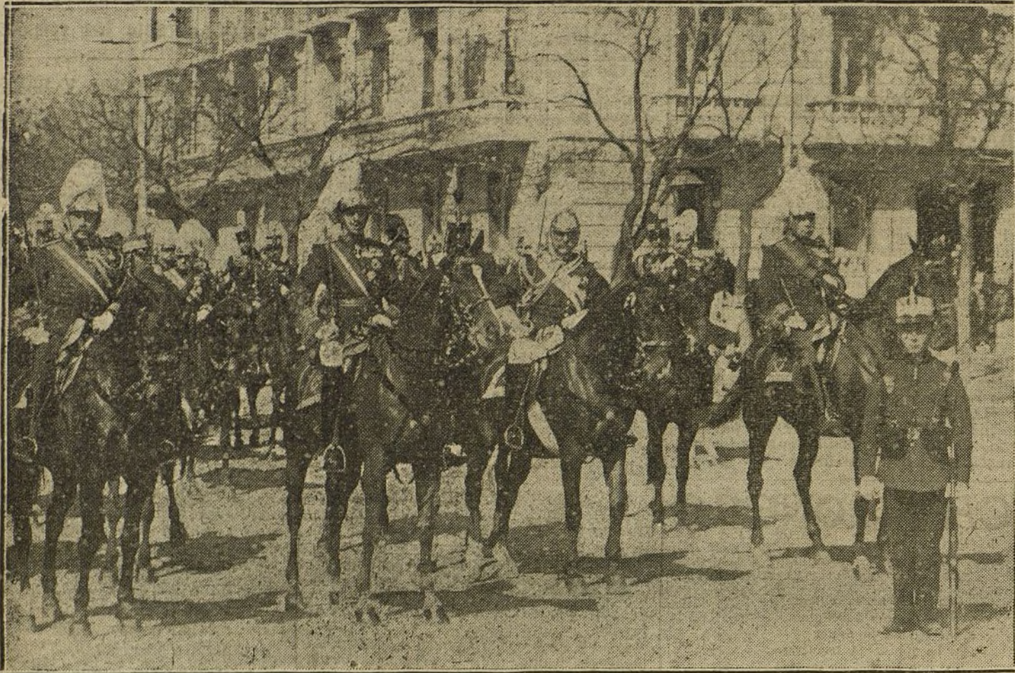
S. M. el Rey, acompañado de su Estado Mayor, presenciando la jura.