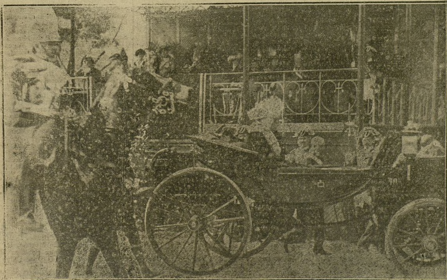
Llegada de S. M. la Reina Victoria a la tribuna, para presenciar la jura.

LA TAREA DE DEVOLVER TODOS LOS TRABAJOS QUE NO PUBLICAMOS SERIA ARRUMADORA, Y PARA EVITARLA, COMO PARA PREVENIR RECLAMACIONES, QUE RESULTARIA IMPOSIBLE ATENDER, RECORDAMOS QUE NO SE DEVUELVAN LOS ORIGINALES.