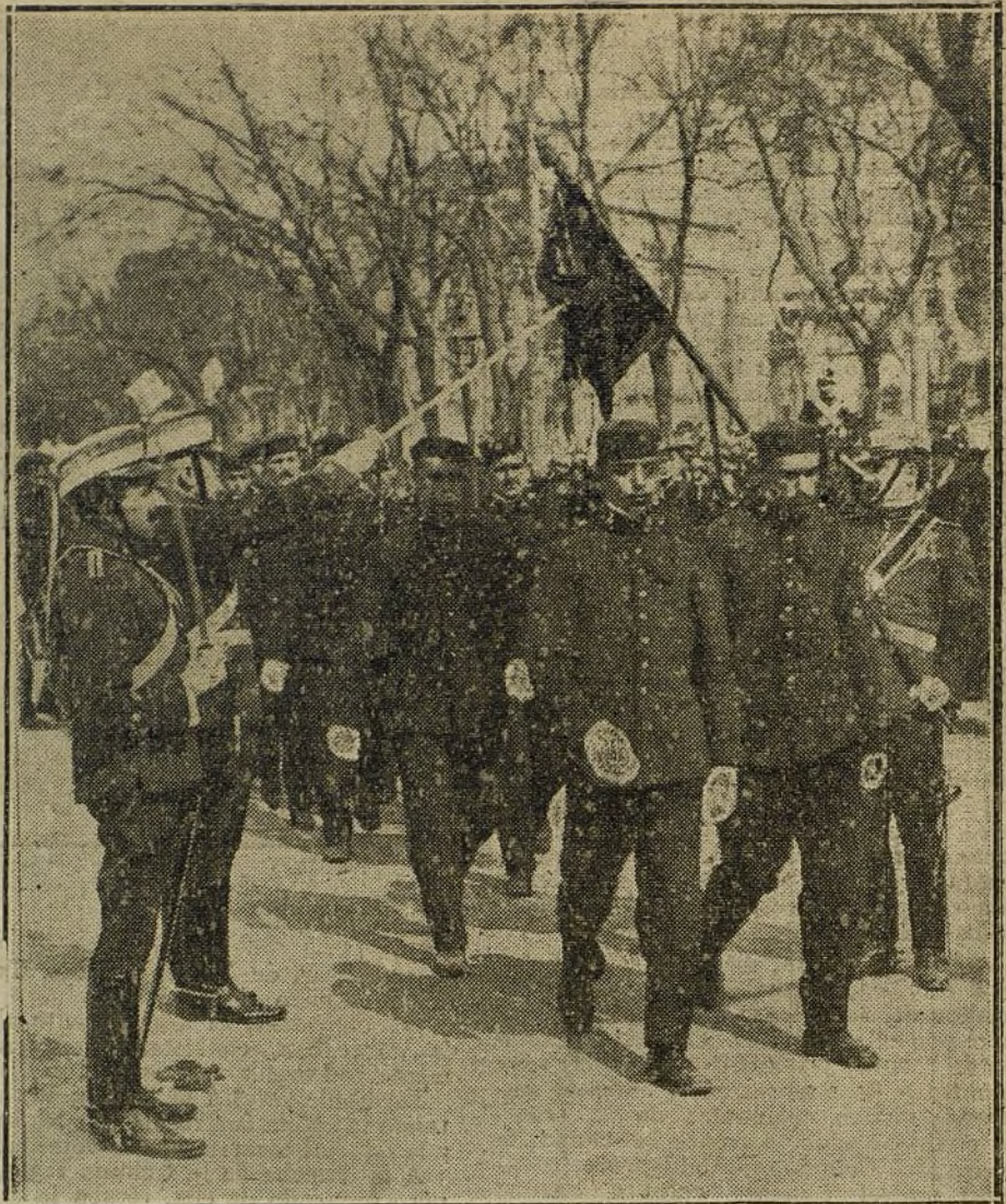
LA JURA DE LA BANDERA.—Los nuevos reclutas desfilando por debajo de la bandera.

Beso, sollozo, risa de mujeres, dolor, llanto sin lágrimas; tal eres, cantar, dulce cantar andaluz, relámpago de sombras y de luz,