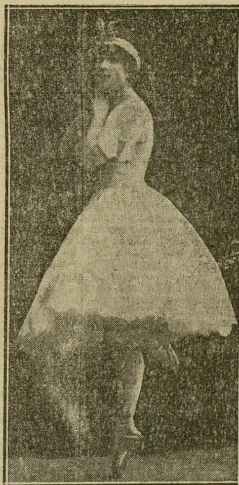
La notable danzarina francesa FELYNE VERBIST

Ante un público selectísimo, que llenaba todas las localidades del teatro de la