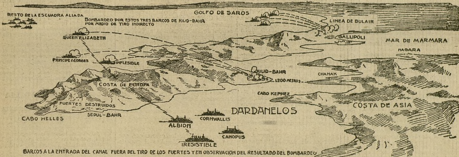
BARCOS A LA ENTRADA DEL CANAL FUERA DEL TIRO DE LOS FUERTES Y EN OBSERVACION DEL RESULTADO DEL BOMBARDEO

Al comienzo del bombardeo del estrecho por los barcos de la escuadra franco-inglesa, dije que no era cosa tan fácil y hacedera, como muchos suponían, el forzar su paso, y más aún, razonando a mi modo, y mencionando de ligera el sistema de defensa que se advierte en ambas costas del mismo, y su natural, formidable situación ofensiva y defensiva, me atreví a manifestar mi humilde opinión, en la cual me ratifico, de que todos los esfuerzos de los aliados resultarían estériles, sin llegar a conseguir su objeto.