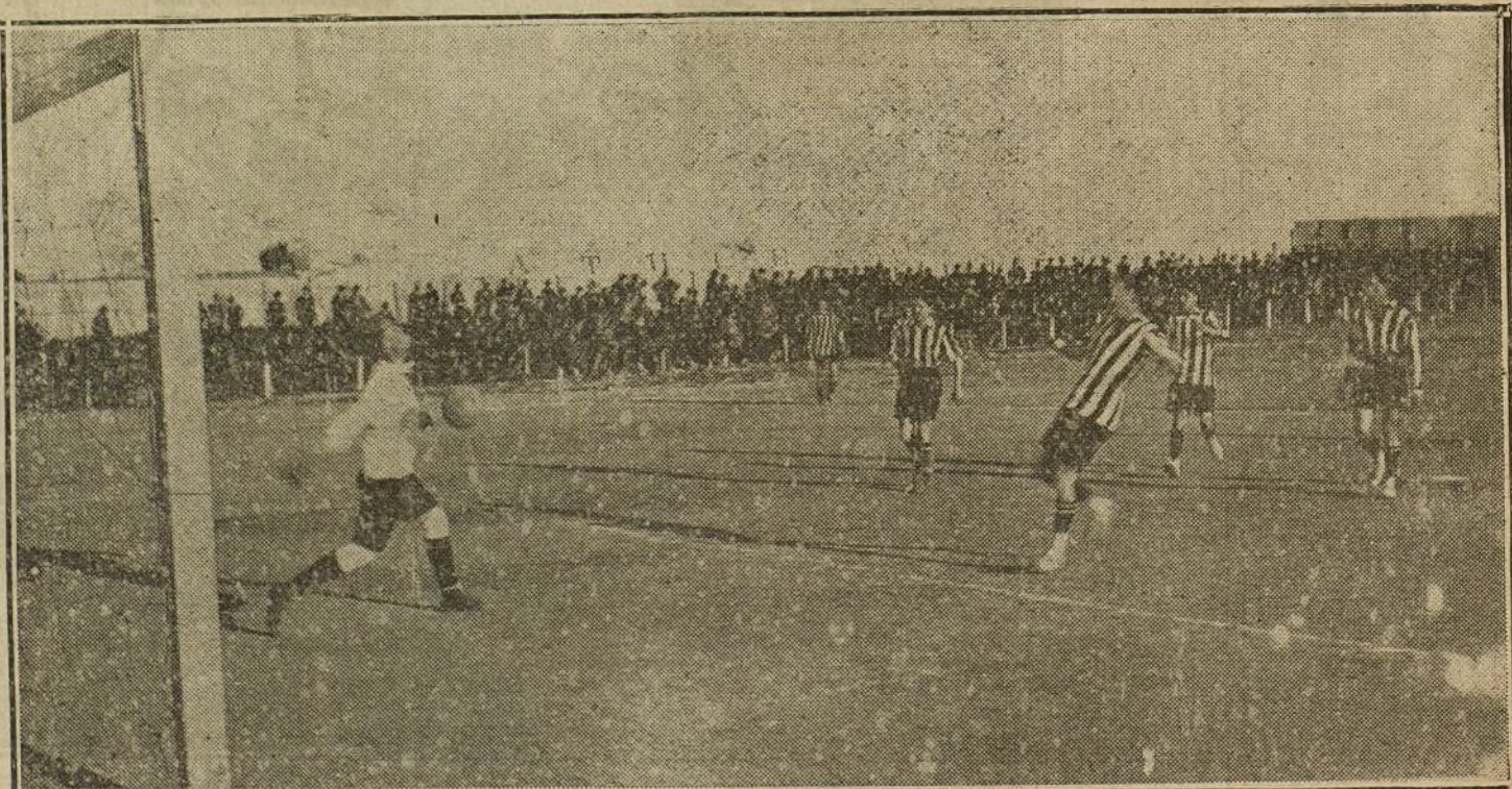
GINNASTICA-ATHLETIC.—Beguiristain parando de bolea un gran chut de Peñalosa, delantero de la Gimnástica.