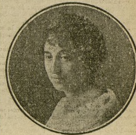
MARIA RODRIGO, autora de la música de «Becqueriana», ópera que se estrena esta noche en el teatro de la Zarzuela.